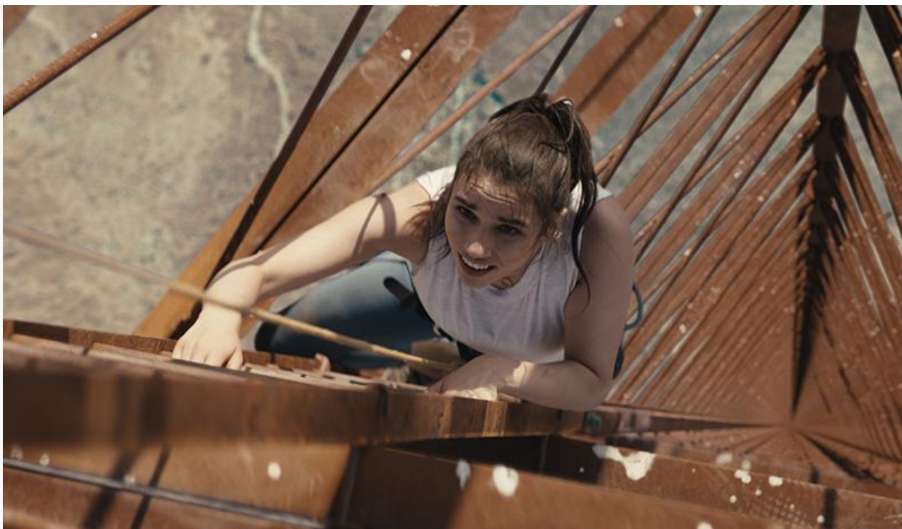
Кадр из фильма «Вышка»

Учитывая диаметрально противоположные «сарафаны», обойти «Вышку» «Челюстям: Столкновение» не удастся уже никогда. Рейтинг триллера Манна на портале «КиноПоиск» – 7,0, рейтинг триллера Нанна – всего 4,5. Впрочем, и «Вышке», судя по предпродажам новинок наступившего уикенда, наслаждаться лидерством осталось недолго.