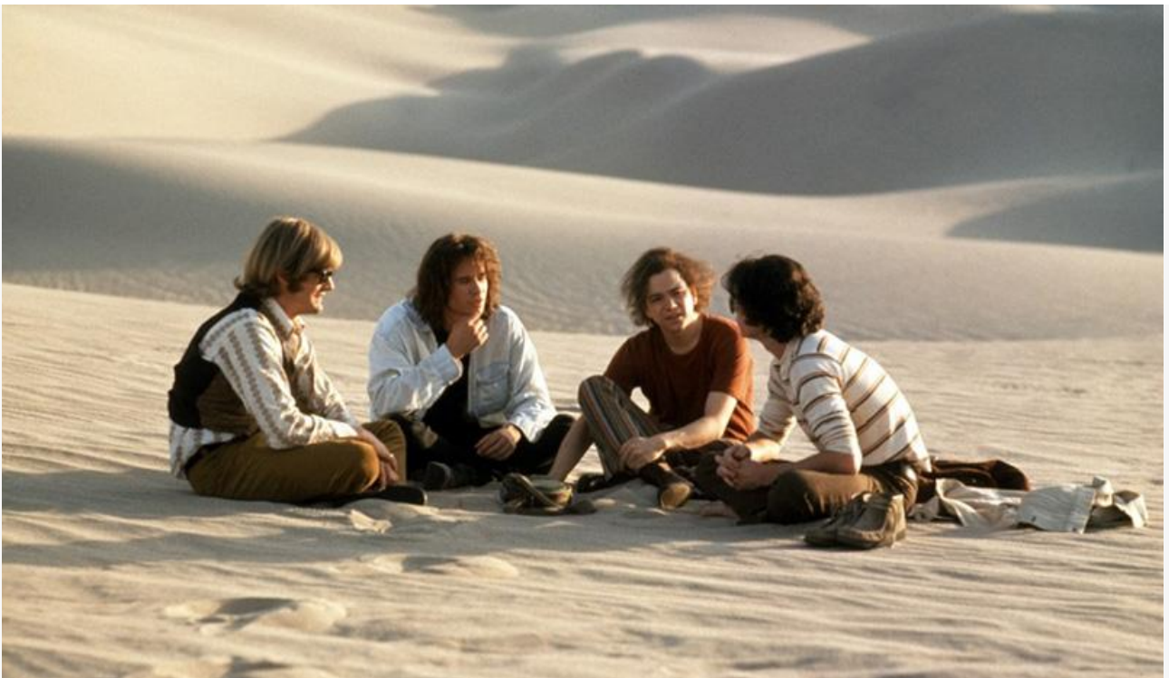
Кадр из фильма The Doors