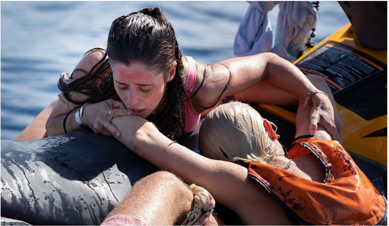
Кадр из фильма «Челюсти: Столкновение»