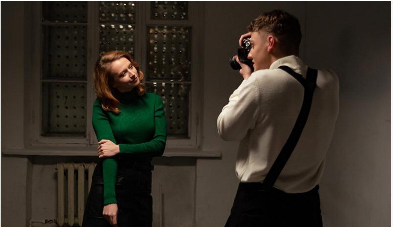
Кадр из фильма «Ночной режим»

Общая касса топ-20 фильмов уикенда, по информации «Бюллетеня кинопрокатчика», составила 128 миллионов рублей. Это на 5 % больше по сравнению с предыдущими выходными , но на 75,8 % ниже показателя аналогичного уикенда прошлого года.