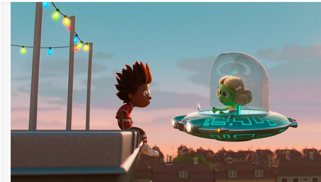
Кадр из фильма «Гостя из космоса»