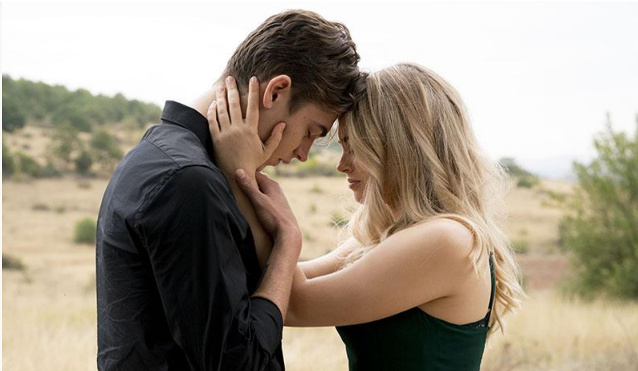
Кадр из фильма «После. Долго и счастливо»

Найдёт своего зрителя и латышско-американский детективный триллер Штефана Рика «Идеальное убийство» с Джонатаном Ризом Майерсом и Люком Клайнтенком в главных ролях.