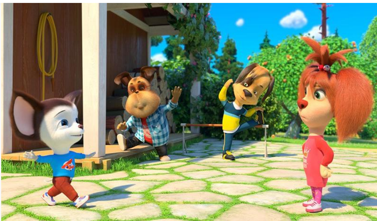
Кадр из фильма «Барбоскины Team»