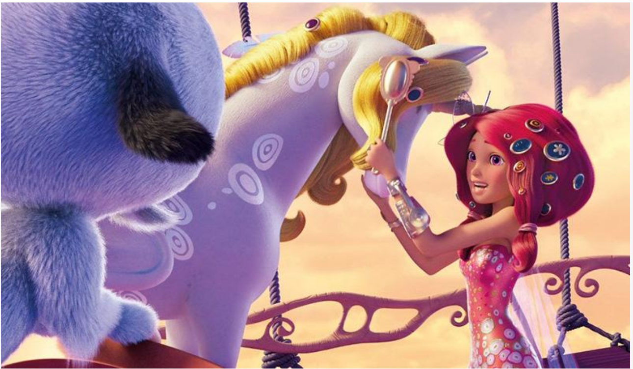
Кадр из фильма «Мия и я: Легенда Сентопии»