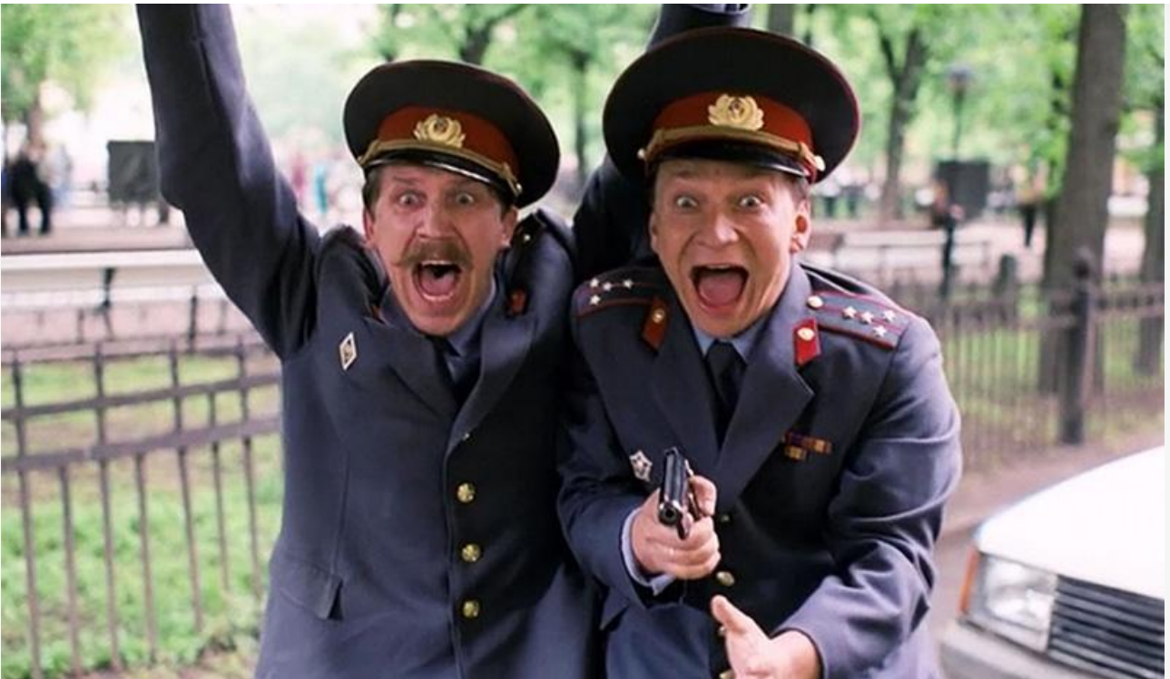
Кадр из фильма «Ширли-мырли»