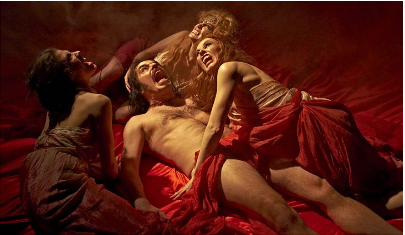
Кадр из фильма «Реальные упыри»