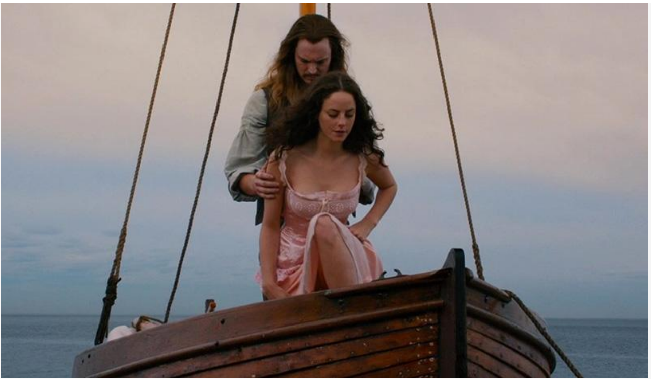
Кадр из фильма «Русалка и дочь короля»

Семейно-патриотические « Нахимовцы » Олега Шторма за свой третий уикенд потеряли в сборах сразу 59 %, на 965 экранах наскребли жалкие 5,1 миллиона и опустились с третьего на восьмое место чарта. Выше них оказались не только четыре премьеры и «Пёс-самурай», но и хоррор Эмерсона Мура « Клаустрофобы: Долина дьявола » (5,8 миллиона на 541 экране), и непотопляемая « Одна » Дмитрия Суворова (5,6 миллиона на 302 экранах).