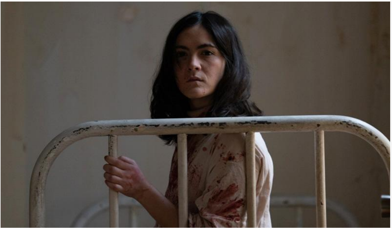
Кадр из фильма «Дети тьмы: Первая жертва»