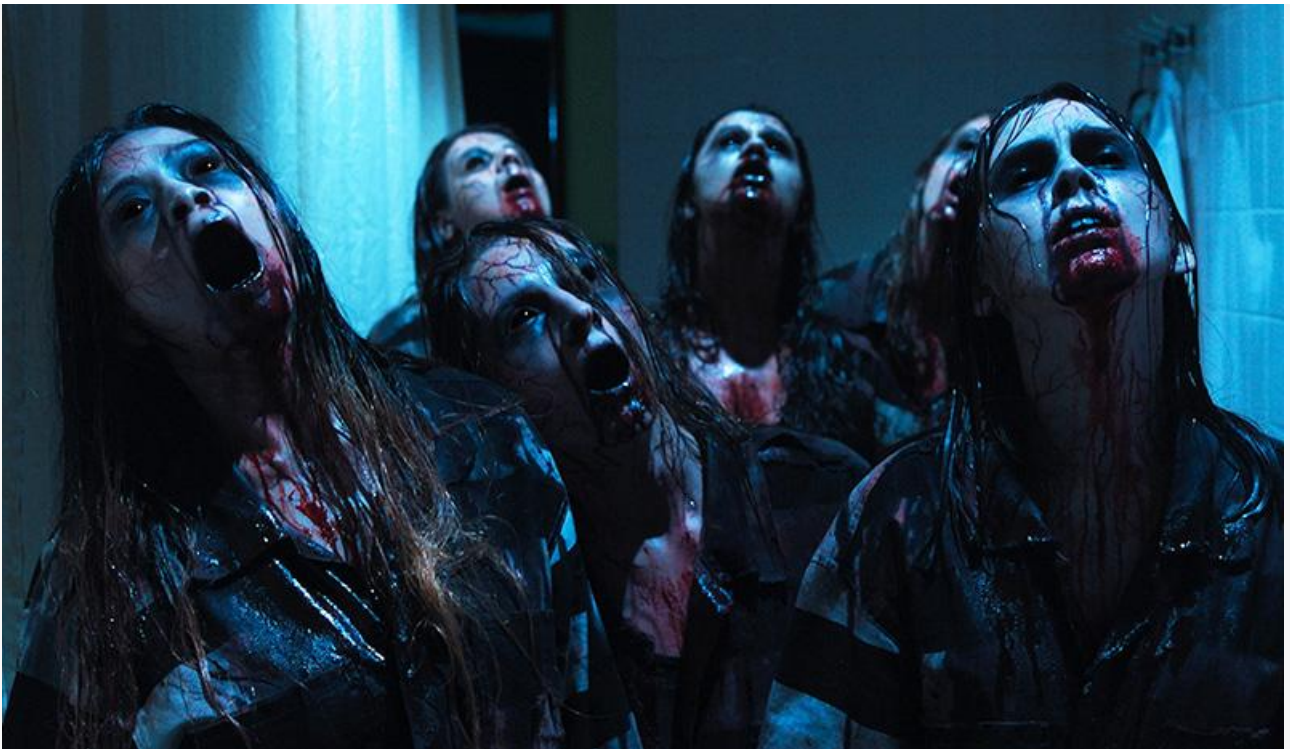
Кадр из фильма «Проклятый остров»