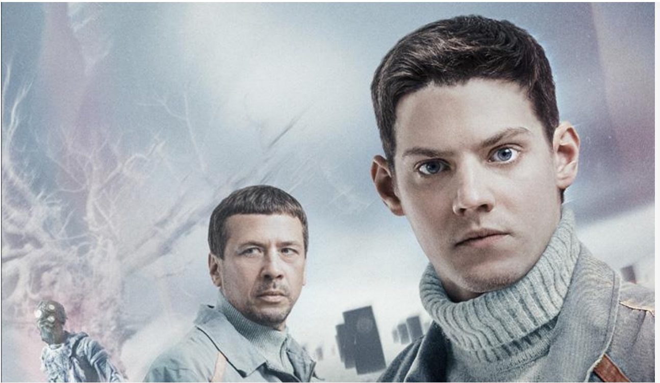
Постер к фильму «Ночной режим»