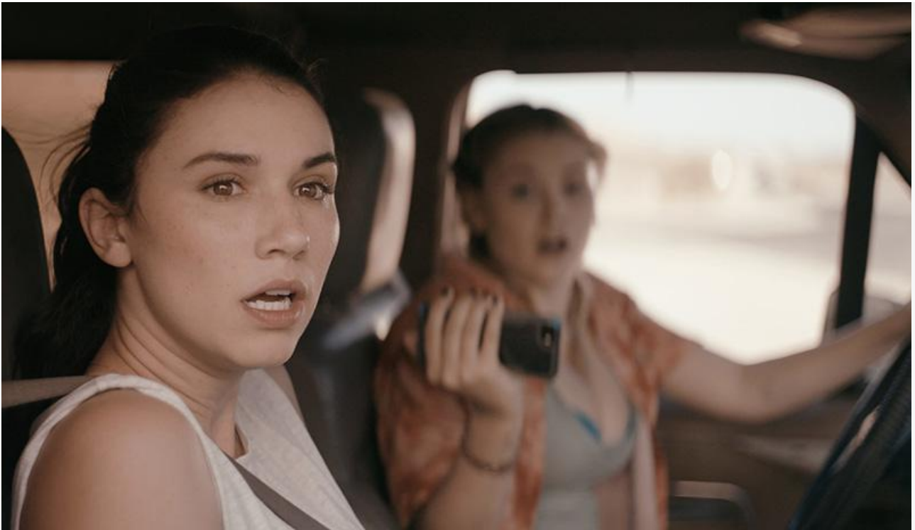
Кадр из фильма «Вышка»

Отметим довольно высокие рейтинги лидера: 7.0 на портале «КиноПоиск» и 6,6 на Film.ru и «Кинориум». Положительный «сарафан» даёт шанс «Вышке» удержаться на первой строке чарта и после второго уикенда, несмотря на серьёзного конкурента в лице хоррора «Челюсти: Столкновение», вышедшего в прокат 18 августа.