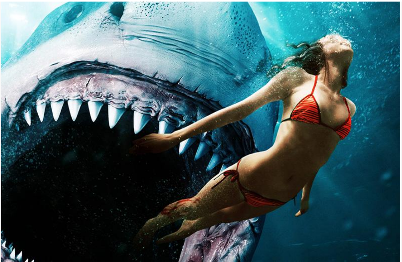
Постер к фильму «Челюсти: Столкновение»

Неплохие шансы на попадание в топ-10 у фэнтезийного мультфильма производства Германии, Австралии, Бельгии и Индии « Мия и я: Легенда Сентопии » и российского фантастического триллера Андрея Либенсона « Ночной режим » (18+) с Андреем Мерзликиным, Павлом Табаковым и Екатериной Шумаковой в главных ролях.