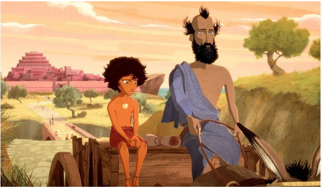
Кадр из мультфильма «Икар»