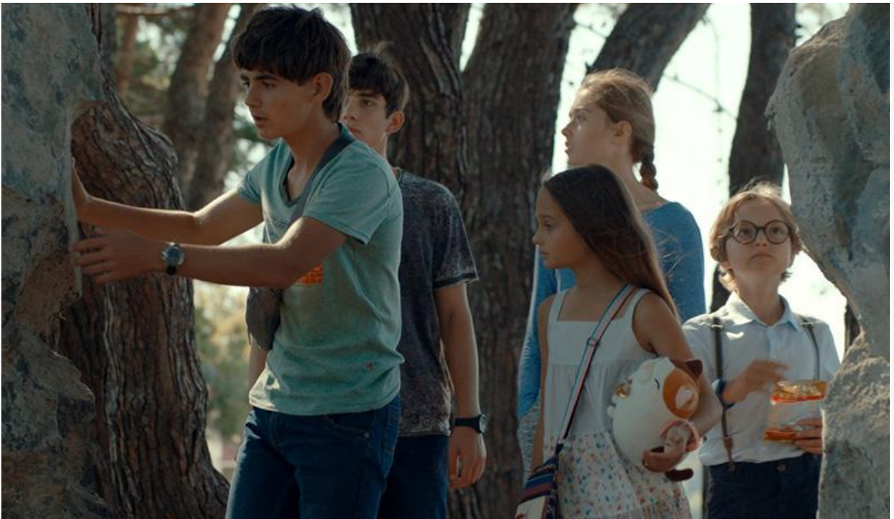
Кадр из фильма «Легенды Орлёнка»