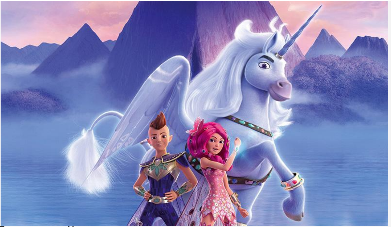
Постер к фильму «Мия и я: Легенда Сентопии»