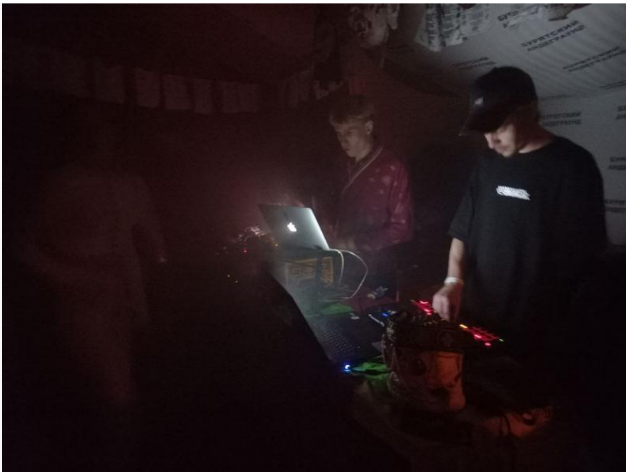
Самая громкая ночь в истории Буряад театра

Основная часть, конечно, музыкальная. Фестивали в Бурятии, прямо говоря, почти все прошли — но это не тот случай, когда на безрыбье и рак рыба. Лайнап действительно оказался симпатичным: Нерпа, Sleepyforever, Ian Hopeless и другие. Кратко расскажем об этих артистах.