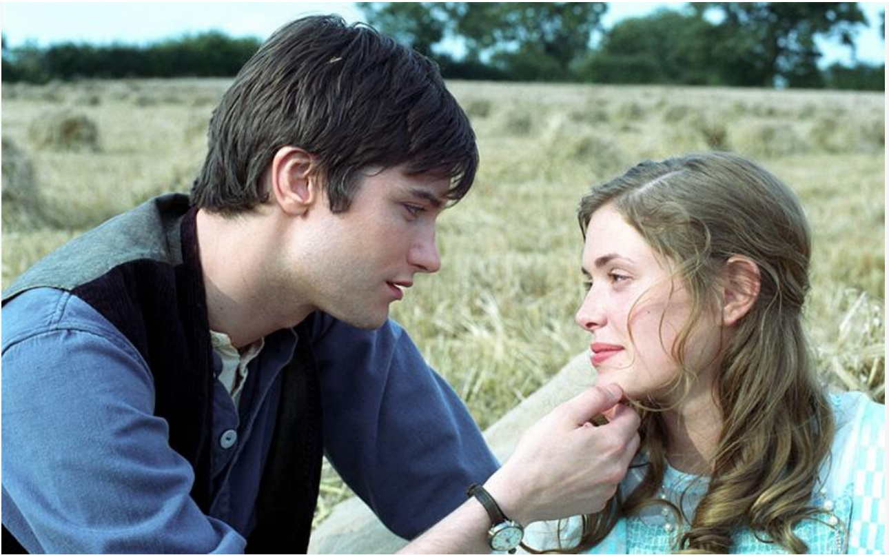
Кадр из сериала «Сага о Форсайтах». Великобритания, 2002 год

Скончался Джон Голсуорси 31 января 1933 года в Лондоне от опухоли мозга. За два месяца до ухода из жизни смертельно больному писателю была присуждена Нобелевская премия по литературе с формулировкой «за высокое искусство повествования, вершиной которого является „Сага о Форсайтах“».