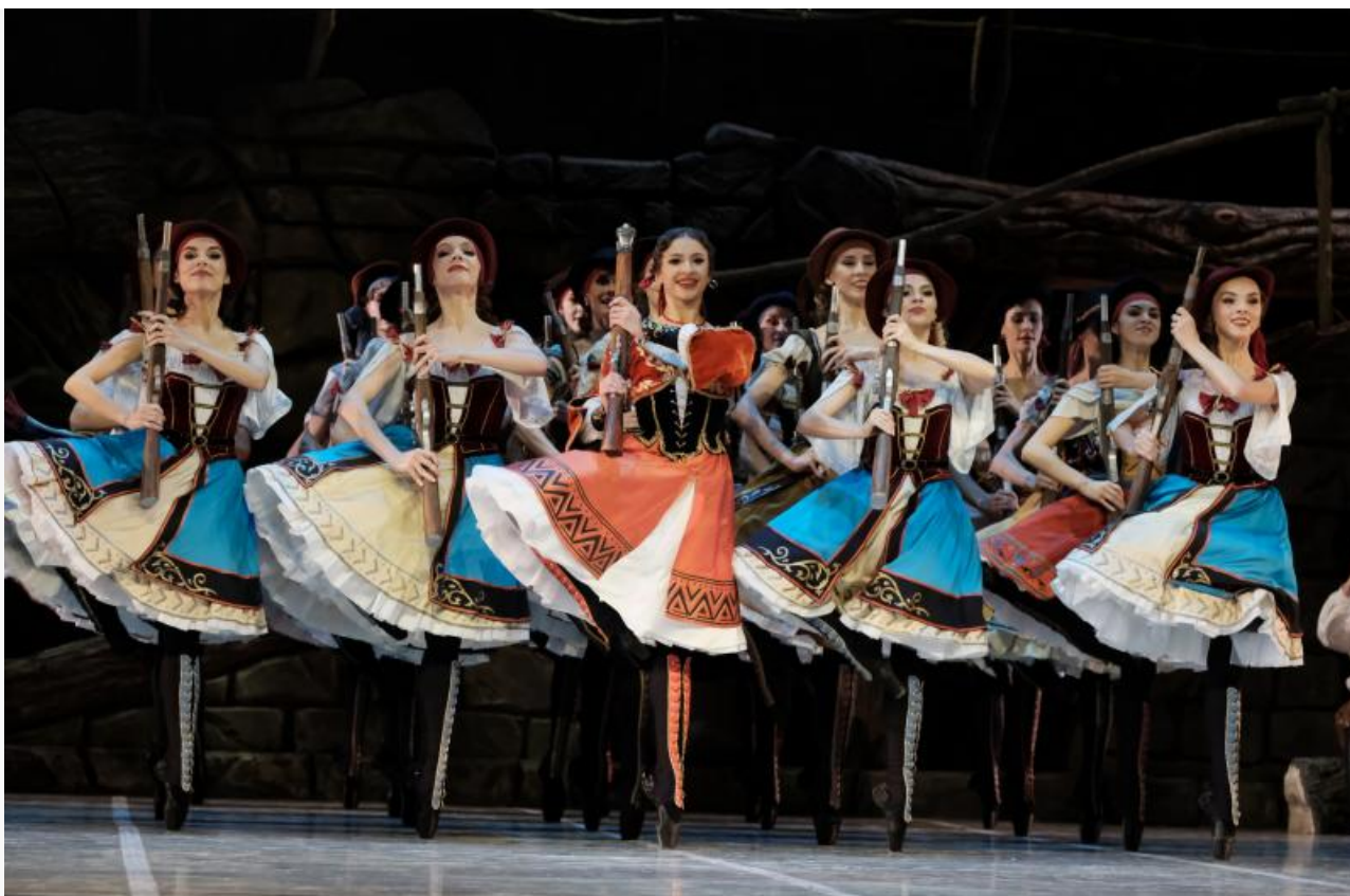
Балет «Катарина, или Дочь разбойника»