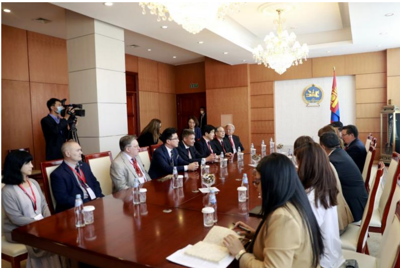
Фото: Gogo. mn

Автор: Денис Большаков © Babr24.com ЗДОРОВЬЕ, ОБЩЕСТВО, МОНГОЛИЯ, РОССИЯ 6383 09.08.2022, 19:49 815