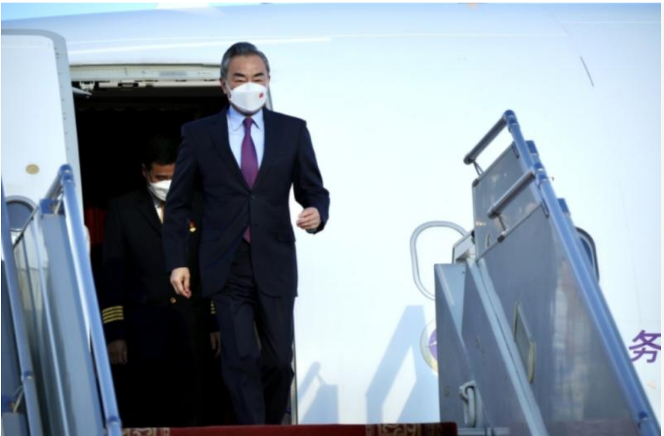
Фото: информационное агентство Монцамэ

Автор: Денис Большаков © Babr24.com ПОЛИТИКА, ЭКОНОМИКА И БИЗНЕС, ОБЩЕСТВО, МОНГОЛИЯ, КИТАЙ 👁 26904 08.08.2022, 16:47 🗨 846