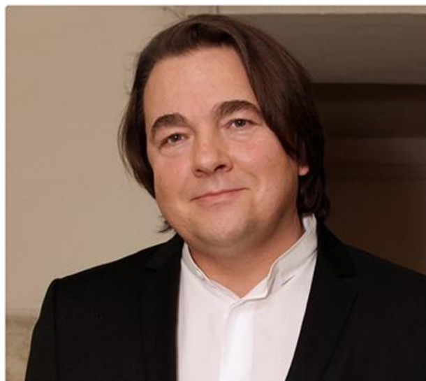
КОНСТАНТИН ЛЬВОВИЧ ЭРНСТ