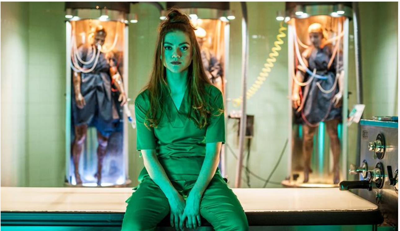
Кадр из фильма «От рассвета до заката»

Общая касса топ-20 фильмов уикенда, по информации «Бюллетеня кинопрокатчика», составила 123 миллиона рублей. Это на 12,1 % меньше по сравнению с предыдущими выходными и на 67,2 % ниже показателя аналогичного уикенда прошлого года.