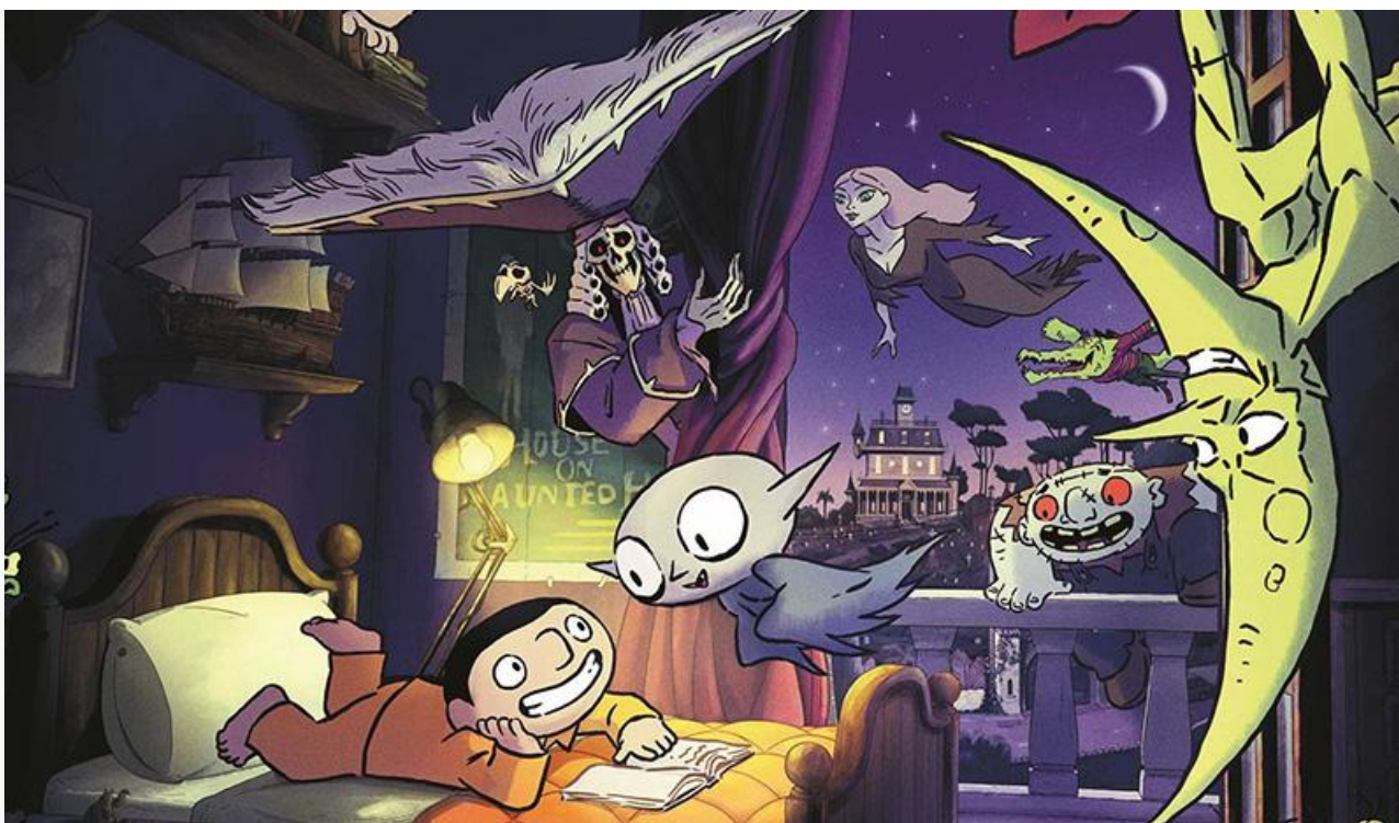
Постер к фильму «Семейка монстров»

Также на экраны выходят франко-бельгийский хоррор Арно Малерба «Бойся темноты» , китайский фантастический боевик Линя Чжэньчао «Земля. Перезагрузка» , канадский хоррор Крэйга Дэвида Уоллеса