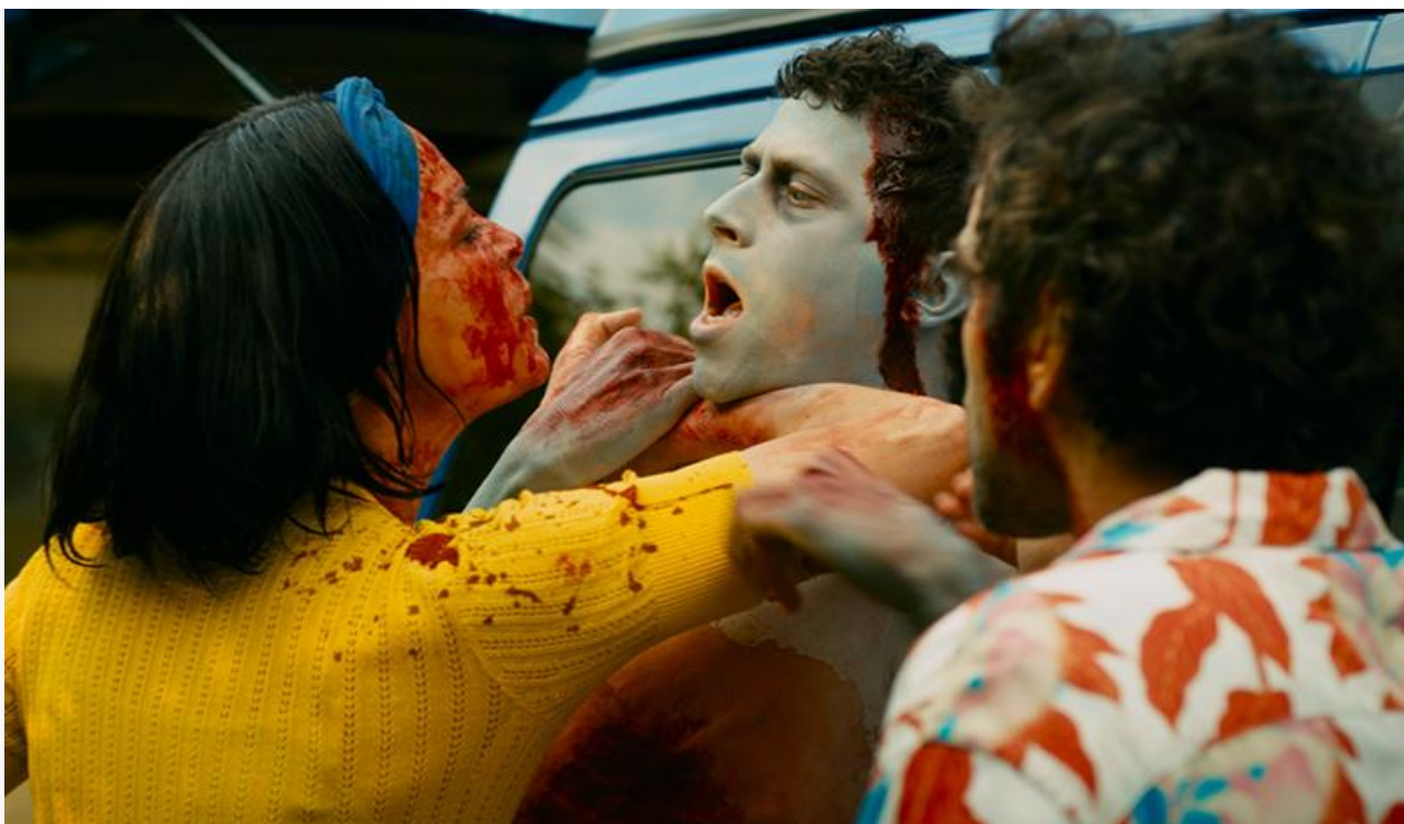
Кадр из фильма «Убойный монтаж»

Наиболее перспективными в плане зрительского интереса видятся премьеры франко-британской комедии ужасов Мишеля Хазанавичуса «Убойный монтаж» , успевшей засветиться на Каннском кинофестивале, и франко-бельгийского фэнтезийного мультфильма Жоанна Сфара «Семейка монстров» .