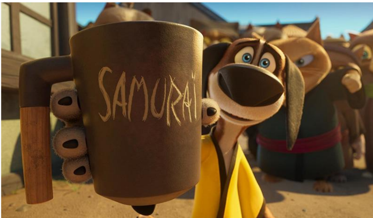
Кадр из фильма «Пёс-самурай и город кошек»

К слову, «сарафан» у первой в истории отечественного кинопроката картины, снятой при содействии Фонда поддержки военно-патриотического кино, крайне сдержанный: рейтинг «Нахимовцев» на портале «КиноПоиск» всего 5,4. У «Пса-самурая» он на целый балл выше: 6,4.