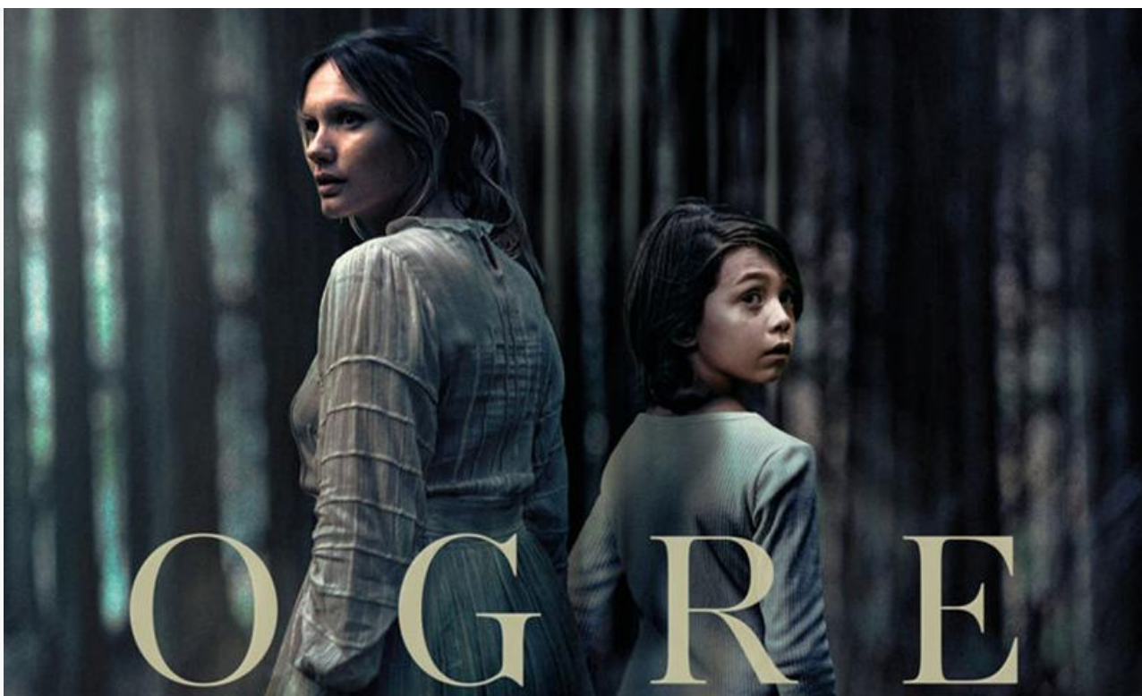
Постер к фильму «Бойся темноты»