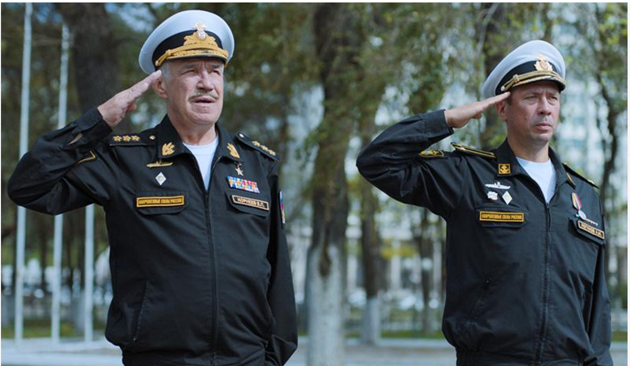
Кадр из фильма «Нахимовцы»