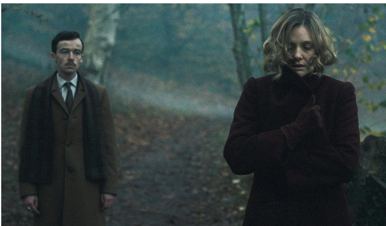
Кадр из фильма «Уховёртка»