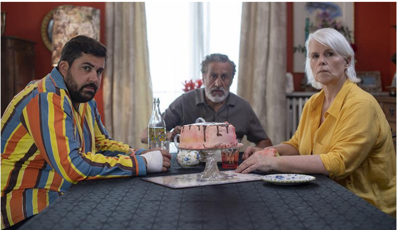
Кадр из фильма «Не звезды!»

Среди старожилов проката места в десятке лидеров сохранили драма Дмитрия Суворова «Одна» (8,9 миллиона и четвёртое место), а также хорроры «Кукла. Последнее проклятье» (7,2 миллиона и шестое место) и «Открытое море: Монстр глубины» (5,1 миллиона и седьмое место).