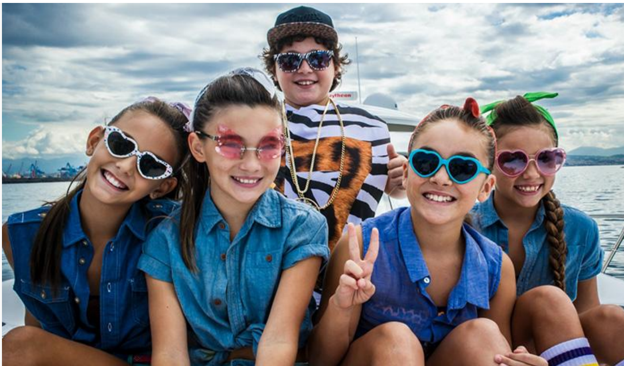
Кадр из фильма «Из Неаполя с любовью»