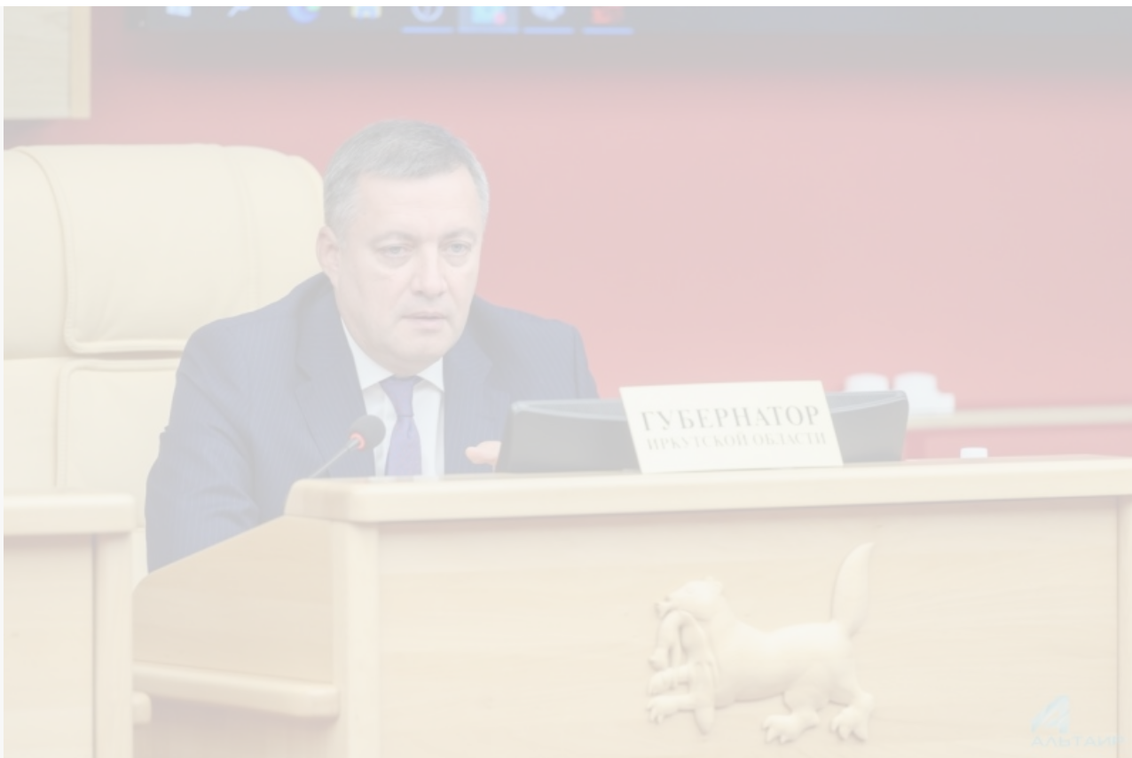
Кобзев Игорь, Иркутск, 34-я сессия Законодательного собрания Иркутской области, 30 сентября 2020., фотограф: Татьяна Глюк © Проект "Лица Сибири"