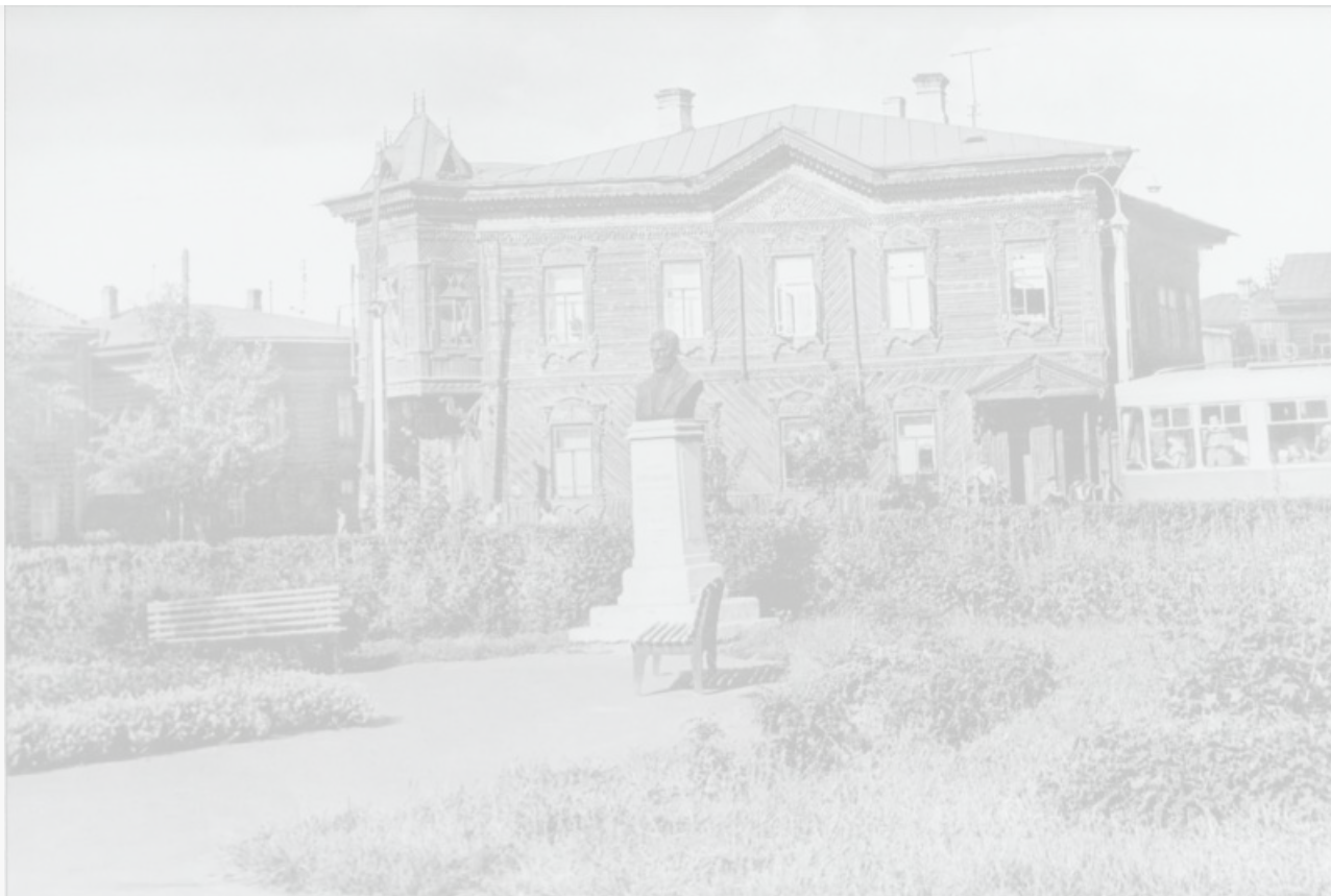
Памятник и площадь Батенькова в 1960 – 1980-е годы

В мэрии памятник не отдали, но то, что его нужно реставрировать, подтвердили — постамент загрязнен и покосился, весь в трещинах и отпавшей штукатурке. Вопрос власти пообещали решить, забрав бюст на баланс города.