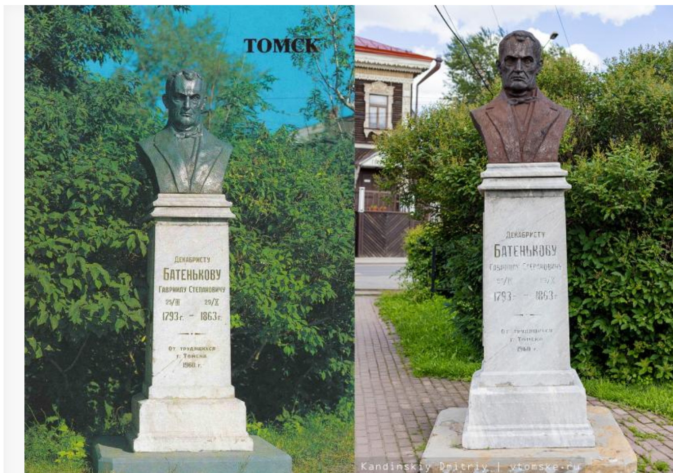
Памятник Батенькову на открытке 1987 года и на современной фотографии.

Разрушающийся памятник Гавриилу Батенькову, годом ранее чуть не отвезенный на реставрацию в Ниццу, все же останется в Томске — чинить его будет администрация Советского района. Правда, пока у властей нет ни денег, ни конкретных планов.