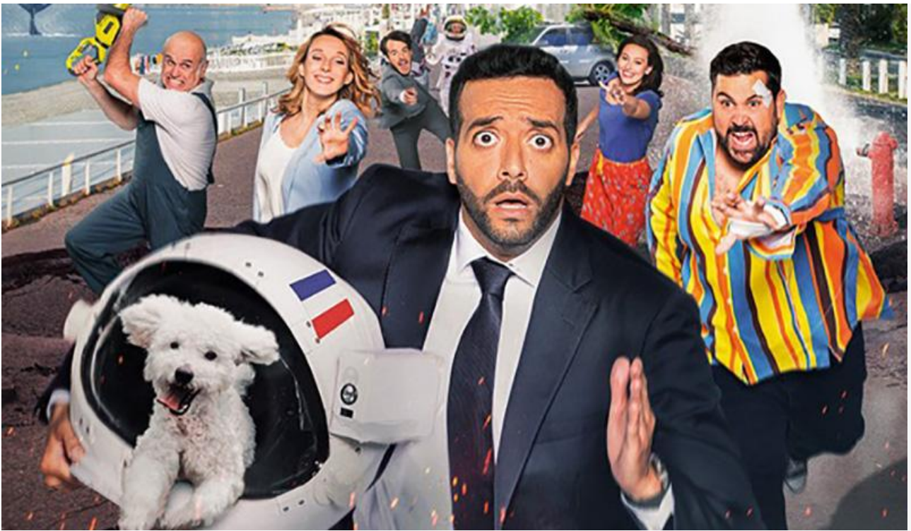
Постер к фильму «Не звезды!»