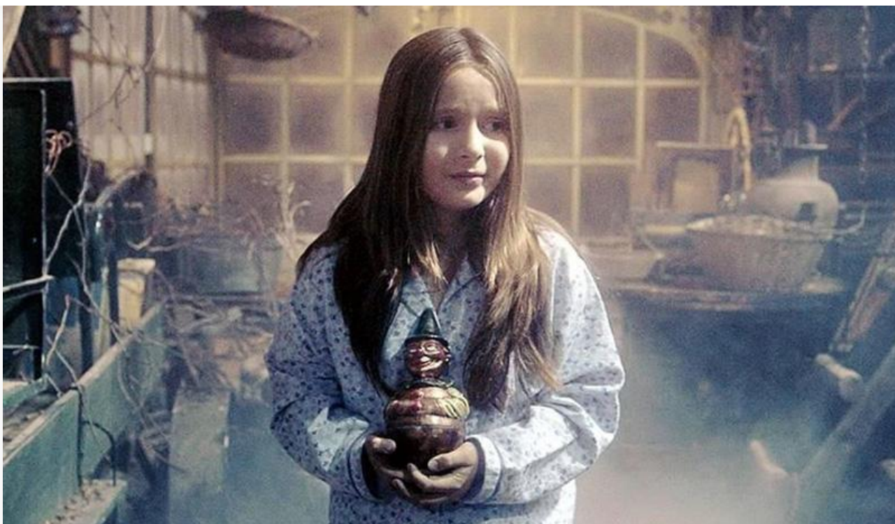
Кадр из фильма «Кукла. Последнее проклятие»