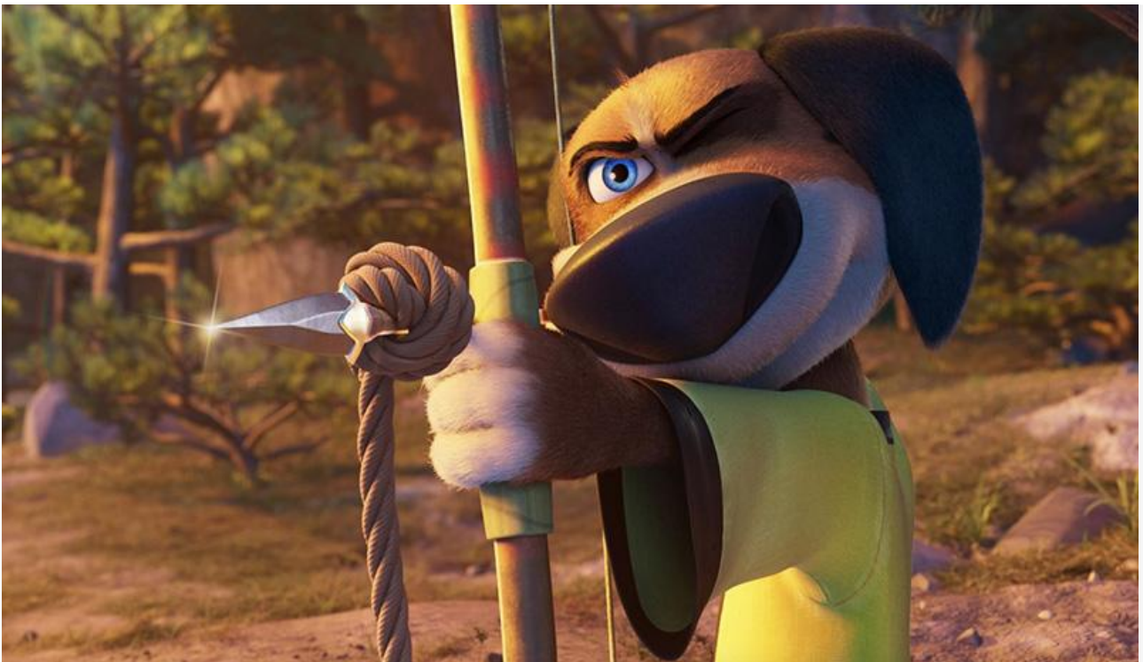
Кадр из фильма «Пёс-самурай и город кошек»

Как и предсказывали аналитики, лидером проката по итогам уикенда 21–24 июля стал британо-американский мультфильм Роба Минкоффа и Марка Коэтсера «Пёс-самурай и город кошек». По данным портала Kinobusiness.com, анимационная комедия со слоганом «Почти герой, но у него лапки» за свои первые выходные в России на 1 806 экранах заработала 39,3 миллиона рублей и уверенно заняла первое место.