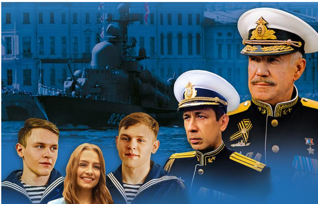
Постер к фильму «Нахимовцы»

В том, что фильм Олега Шторма будет одним из лидеров, сомнений нет никаких, главная интрига – сможет ли он обойти «Пса-самурая» и занять первое место.