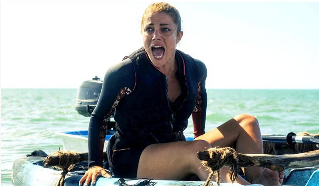
Кадр из фильма «Открытое море: Монстр глубины»