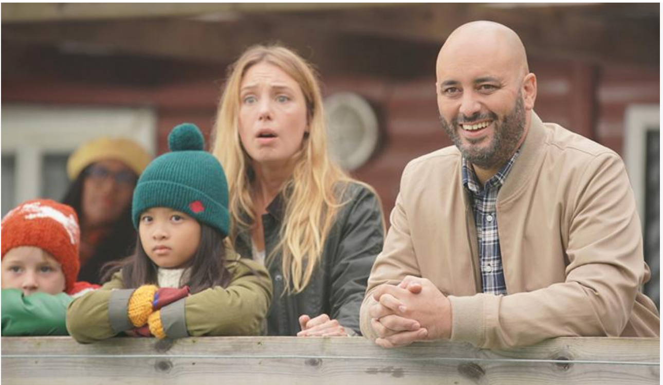
Кадр из фильма «Неувольняемый»