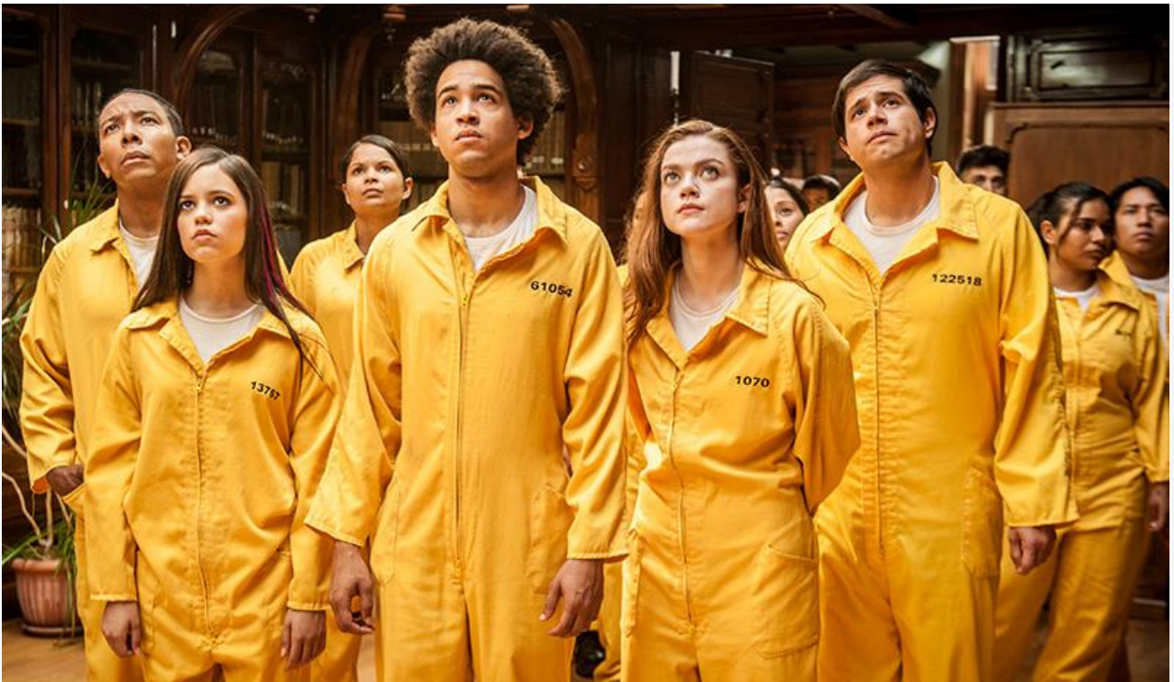
Кадр из фильма «От рассвета до заката»

В формате переиздания повторно выходят на большие экраны франко-бельгийская комедия Филиппа де Шоврона 2017 года « Безумные соседи », итальянская комедия Гуидо Къезы 2020 года « Начать с нуля », культовая скандинавская драма Томаса Винтерберга 2012 года « Охота », номинированная на «Оскар» в категории «Лучший фильм на иностранном языке», и фантастическая кинокомедия Георгия Данелии 1986 года « Кин-дза-дза! », весьма оригинально прорекламированная «Мосфильмом»: