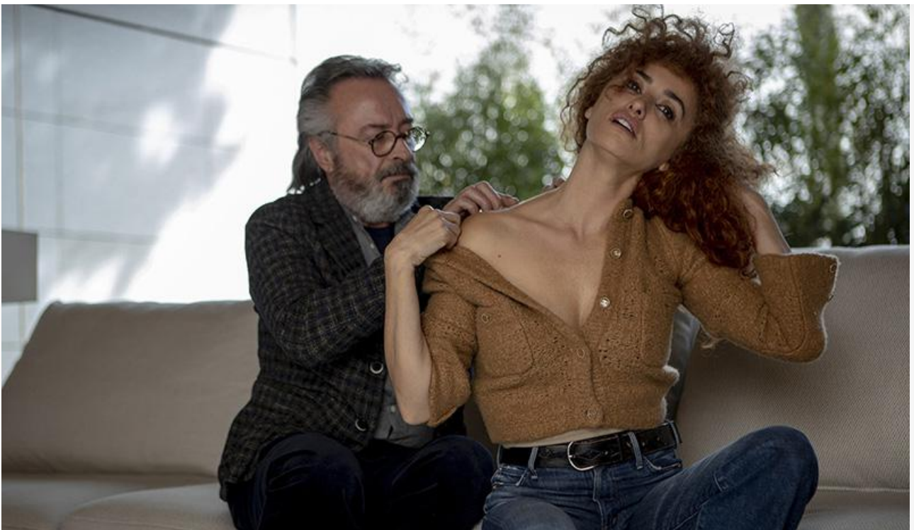
Кадр из фильма «Главная роль»

Общая касса топ-20 фильмов уикенда, по информации «Бюллетеня кинопрокатчика», составила 140 миллионов рублей. Это на 4,4 % больше по сравнению с предыдущими выходными и на 59 % меньше, чем за аналогичный уикенд прошлого года.