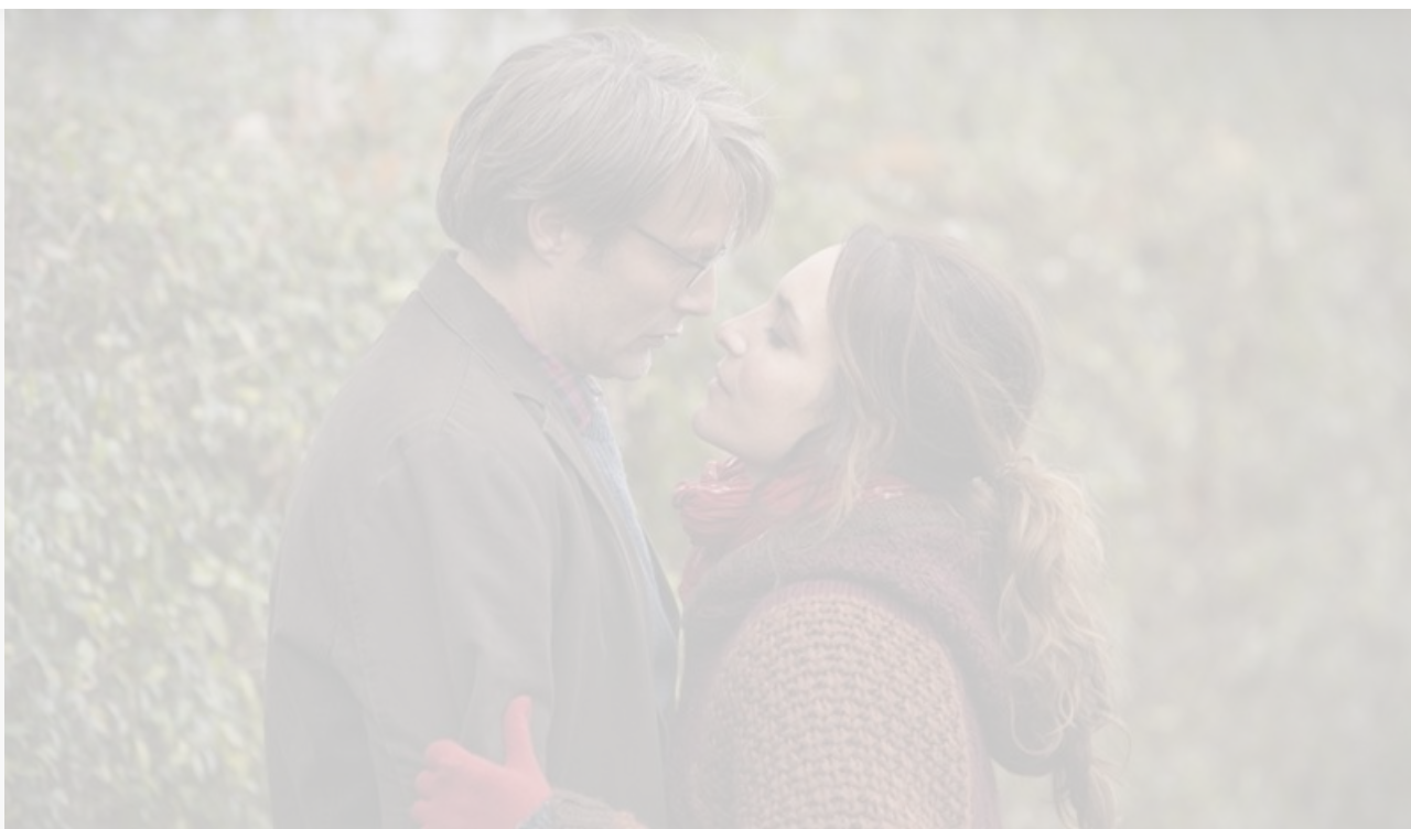
Кадр из фильма «Охота»