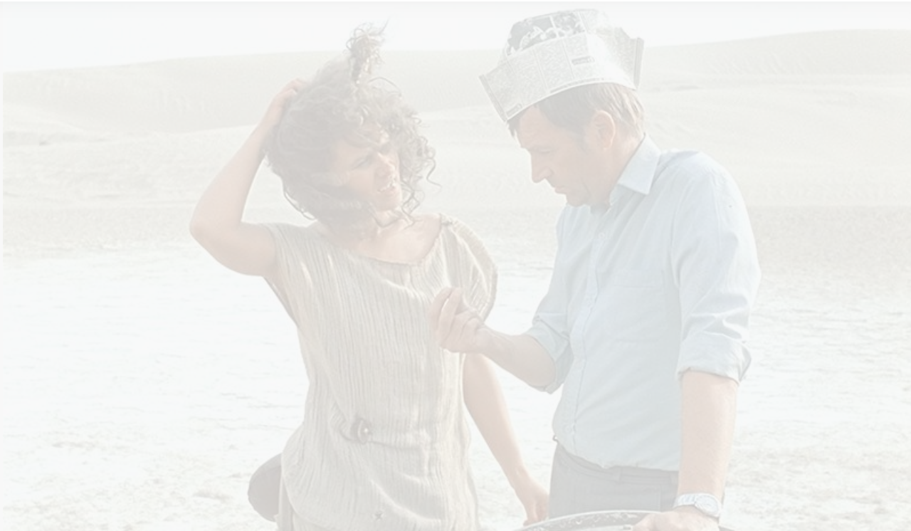
Кадр из фильма «Кин- дза-дза!»