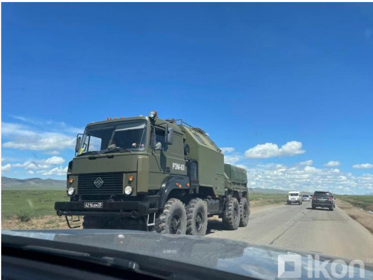
Российская военная техника в окрестностях Улан-Батора.

Однако глава МИД Монголии Б. Батцэцэг 26 июля выступила на пресс-конференции с официальным заявлением о том, что учения «Селенга-2022» не нарушают никаких действующих законов. Все мероприятия были согласованы обеими сторонами, а подобные тактические манёвры проводятся каждый год.