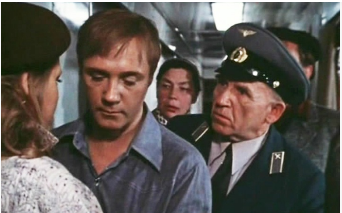
нижеподписавшиеся», 1981 год