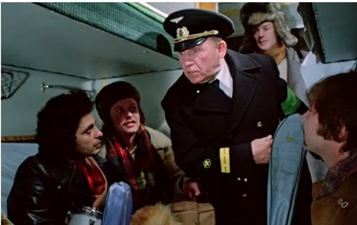
«Чародеи», 1982 год