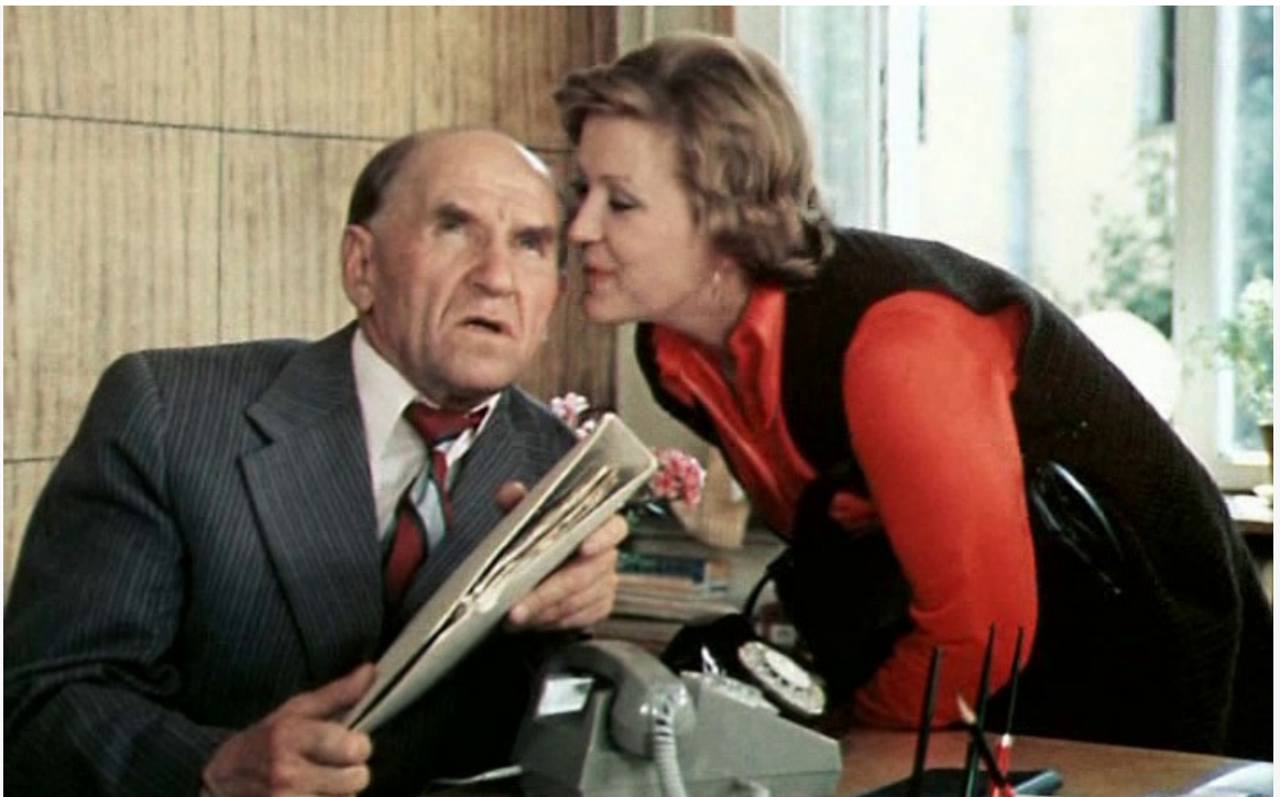
Заместитель Галины Аркадьевны Трошкин в фильме «По семейным обстоятельствам», 1978 год

Экранный образ бюрократа-начальника в исполнении Парфёнова пришёлся как нельзя ко двору создателям сатирического киножурнала «Фитиль». С 1966 по 1994 год актёр снялся в 45 выпусках этого популярного киножурнала.