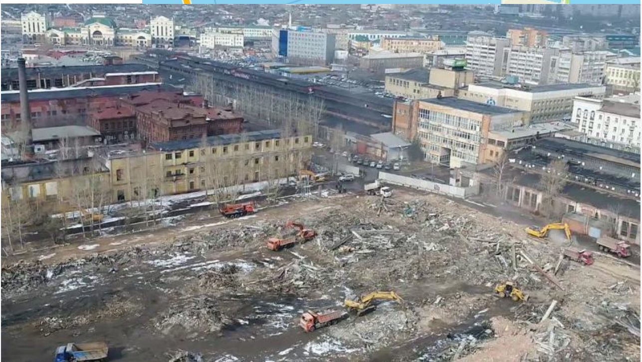
Территория некогда великого предприятия пришла в запустение