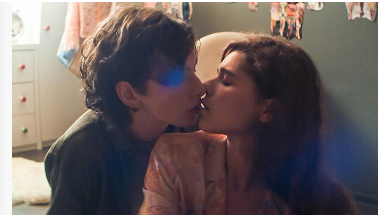
Кадр из фильма «Страна Саша»

Общая касса топ-20 фильмов уикенда, по информации «Бюллетеня кинопрокатчика», составила 134 миллиона рублей. Это на 7 % больше по сравнению с предыдущими выходными и на 52 % меньше, чем за аналогичный уикенд прошлого года.