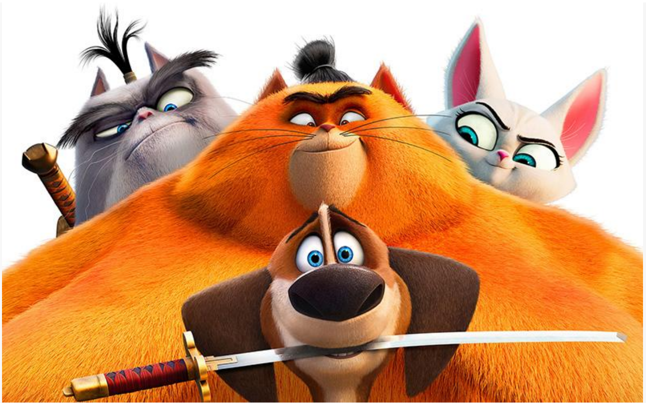
Постер к фильму «Гёс-самурай и город кошек»