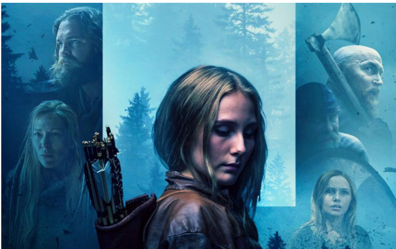
Постер к фильму