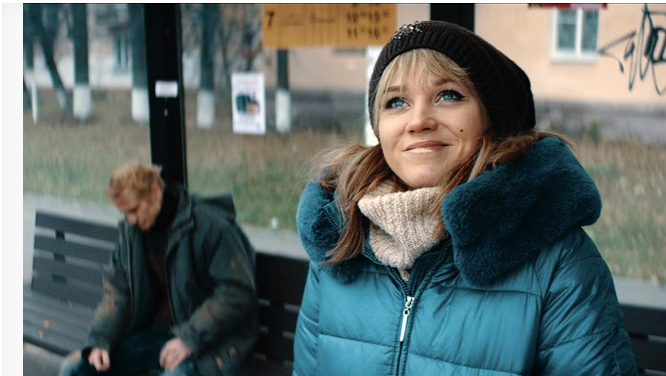
Кадр из фильма «Булки». Взгляд Кристины Асмус на вершину рейтинга проката, куда её «Булкам» больше не вернуться

Судя по рейтингам «Булок»: 5,6 на «КиноПоиске» и 3,7 на «Кинориум», падение недавней премьеры в низы рейтинга неизбежно и будет стремительным. Для сравнения: рейтинг «Одной» на «КиноПоиске» – 7,0, на «Кинориум» – 6,4.