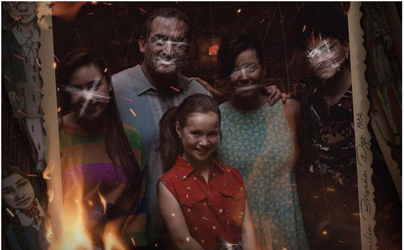
Постер к фильму «Кукла. Последнее проклятие»