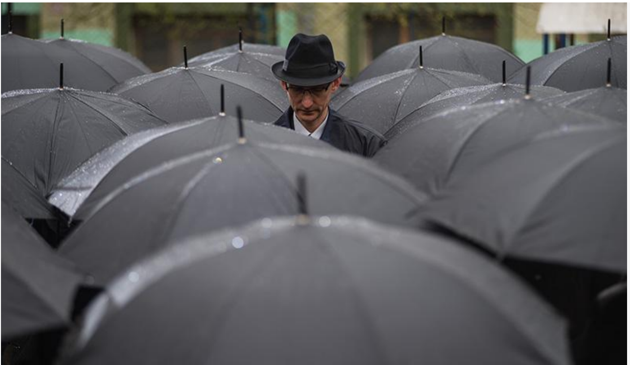
Кадр из фильма «Одержимая»

Лидером же проката неожиданно для многих стал австралийский триллер с элементами фильма ужасов от режиссёра Эндрю Трауки « Открытое море: Монстр глубины ». За первые четыре дня проката в России картина со слоганом «Страх глубже бездны» на 1 374 экранах заработала 23,6 миллиона рублей и уверенно заняла первую строку чарта.