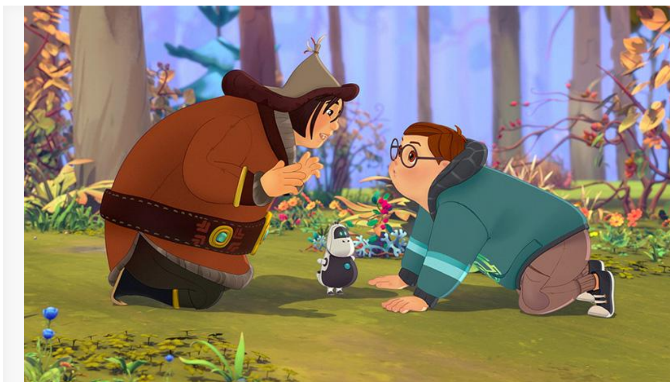
Кадр из фильма «Забывтое чудо»

Мультфильм Андрея Колпина от студии «Паровоз» «Забывтое чудо» , который прочили в лидеры проката, получил в распоряжение 1 741 экран, однако смог собрать на них лишь 7,4 миллиона рублей, встретив утро понедельника на шестой строке чарта.