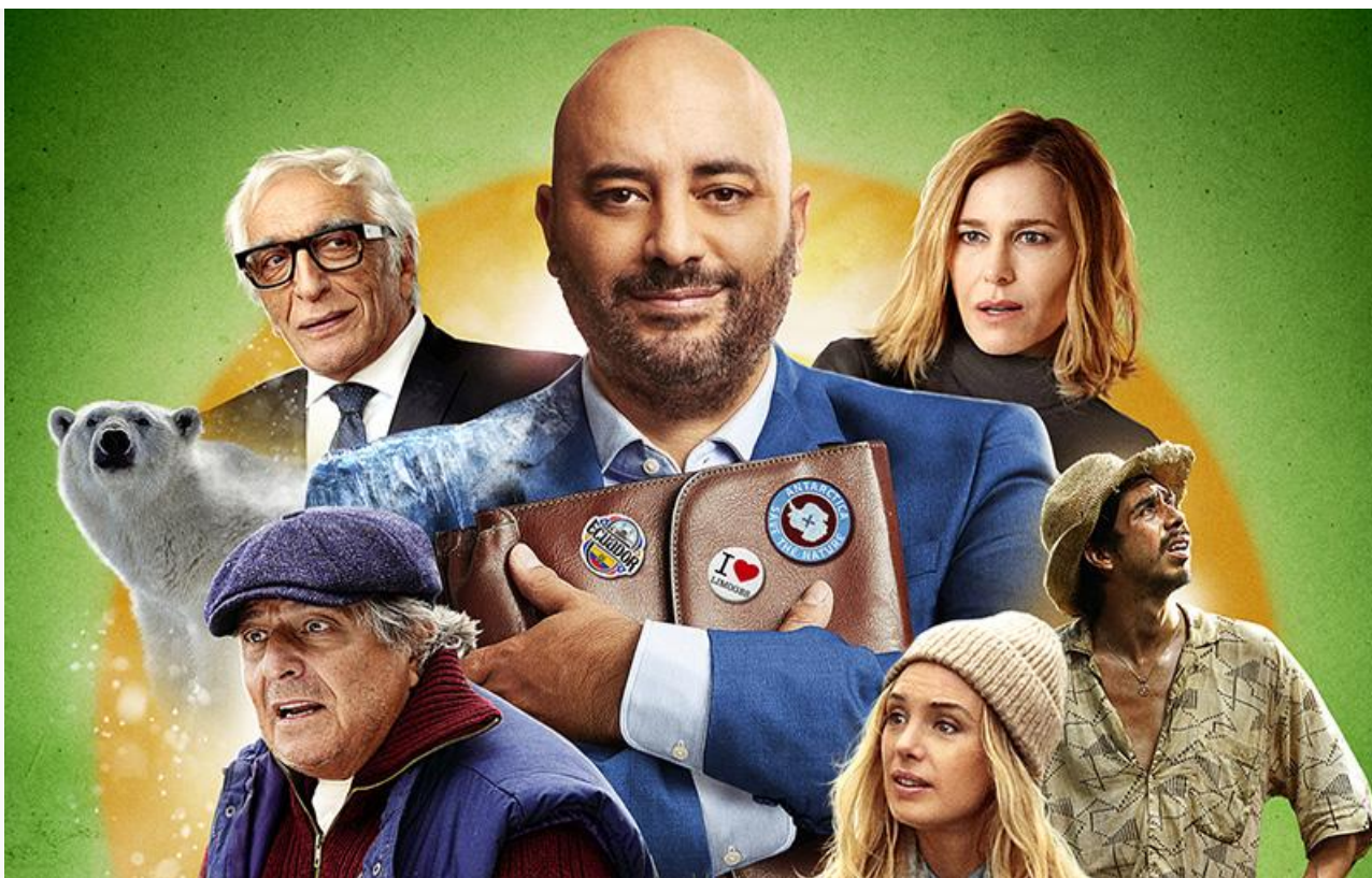
Постер к фильму «Неувольняемый»