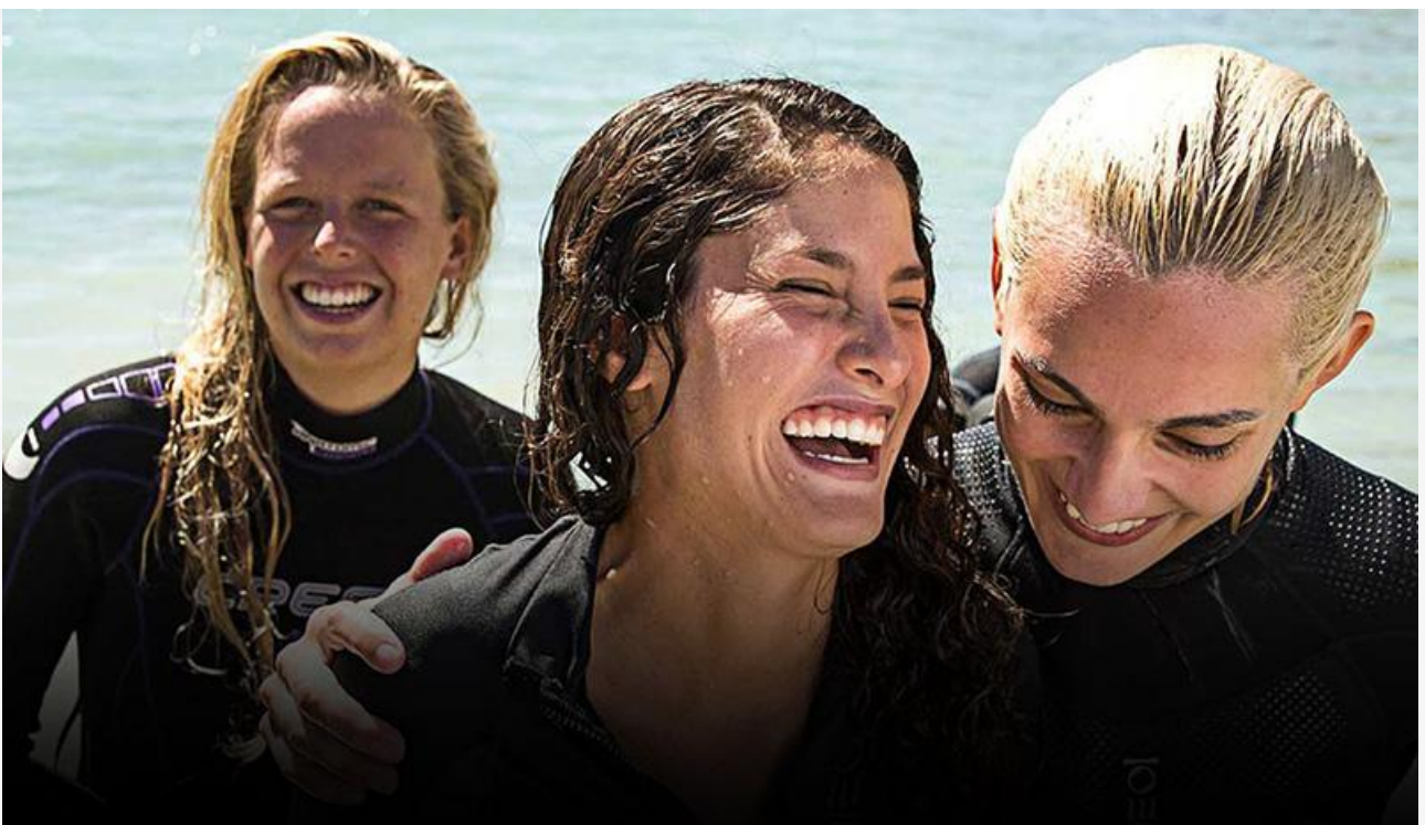
Кадр из фильма «Открытое море: Монстр глубины»

Впрочем, вряд ли триумф «Монстра глубины» будет долгим. Рейтинги фильма опустились до отметок 4,2 на «КиноПоиске» и 4,6 на IMDb, что свидетельствует об отрицательном «сарафане» австралийского хоррора.