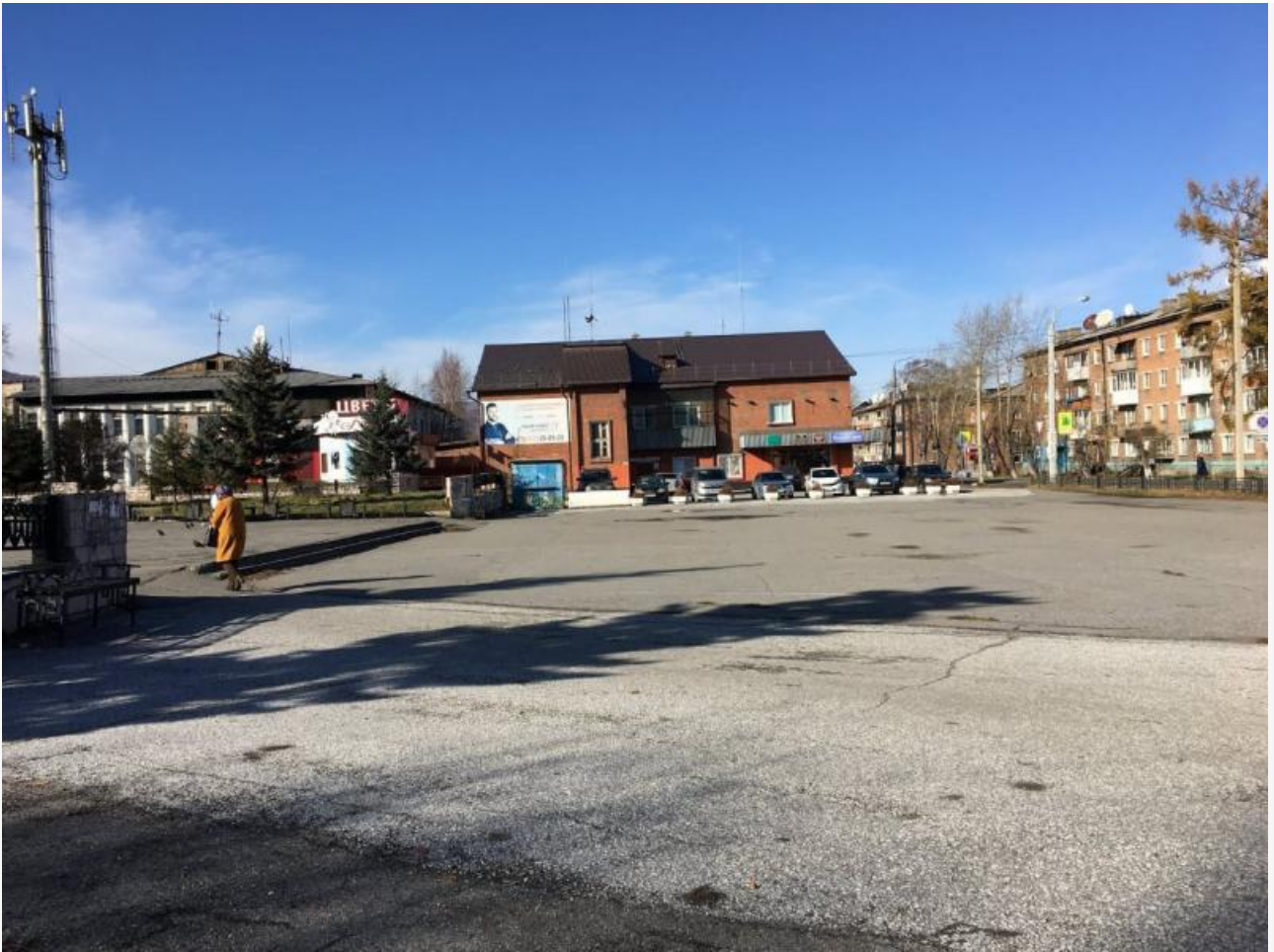
центральная площадь до реконструкции