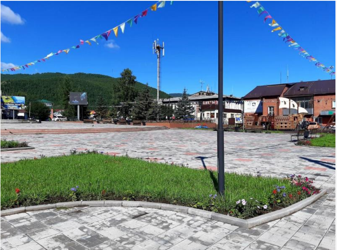
она же после ремонта