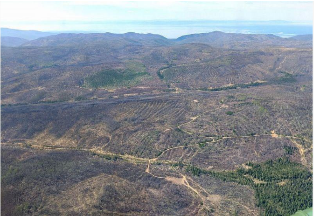
Масштаб вырубленного леса в Прибайкальском заказнике.

Незадолго до варварской расчистки охраняемых лесов РАЛХ неоднократно обращался в Министерство природы Бурятии, чтобы провести санитарные вырубki выгоревшего в 2015 году леса. В результате, не дождавшись поддержки со стороны местных властей, должностные лица РАЛХ незаконно заключили договор купли-продажи с предпринимателями на заготовку особо ценных защитных водоохранных лесов.