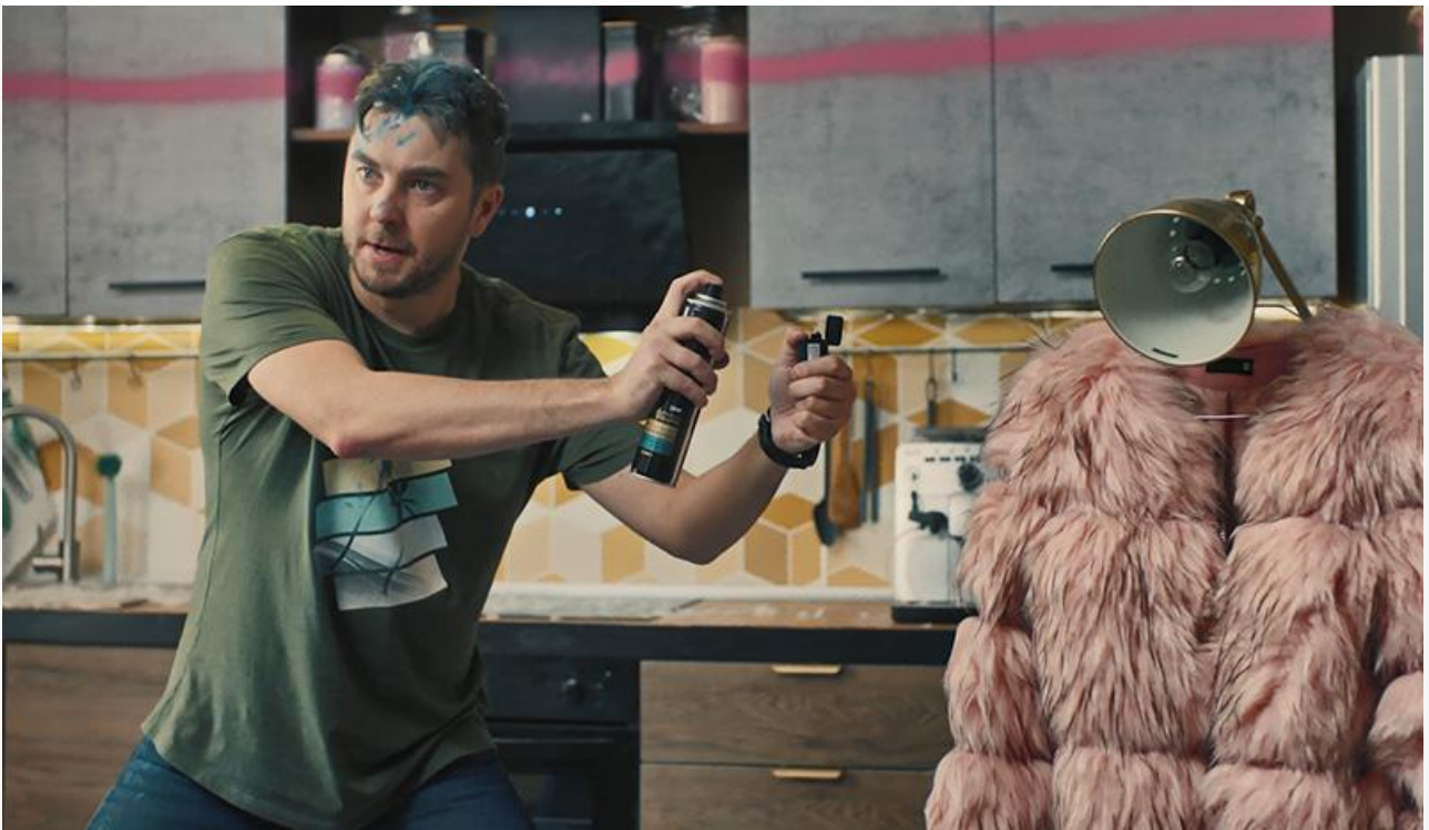
Кадр из фильма «Развод»

Как в пандемию, только хуже. Российский кинопрокат еле дышит