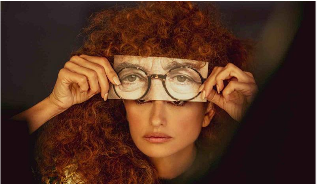
Кадр из фильма «Главная роль»