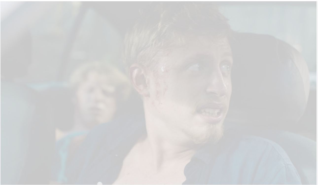
Кадр из фильма «Проклятие Артура»

Сатирическая комедия «Официальный конкурс» (Competencia oficial) под адаптированным русским названием «Главная роль» повествует о непростом воплощении в жизнь мечты миллиардера о съёмках «идеального фильма» по «лучшей книге», «лучшим режиссёром» и с «лучшими актёрами».