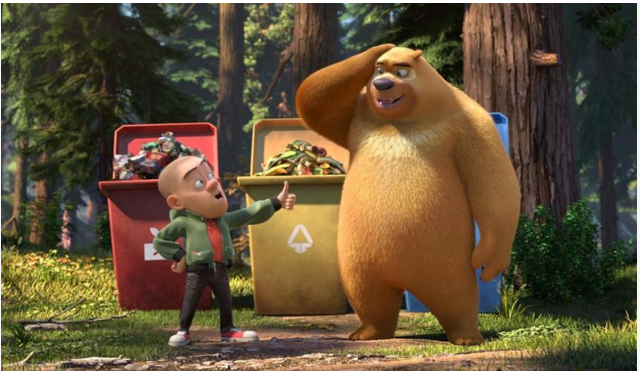
Кадр из фильма «Побег из космоса»