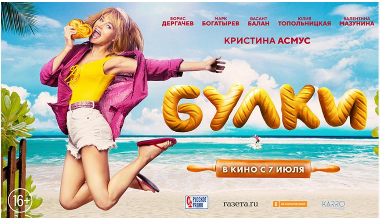
Постер к фильму «Булки»