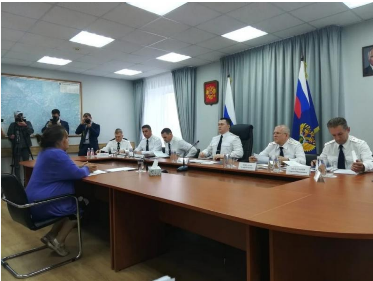
Фото со встречи инициативной группы и генпрокурора.

Автор: Андрей Игнатьев © Babr24.com КРИМИНАЛ, РАССЛЕДОВАНИЯ, ЭКОНОМИКА И БИЗНЕС, ТОМСК 👁 41455 08.07.2022, 20:47 🔄 1093