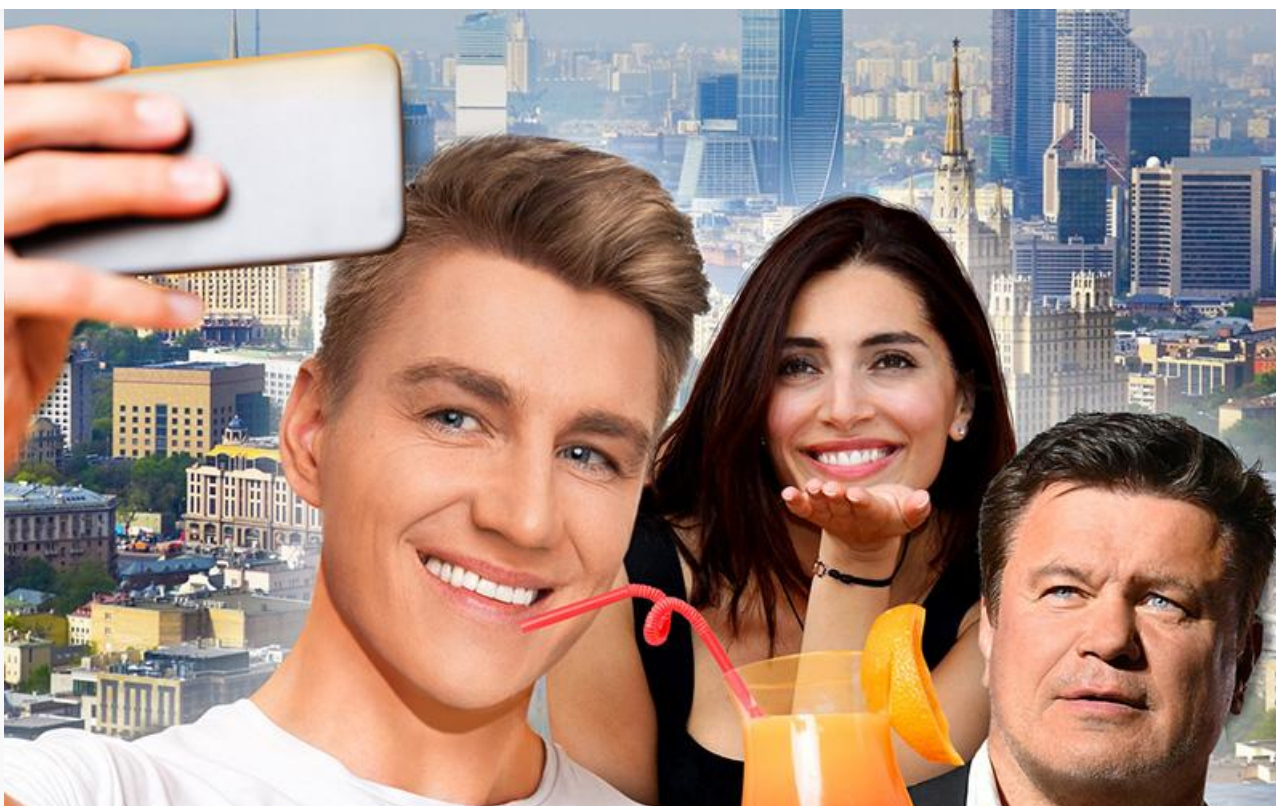
Постер к фильму «Селфимания»

Что касается военной драмы «Внук» Тимура Гарафутдинова (он же в главной роли, он же художник, он же композитор, он же сценарист), стартовавшей в прокате на день раньше других релизов уикенда, то либо качество патриотичной картины, либо буква «V» в русском названии, либо и то и другое привели к катастрофическому «сарафану». После двух дней проката рейтинг дебютного фильма Гарафутдинова на