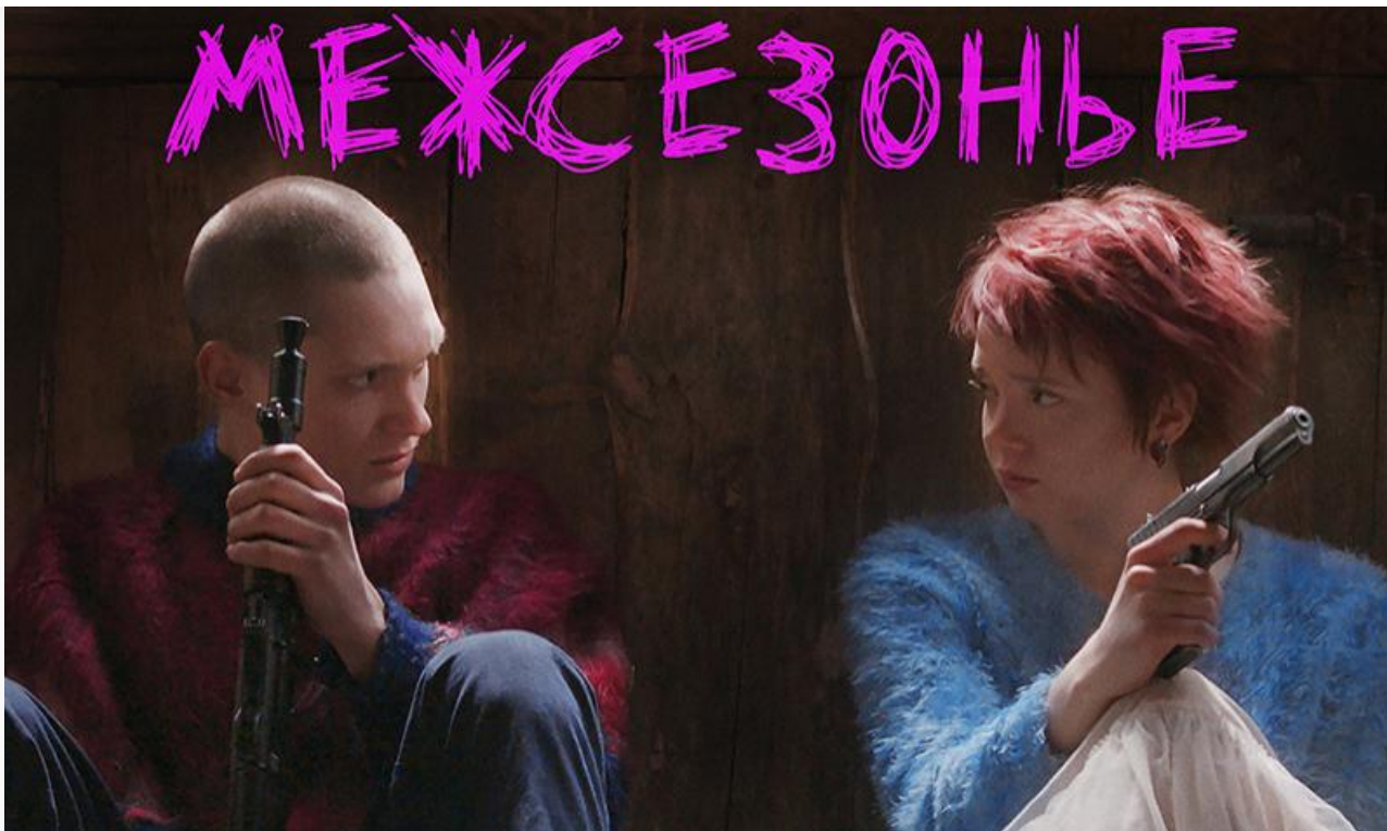
Постер к фильму «Межсезонье»