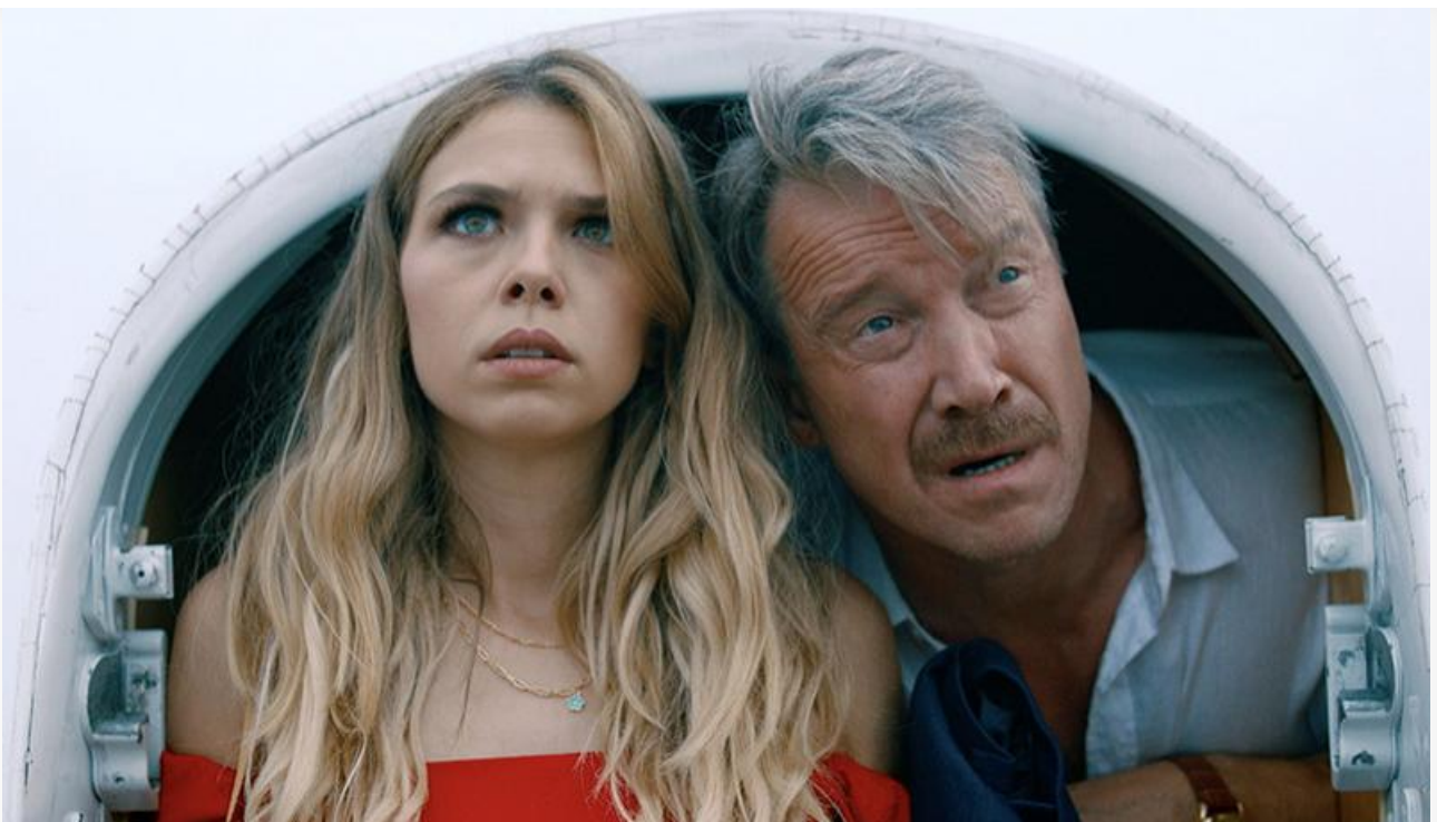
Кадр из фильма «Дикая»

Также на экран выходят чешская комедия « Мамочки », британский хоррор « Род мужской » (18+) и интернациональная семейная комедия « Селфимания » с Катериной Мурино и Алексеем Воробьёвым.