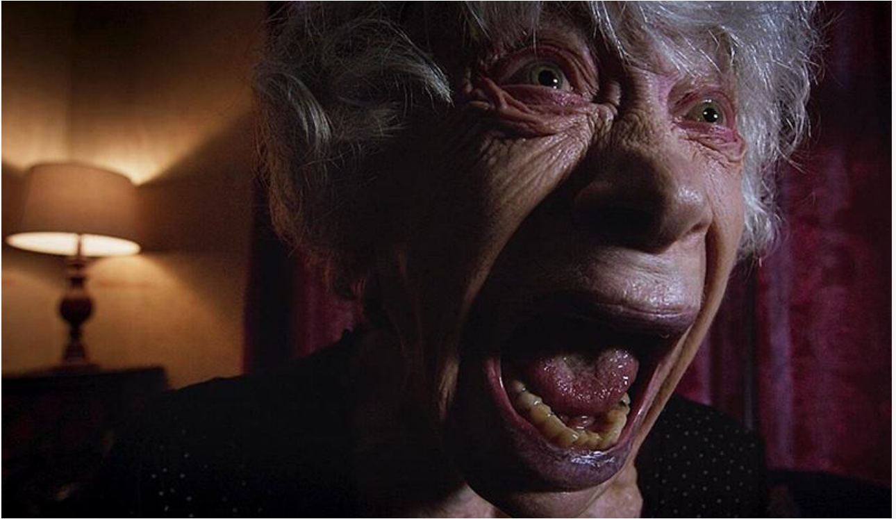
Кадр из фильма «Экстрасенс. Дело Софи»

Сохранили места в топ-10 «Артек. Большое путешествие» (7,4 миллиона и седьмое место), «Эскортницы» (6,9 миллиона и восьмое место) и «Мой папа – вождь» , с доходом 4 миллиона замкнувший десятку лидеров.