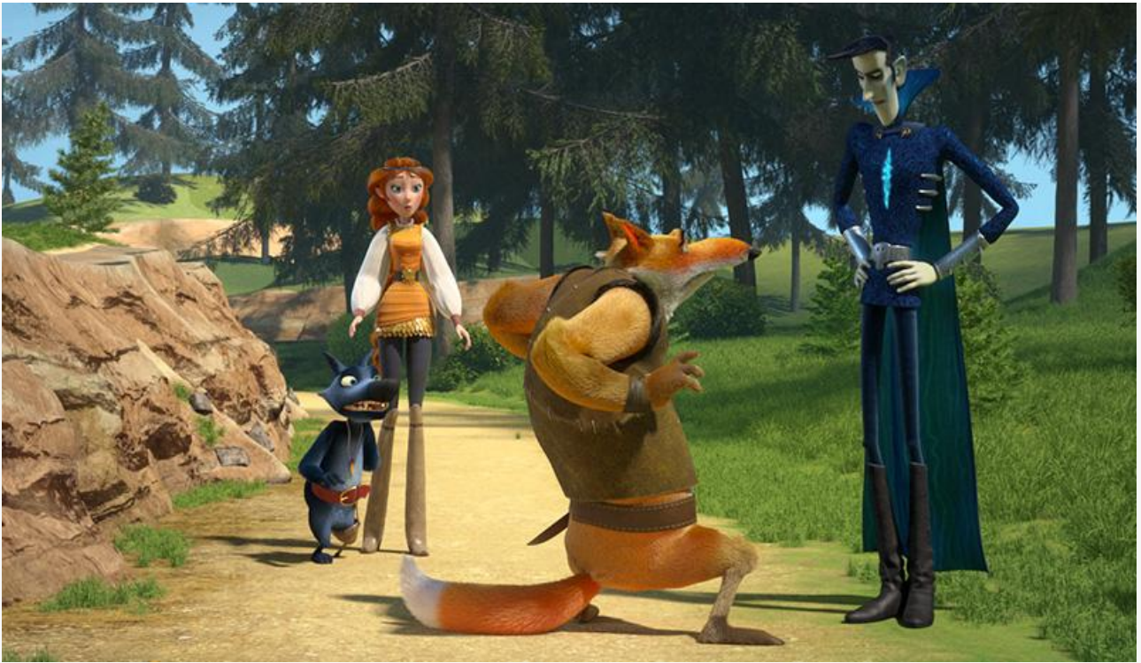
Кадр из фильма «Кощей. Похититель невест»

«Сарафан» фильма Брайана Гудмана « Пропавшая » оказался гораздо хуже, чем у лидеров. Потеряв в сборах сразу 41 %, американский боевик с прибылью 14 миллионов рублей опустился на пятую строчку чарта, пропустив вперёд российский мультфильм « Три кота и море приключений », на счету которого 14,9 миллиона (минус 19 % по сравнению с прошлыми выходными).