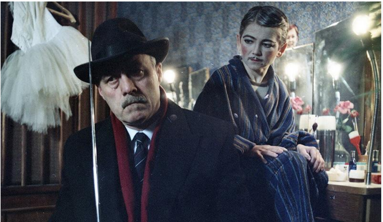
Кадр из фильма «Асса»

В целом отечественный кинопрокат продолжил плавный рост. Общая касса топ-20 фильмов уикенда составила 243,2 миллиона рублей. Это на 9 % больше по сравнению с предыдущими выходными.