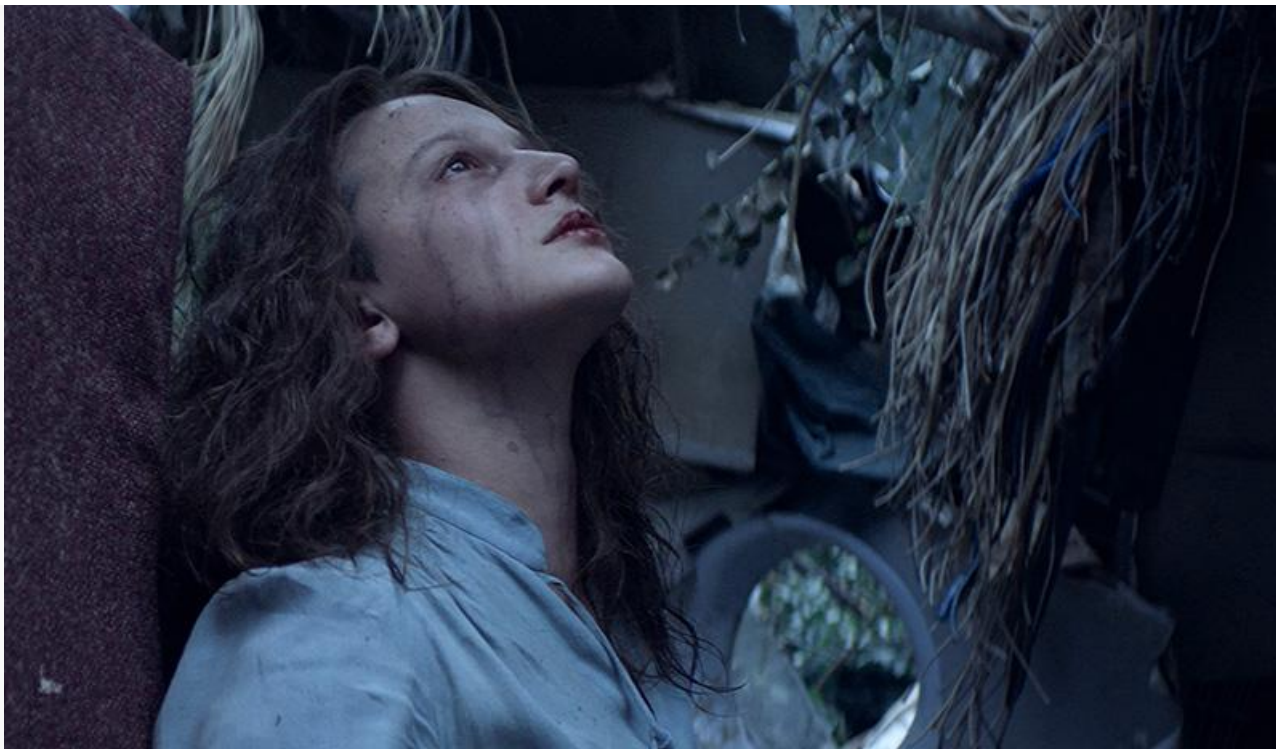
Кадр из фильма «Одна»

На второй строчке остался мультфильм Романа Артемьева от студии «КиноАтис» « Кощей. Похититель невест » (минус 3 % и 33,1 миллиона), на третьей – комедия Александра Фомина « Молодой человек » (минус 15 % и 27,4 миллиона).