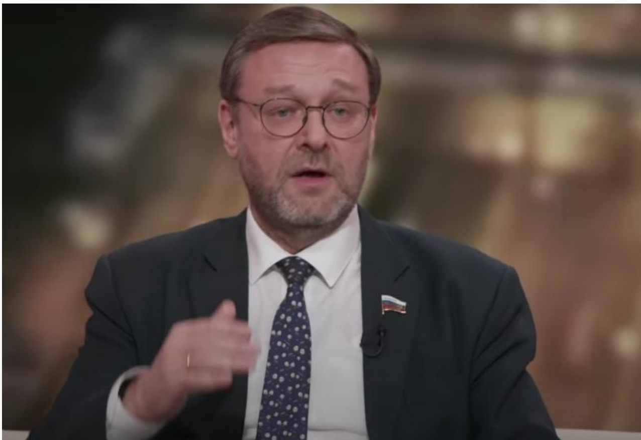
Скриншот: фрагмент интервью на Life

Примечателен и тот факт, что глава войск радиационной, химической и биологической защиты РФ генерал-майор Игорь Кириллов, рассказывающий на брифингах МО РФ о биолaborаториях в соседних с Россией странах, ни разу не упомянул Монголию.