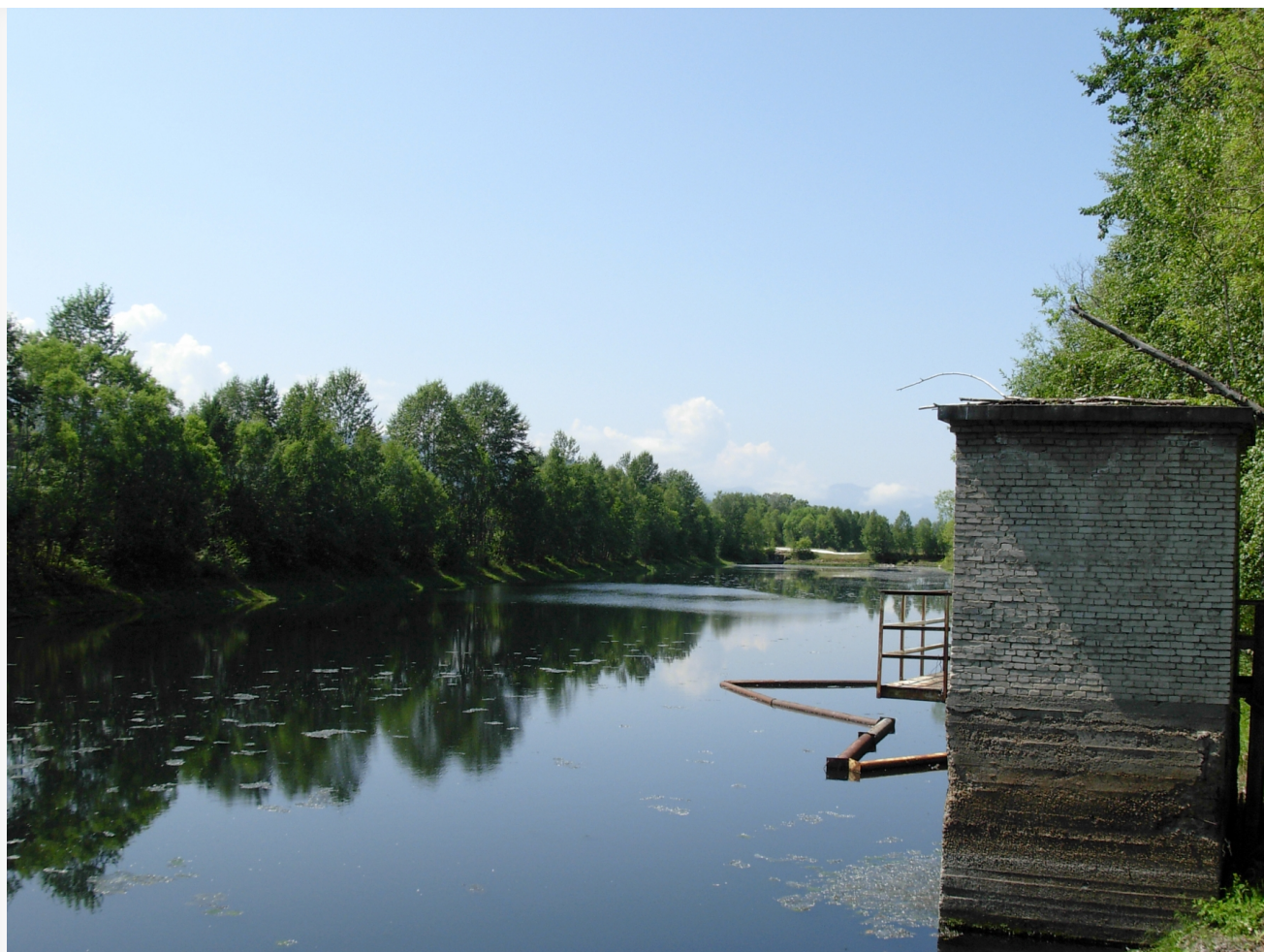
Автор: Алёна Штерн Фото из альбома "Иркутская область. Байкальск. БЦБК" © Фотобанк "RuVabr"

В текущем 2022 году совершенно точно не начнутся работы на полигоне «Солзанский» Байкальского ЦБК. Многострадальный объект даже не подошел к стадии актуального проектирования. Актуального – потому что было уже несколько разных проектных решений – от ВЭБ-Инжиниринга, корпорации «Газэнергострой» и Федерального экологического оператора. Последний уже готовый проект по компостированию отходов решили отклонить в связи с наличием импортных составляющих. Теперь отходы Солзанского полигона должны подвергнуть литификации.