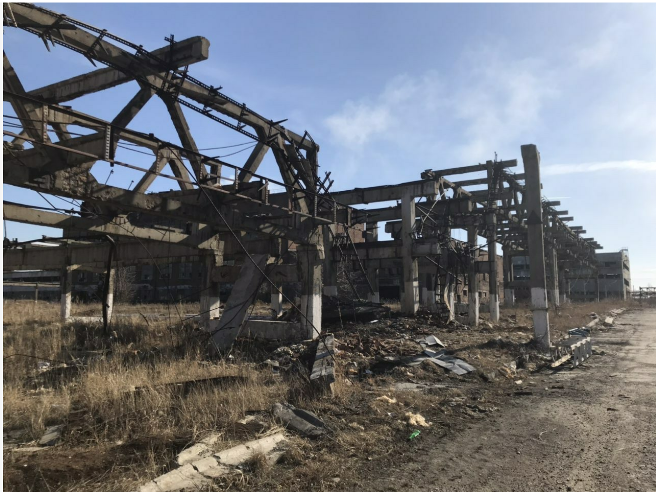
Фото из альбома "Иркутская область. Усольский Химпром" © Фотобанк "RuBabr"

Еще одна боль сибирского фронта работ ФГУП «ФЭО» – утилизация ранее перезатаренных из аварийных емкостей опасных отходов, а также жидких отходов ликвидации скважин рассолопромысла промплощадки «Усольехимпром».