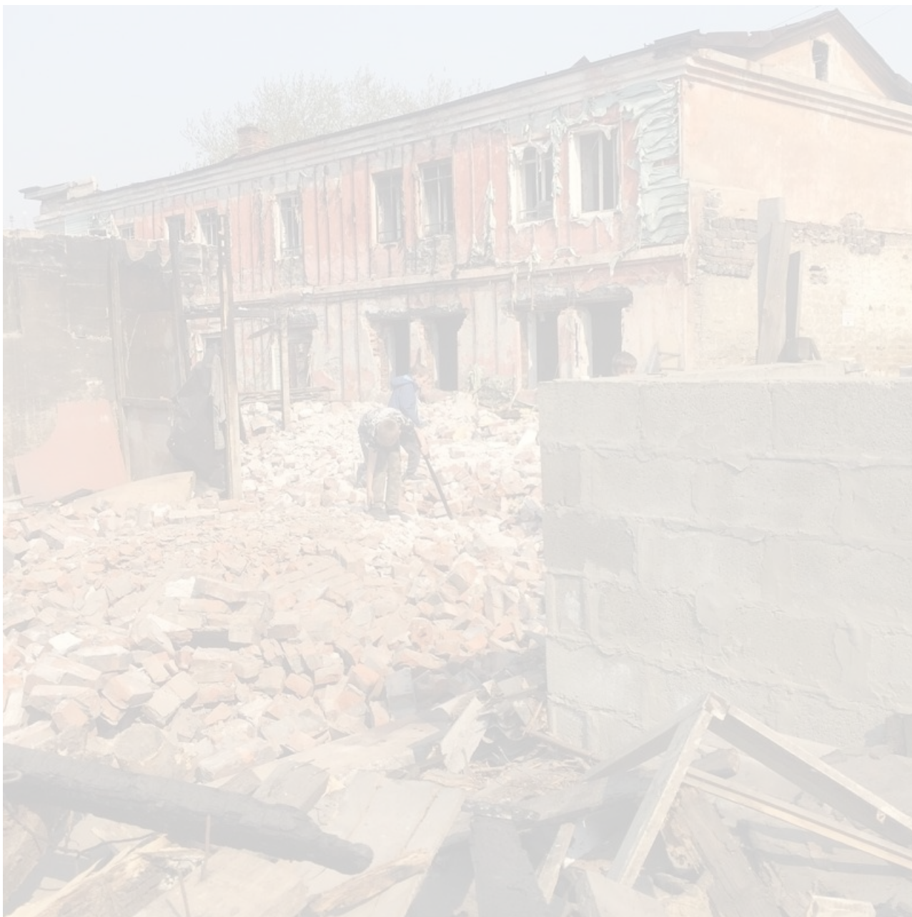
Теперь хвостатые ищут новый дом

«Мы пытались самостоятельно решить проблему с помещением, но найти равноценное и с наименьшими затратами не получается. В связи с видом нашей деятельности, к нам есть определённые требования. Здание должно быть отдельно стоящим, нежилым. Важный момент — здание, всё же, должно быть в центре города, для удобства наших гостей. Мы прекрасно понимаем, что на окраину Иркутска мало кто поедет», - комментирует владелец кафе Валентина Дубовцева.