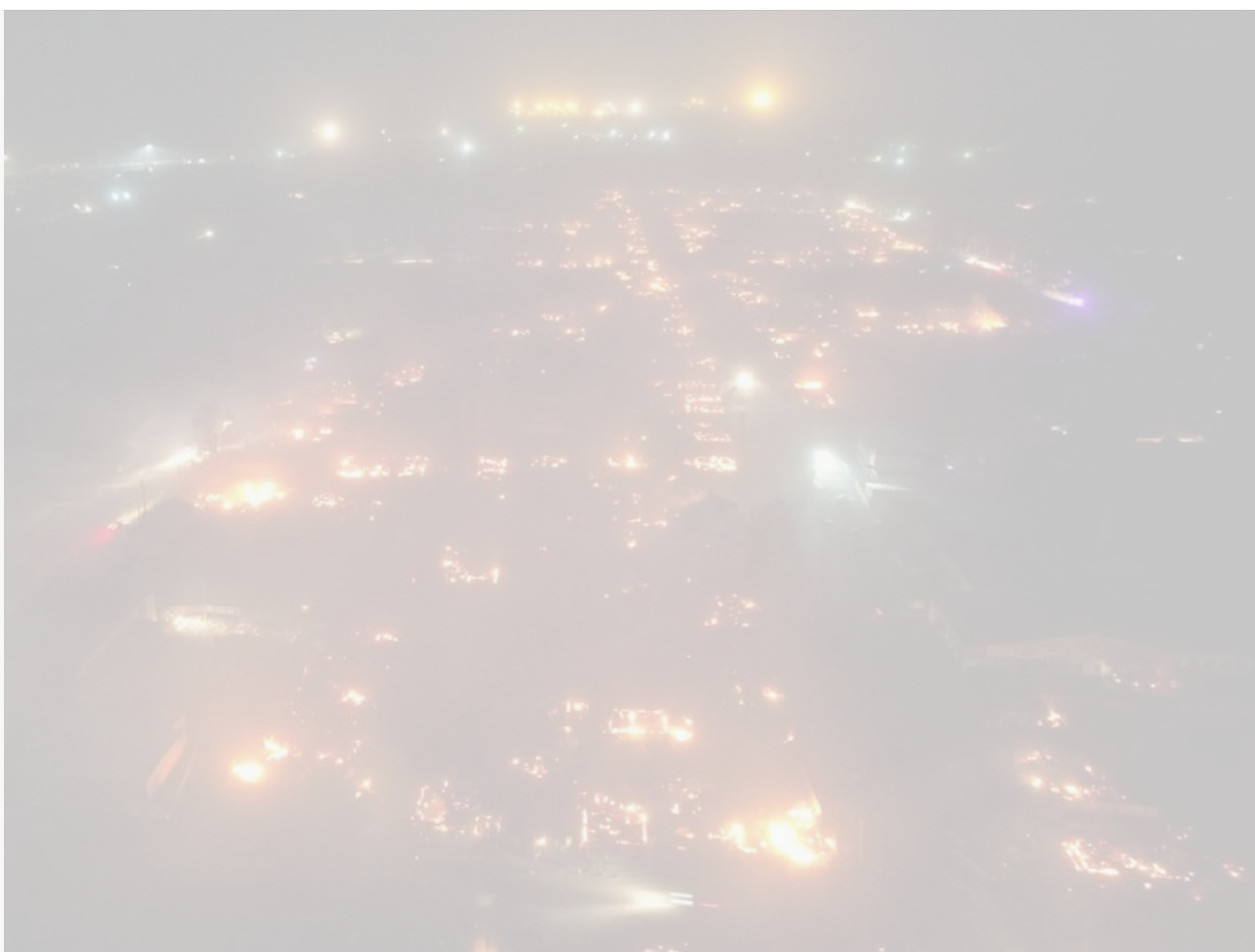
Мусорные страсти: ртутные свалки, нехватка полигонов и передел

Каждая такая свалка (помимо того, что загрязняет окружающую среду) в пожароопасный период становится потенциальной зоной возгорания. Пример Уяра, где в течение дня выгорели более двух сотен домов, говорит сам за себя.