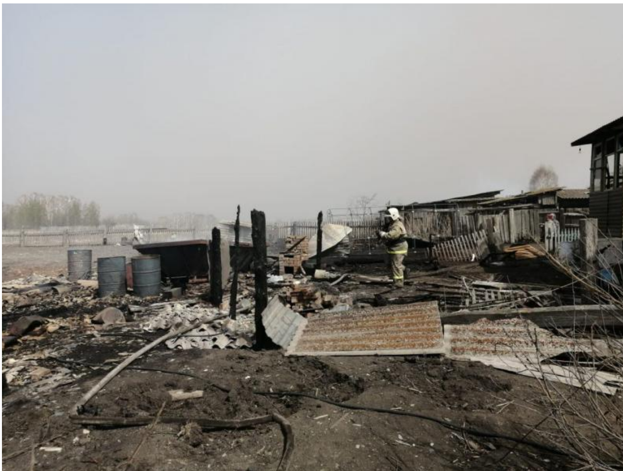
Фото: Управление МЧС по Красноярскому краю

Автор: Макс Веселов © Babr24.com Источник: https://t.me/NeNASHI ПРОИСШЕСТВИЯ, КРАСНОЯРСК 👁 4845 10.05.2022, 17:40 🔄 505