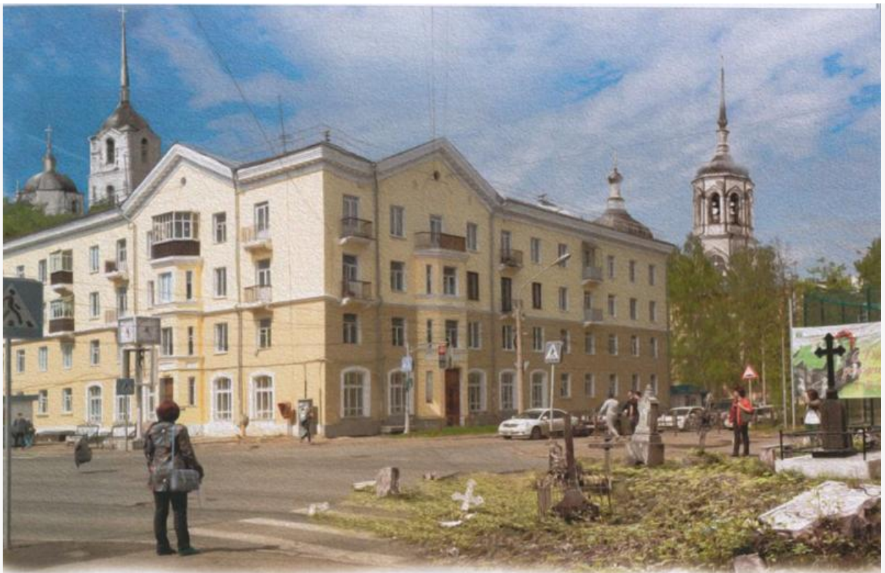
г. Томск. Успенский и Иннокентьевский храмы женского монастыря

Так бы выглядел современный Томск, если бы монастырь не был разрушен. Перекресток улиц Вершинина и Учебная