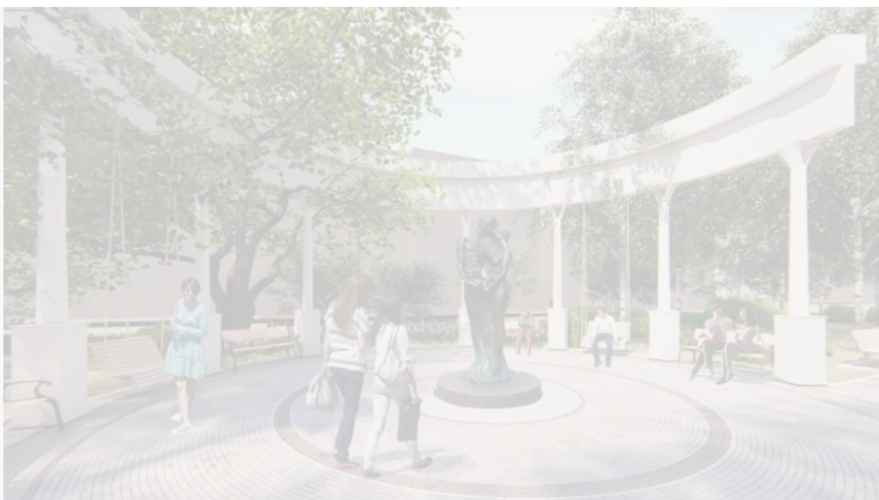
Проект благоустройства сквера «Семейные узы»

«Сквер станет местом для тихого отдыха с удобными транзитами. Проект предусматривает освещение, установку садовых качелей, озеленение, будет положена маленькая плитка трех цветов – как в Театральном сквере [возле Театра юного зрителя]. Обращаем внимание, что в прошлом году из проекта пришлось убрать скейт-парк, на месте которого будет продолжение зоны отдыха и озеленение сквера», - следует из сообщения Центра развития городской среды.