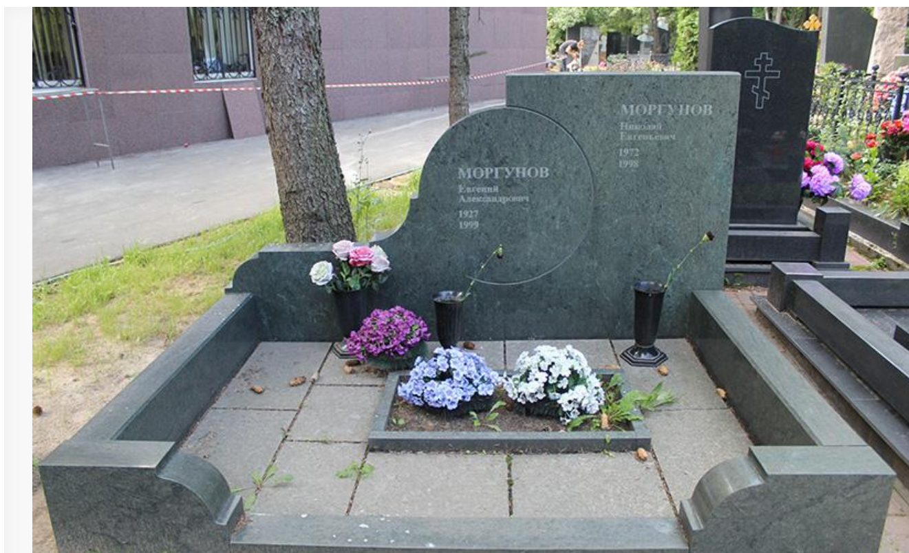
Могила Евгения и Николая Моргуновых