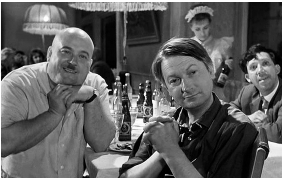
Бывалый в фильме