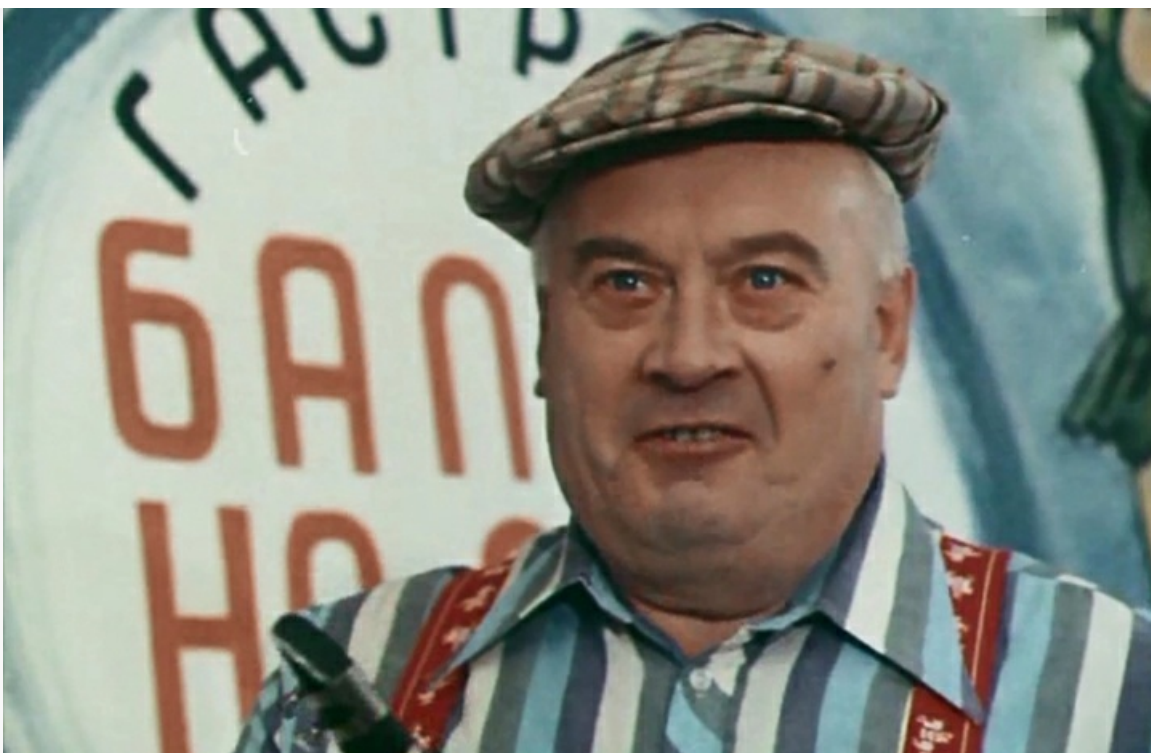
Болельщик-музыкант в фильме «Летние гастроли», 1979 год