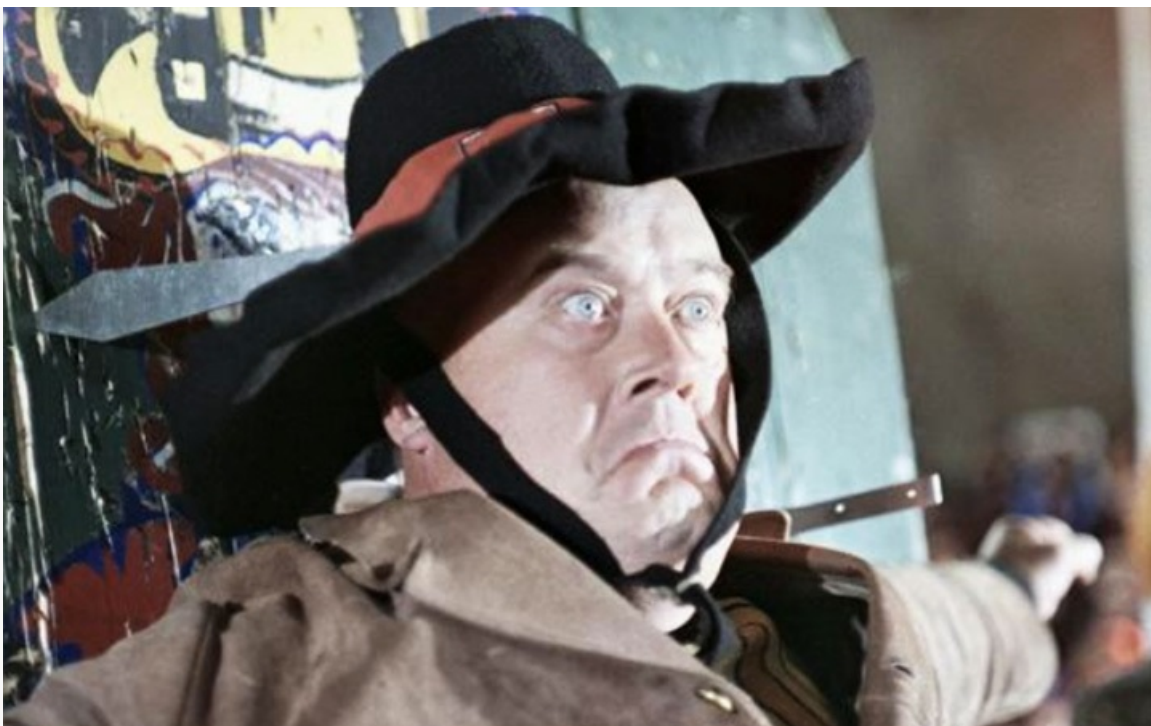
аттракцион», 1974 год