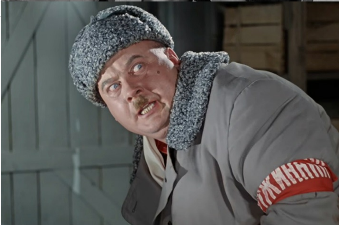
«Операция «Ы» и другие приключения Шурика», 1965 год