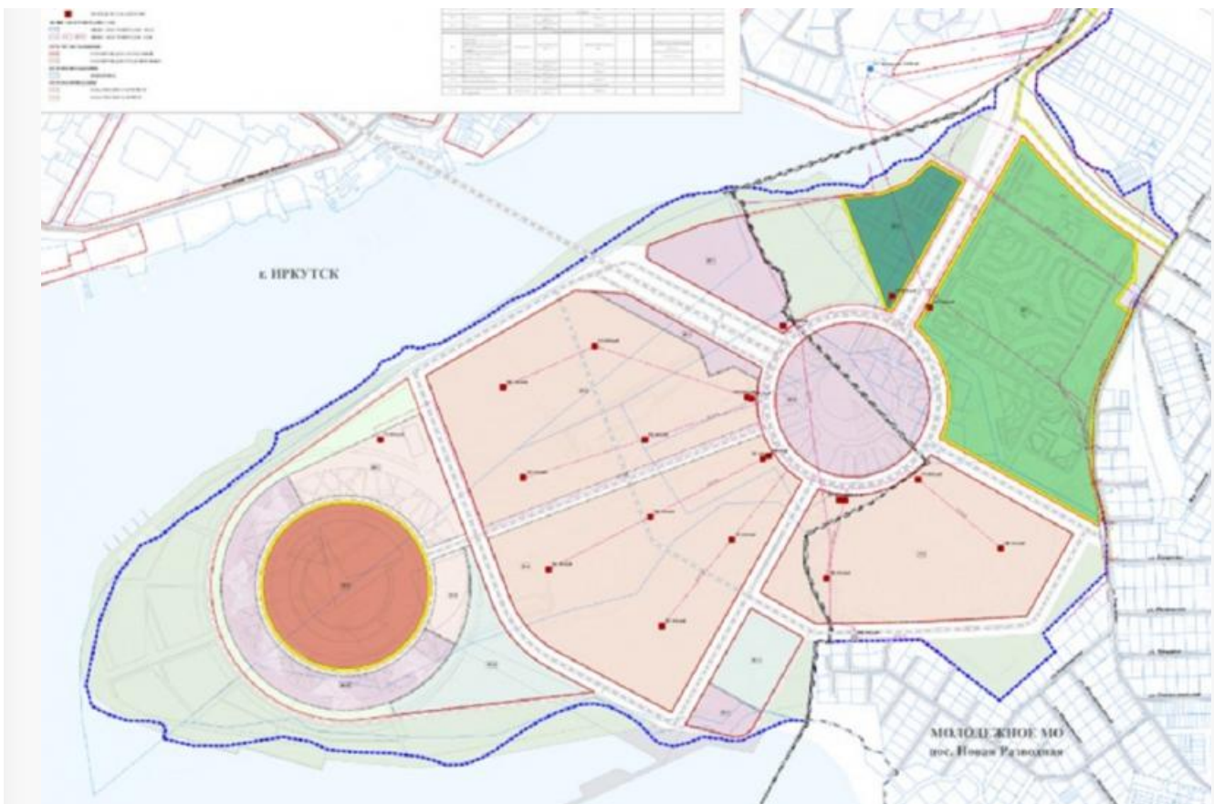
Проект планировки нового жилого района на Чертугеевском полуострове

Автор: Миша Ковальски © Babr24.com ЭКОЛОГИЯ, ИРКУТСК 👁 26168 22.04.2022, 13:38 📌 724 URL: https://babr24.com/?IDE=227864 Bytes: 3946 / 3317 Версия для печати Скачать PDF