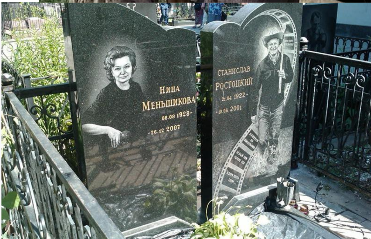
Могила Станислава Ростоцкого и его супруги, народной артистки РСФСР Нины Меньшиковой