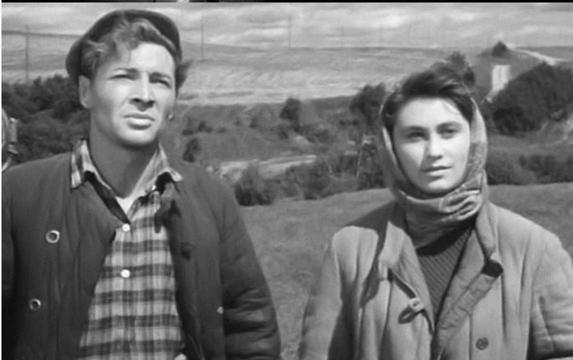
Пенькове», 1958 год