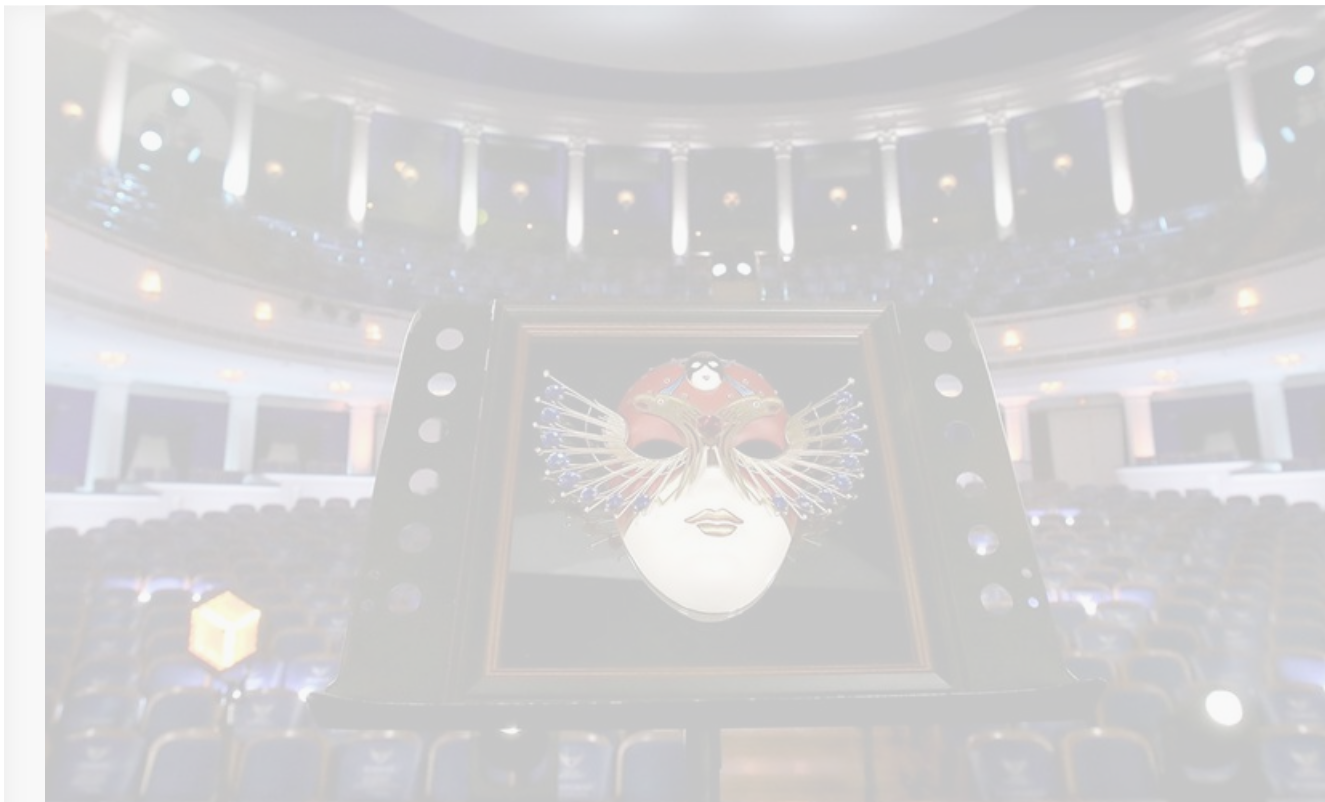
Фото онлайн-церемонии «Золотой маски» 2020 года

Прямая трансляция церемонии «Золотой Маски» пройдет 20 апреля на платформе онлайн-кинотеатра Okko и на страницах фестиваля «Золотая Маска» в социальных сетях. Время начала церемонии станет известно позднее.