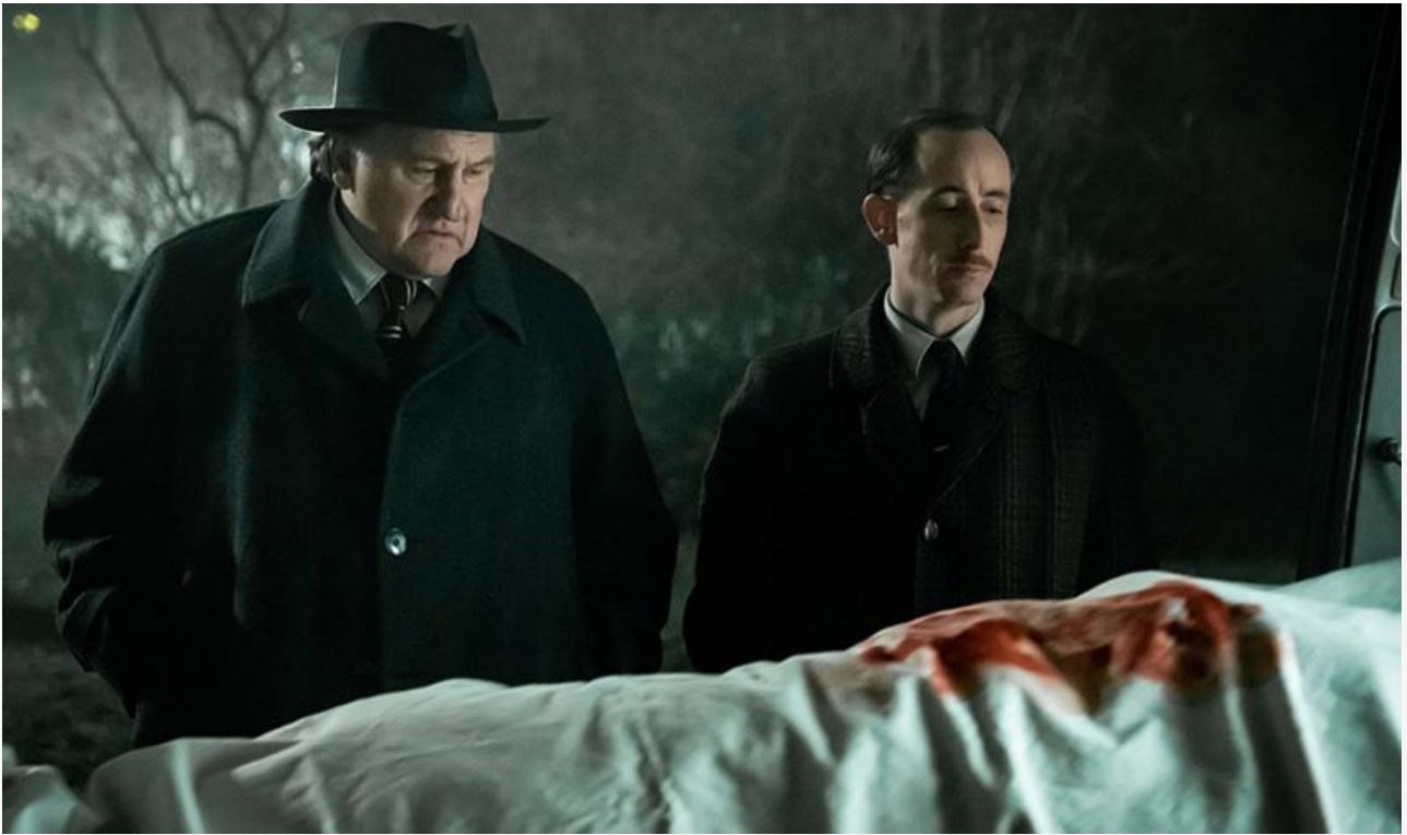
Кадр из фильма «Мегрэ и таинственная девушка»

Сохранили места в топовой десятке проката «Смерть на Ниле» (17,3 миллиона и шестое место), перевыпущенный «Брат» Алексея Балабанова (15,5 миллиона и седьмое место), «Лулу и Бриггс» (9,9 миллиона и восьмое место) и отечественная романтическая комедия «Хочу замуж» (9,2 миллиона и девятое место).