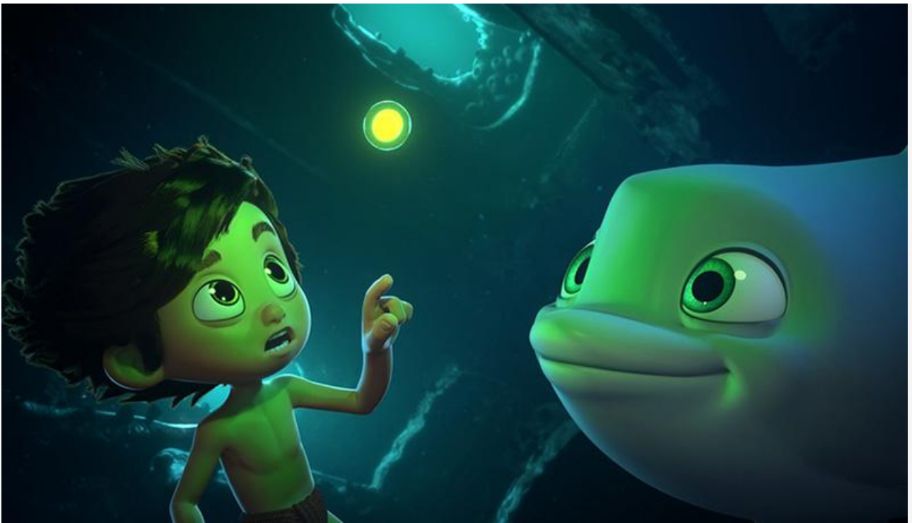
Кадр из фильма «Мальчик-дельфин»