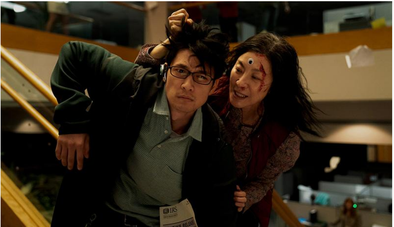
Кадр из фильма «Всё везде и сразу»