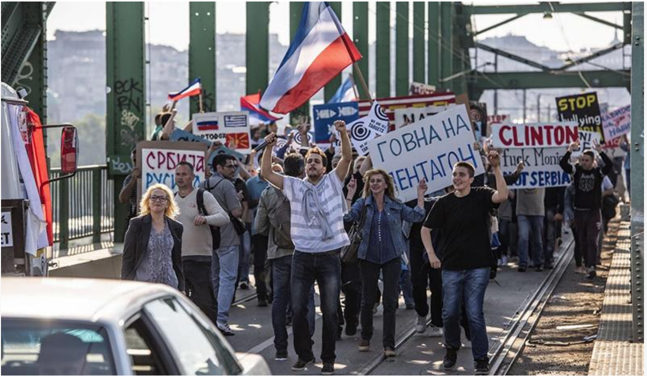
Кадр из фильма «Балканский рубеж»