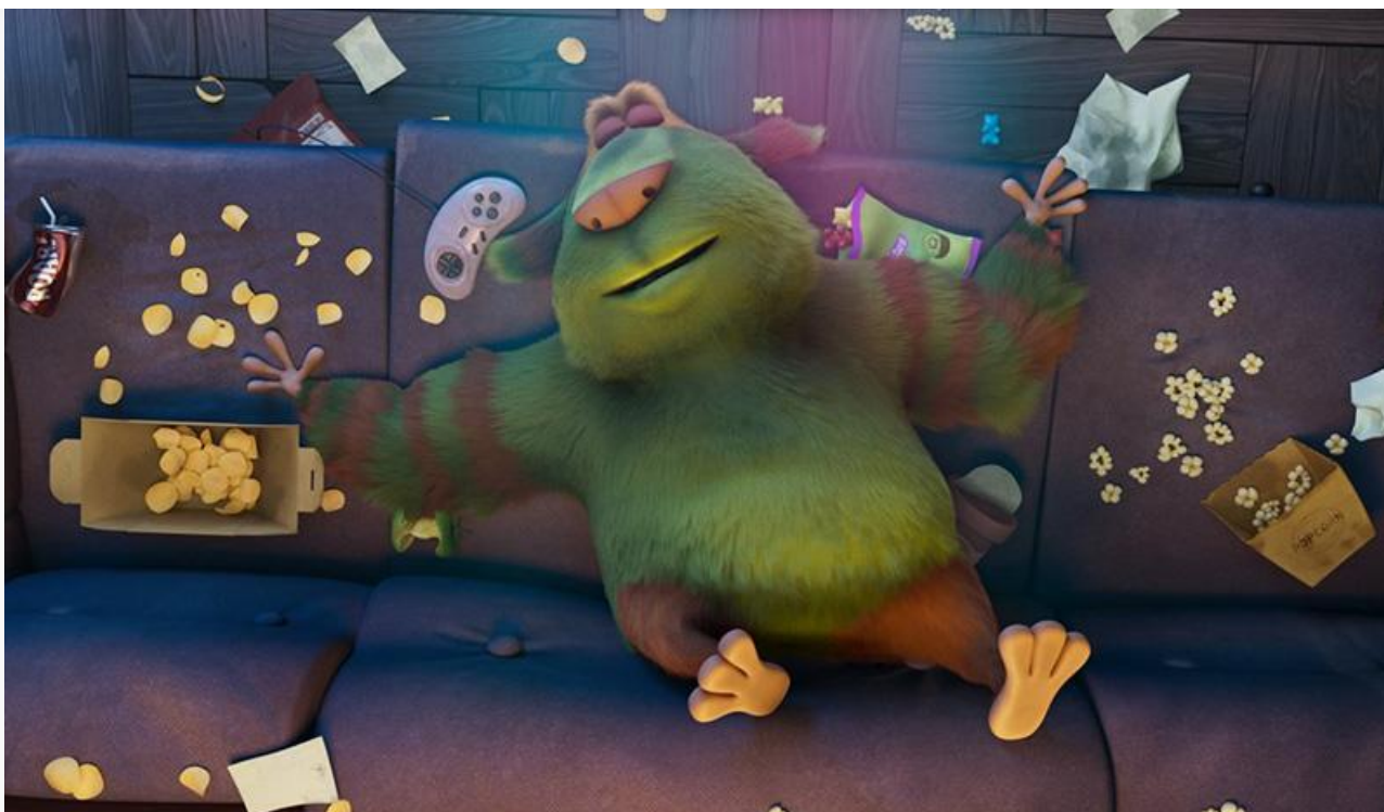
Кадр из фильма «Финник»

Третье и четвертое места с практически одинаковой суммой 20,8 и 19,4 миллиона соответственно заняли отечественные ленты «Моя ужасная сестра» и «Мистер Нокаут». Разница лишь в том, что в распоряжении «Нокаута», идущего в прокате второй месяц, было всего 594 экрана, а свеженькая «Сестра» демонстрировалась на 1 827.