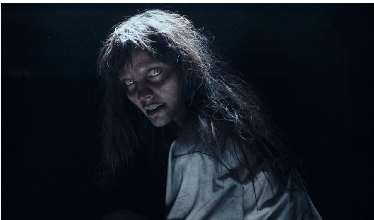
Кадр из фильма «Последнее пришествие дьявола»

Ну и совсем не заинтересовала кинопрокатчиков японская драма «Сядь за руль моей машины» . Фильму Рюсукэ Хамагути, на шумевшему на Каннском кинофестивале и получившему премии «Оскар» , BAFTA и «Золотой глобус» в категории «Лучший фильм на иностранном языке», выделили в России всего 187 экранов. Как результат – 5,5 миллиона (более чем неплохо для такого количества экранов) и 14 место по итогам уикенда.