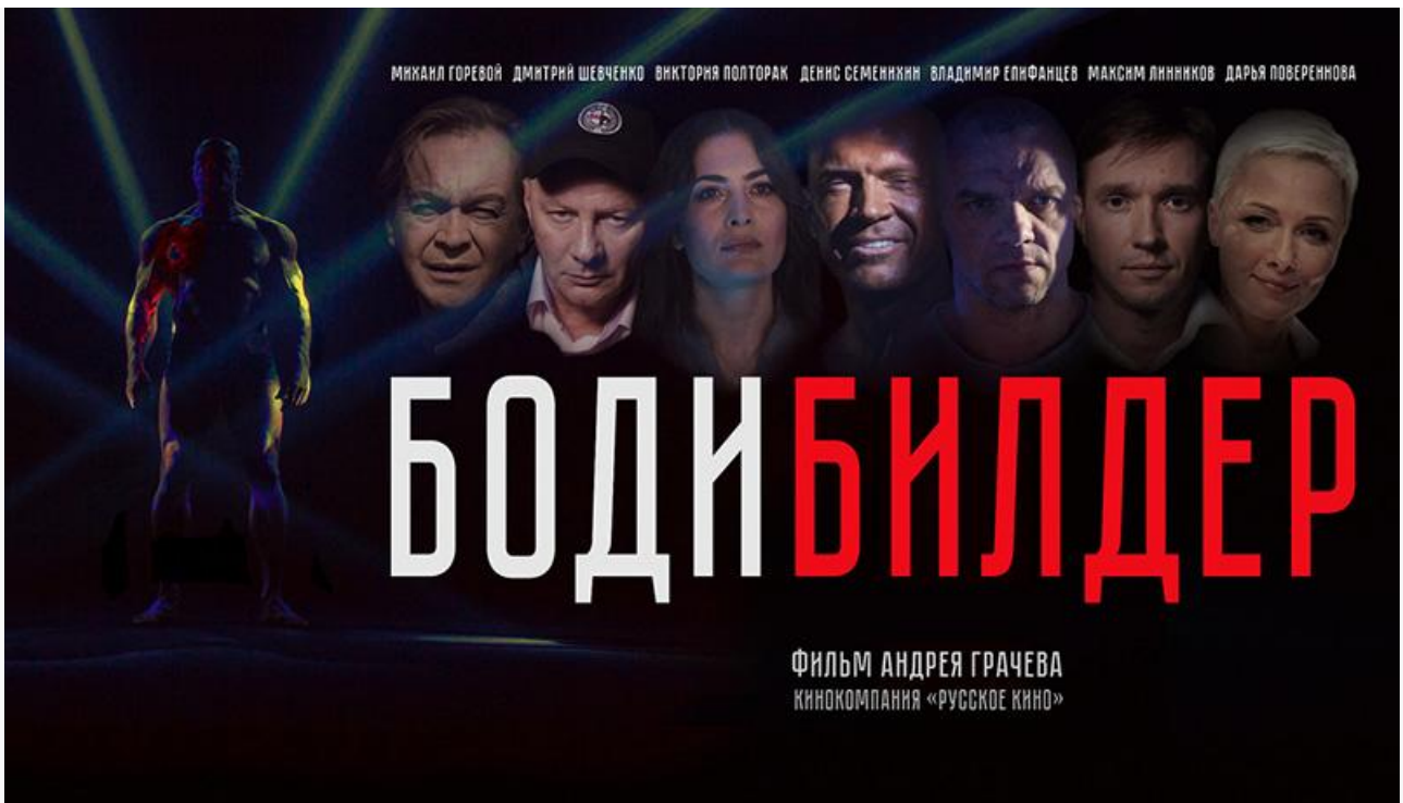
Постер к фильму «Бодибилдер»