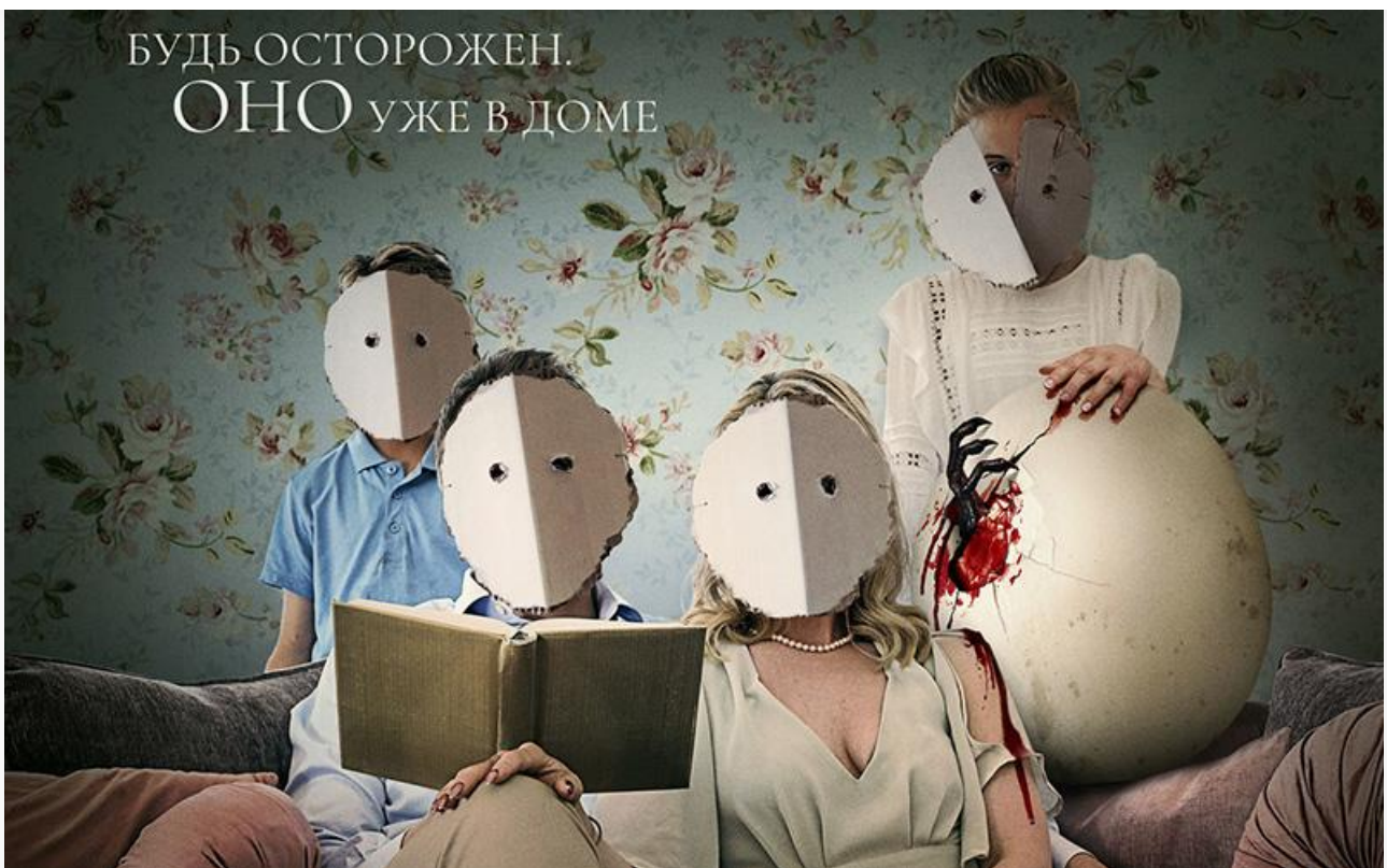
Постер к фильму «Скрежет»