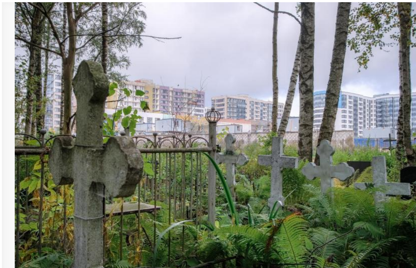
Фото сделано не в Томске.

Размер уставного капитала 77 573 149,00 рублей.