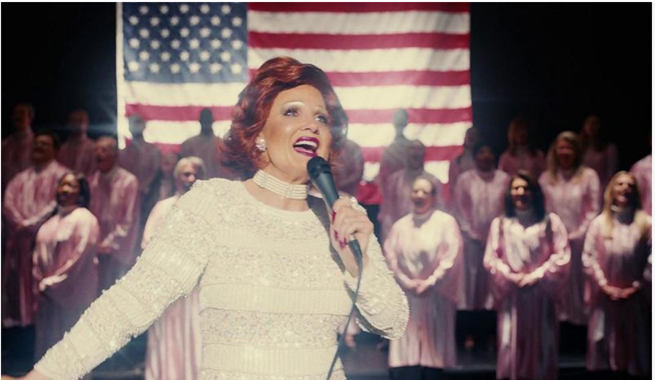
Джессика Честейн в фильме «Глаза Тэмми Фей»

Награда за лучший оригинальный сценарий досталась Кеннету Бране за сценарий к его же исторической драме «Белфаст». Лучшей песней признана композиция No Time to Die Билли Айлиша и Финнеаса О'Коннелла, ставшая главной темой в 25-м фильме бондианы «Не время умирать».