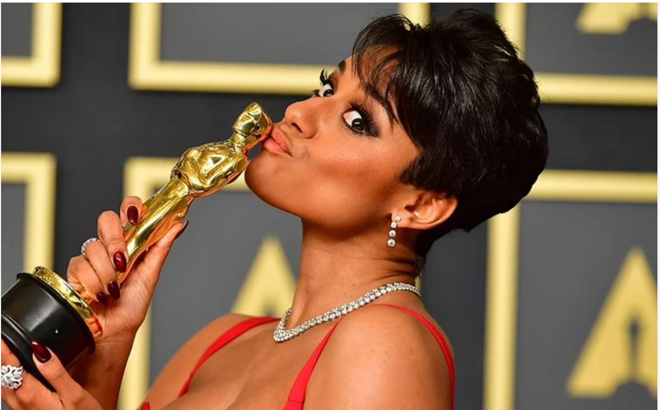
Ариана ДеБос с «Оскаром» за лучшую женскую роль второго плана

Поздним вечером 27 марта в помещении театра «Долби» в Лос-Анджелесе прошла 94-я церемония вручения наград премии Американской академии кинематографических искусств и наук «Оскар». Трансляцию церемонии вела компания ABC, а её основными ведущими выступили актрисы Реджина Холл, Эми Шумер и Ванда Сайкс.