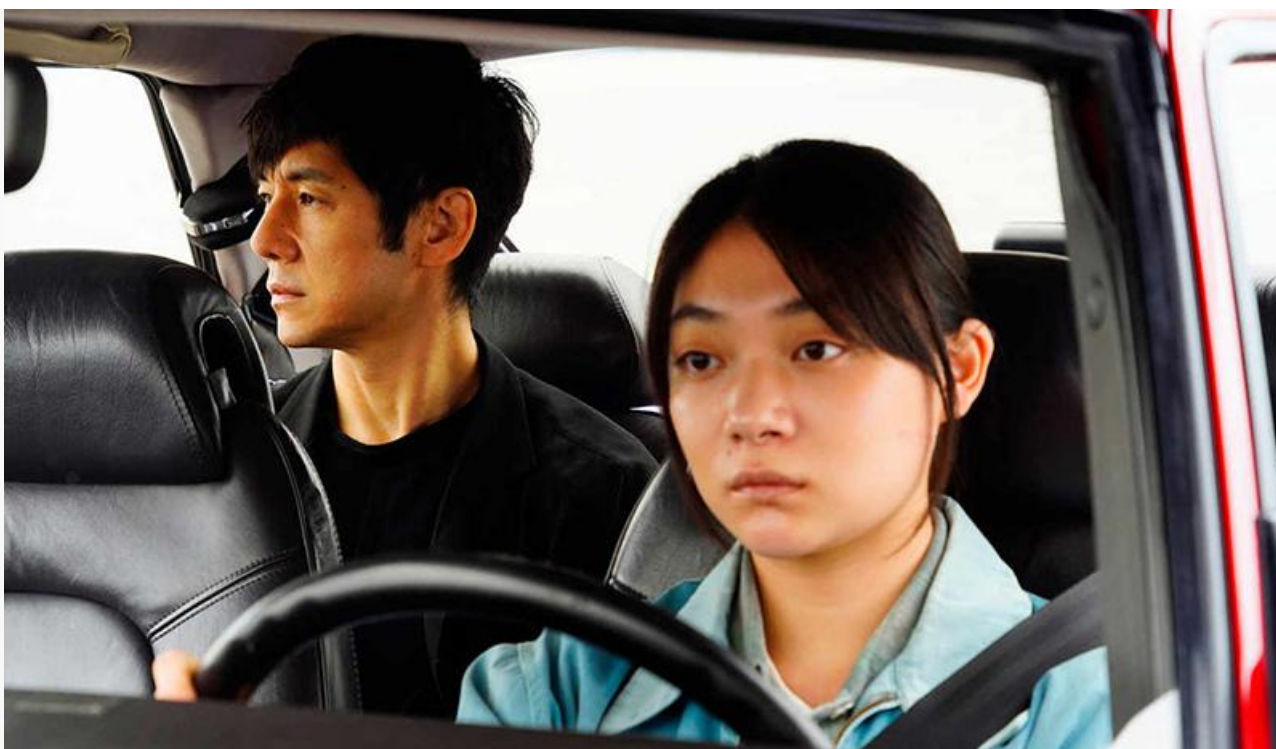
Кадр из фильма «Сядь за руль моей машины»