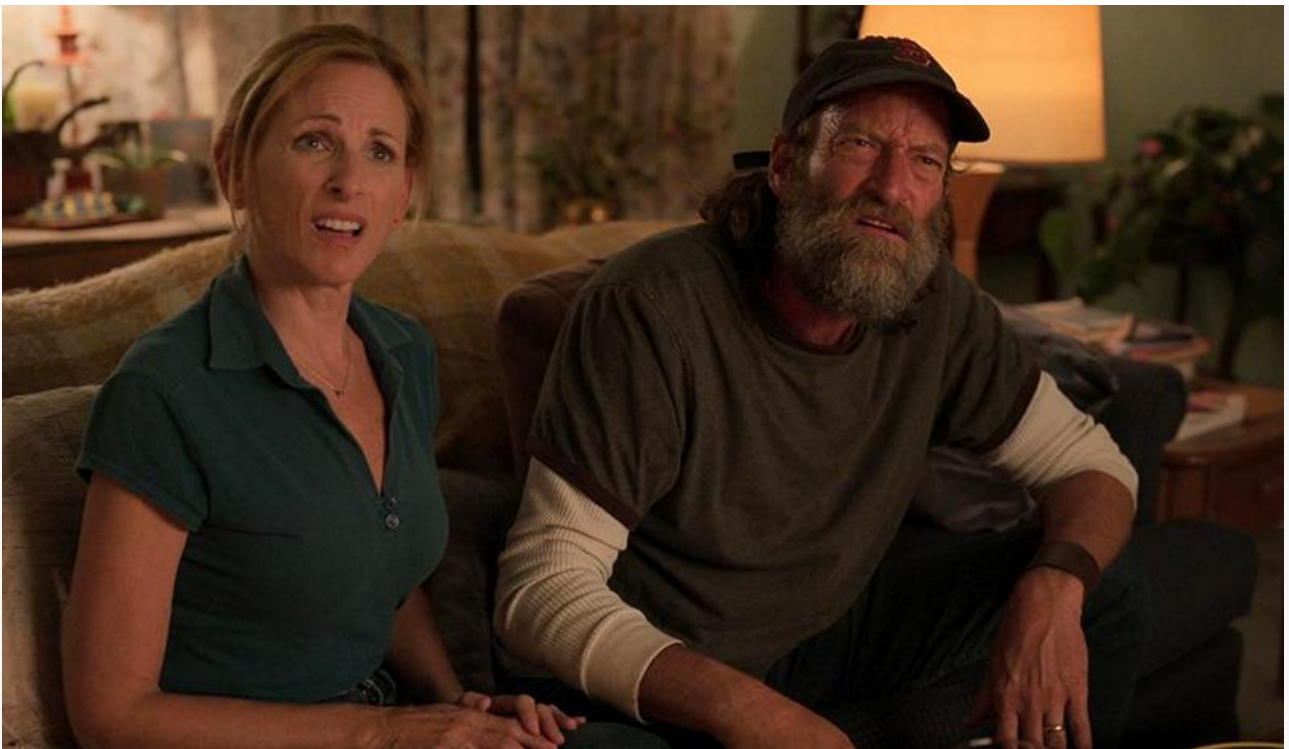
Трой Коцур в фильме «CODA: Ребёнок глухих родителей»