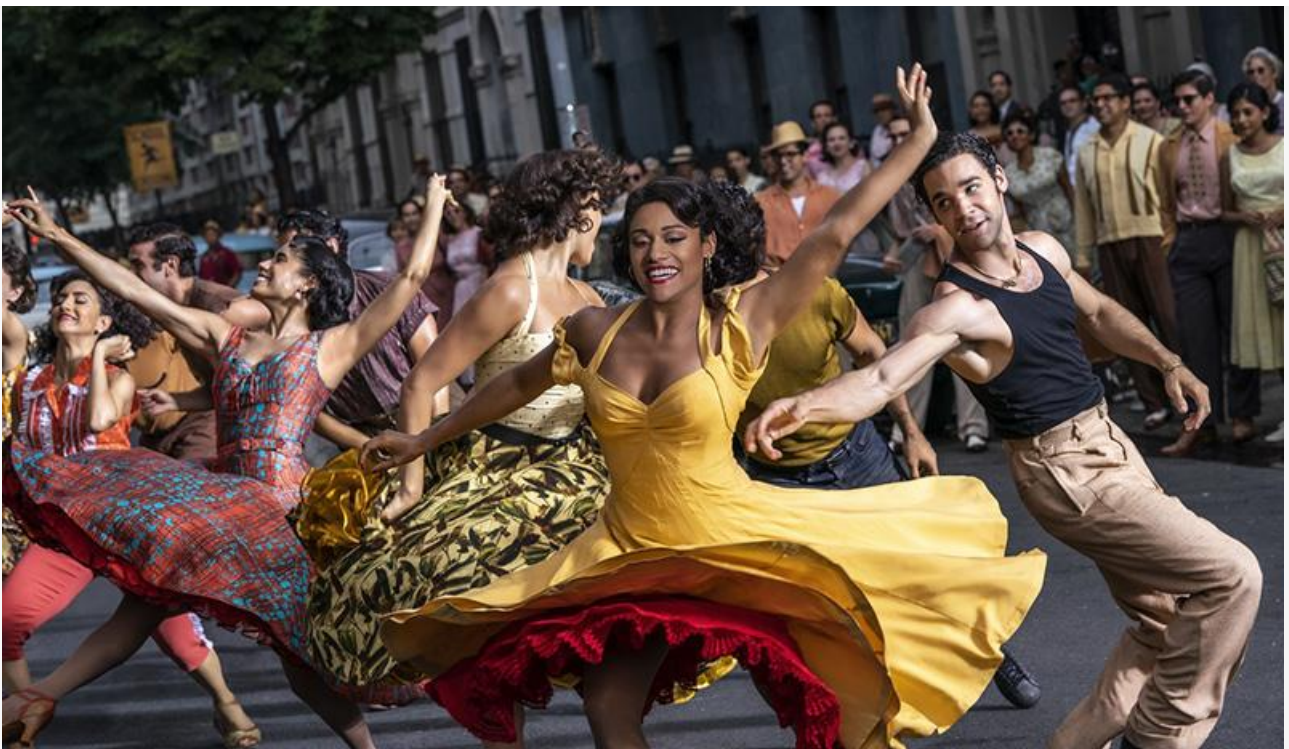
Ариана ДеБос в фильме «Вестсайдская история»

Лучшими актёром и актрисой прошедшего киногода стали исполнитель роли отца теннисисток Винус и Серены Уильямс Ричарда Уильямса в спортивной драме «Король Ричард» Уилл Смит , для которого эта победа также стала третьей вслед за «Золотым глобусом» и BAFTA, и Джессика Честейн , сыгравшая телепроповедницу-евангелистку Тэмми Фей Беккер в биографической картине Майкла Шоултера «Глаза Тэмми Фей».