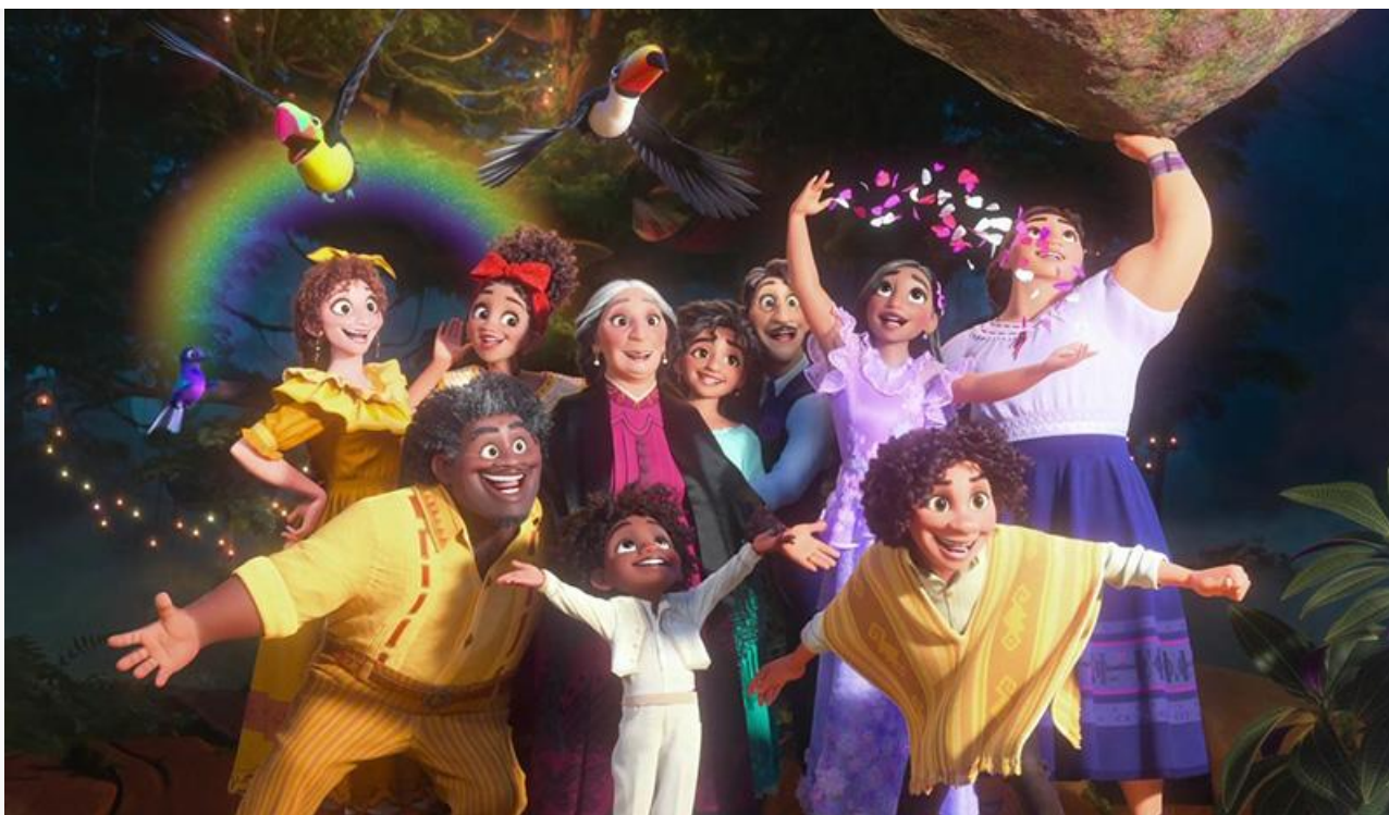
Кадр из фильма «Энканто»

рассказу Харуки Мураками «Сядь за руль моей машины».