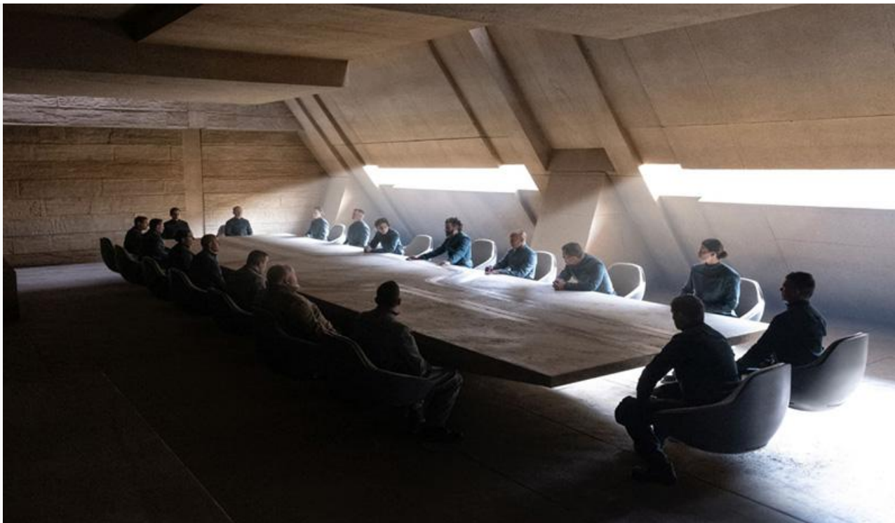
Кадр из фильма «Дюна»

На втором месте по числу призов, в том числе и в категории «Лучший фильм», музыкальная драма Шан Хейдер «CODA: Ребёнок глухих родителей» . Сама Хейдер получила статуэтку за лучший адаптированный сценарий, а исполнитель роли отца главной героини Трой Коцур забрал приз в категории «Лучшая мужская роль второго плана», став первым в истории «Оскара» слабослышащим лауреатом в этой номинации.