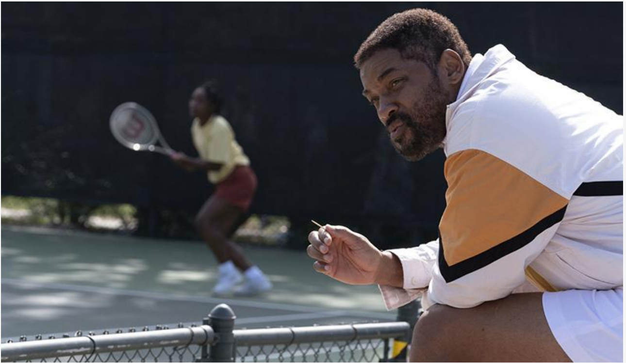
Уилл Смит в фильме «Король Ричард»