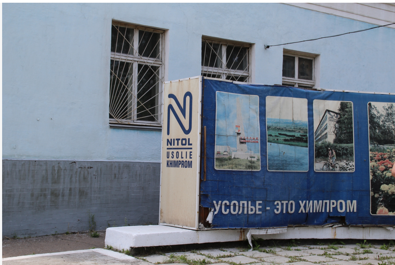
Автор: Даниил Тетерин Фото из альбома "Иркутская область. Усольский Химпром" © Фотобанк "RuBabr"

Автор: Миша Ковальски © Babr24.com ЭКОЛОГИЯ, ИРКУТСК 👁 20517 25.03.2022, 12:43