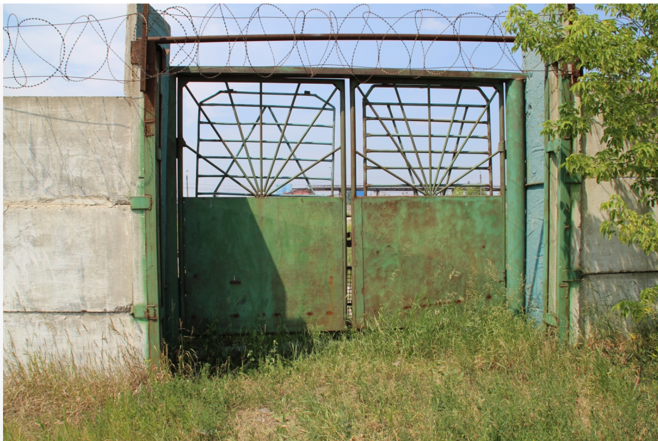
Автор: Даниил Тетерин Фото из альбома "Заборы" © Фотобанк "RuBabr"

Автор: Андрей Воронецкий © Babr24.com РАССЛЕДОВАНИЯ, ПРОИСШЕСТВИЯ, ТРАНСПОРТ, ТОМСК 👁 13993 24.03.2022, 09:46