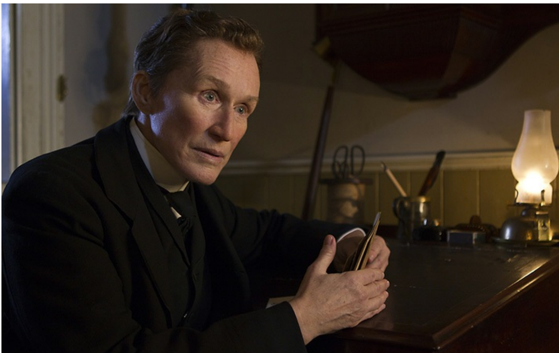
«Таинственный Альберт Ноббс», 2011 год