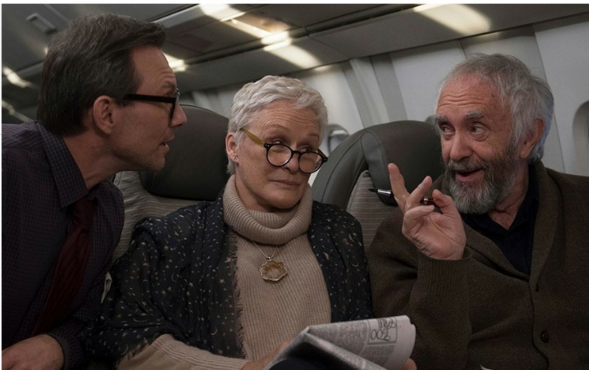
Джоан Каслман в фильме «Жена», 2017 год