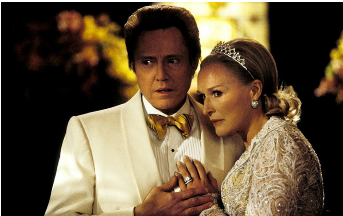
Веллингтон в фильме «Стэпфордские жёны», 2004 год

Вместе со славой выдающейся разноплановой актрисы за Glenn Cloуз тянется шлейф самой яркой неудачницы Голливуда, если таковой можно назвать трёхкратного лауреата премий «Золотой глобус», «Эмми» и «Тони», обладательницу именной звезды на «Аллее славы» и приза Donostia Сан-Себастьянского кинофестиваля за выдающиеся персональные достижения.