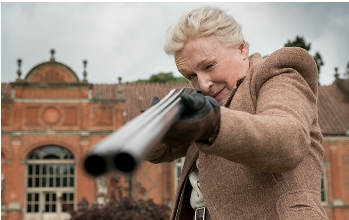
«Скрюченный домишко», 2017 год