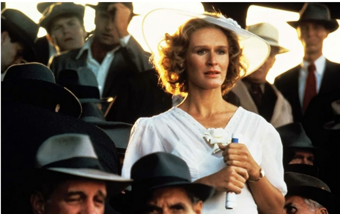
«Самородок», 1984 год