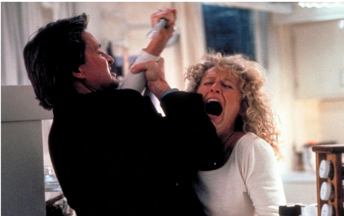
влечение», 1987 год