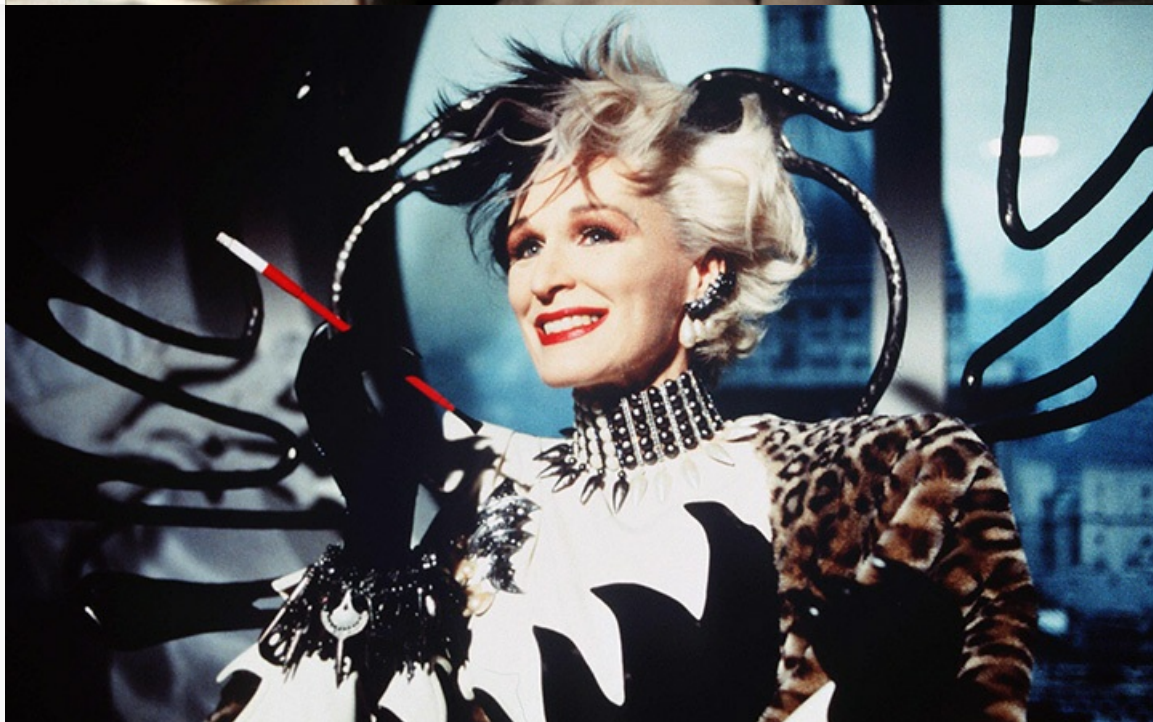
далматинец», 1996 год