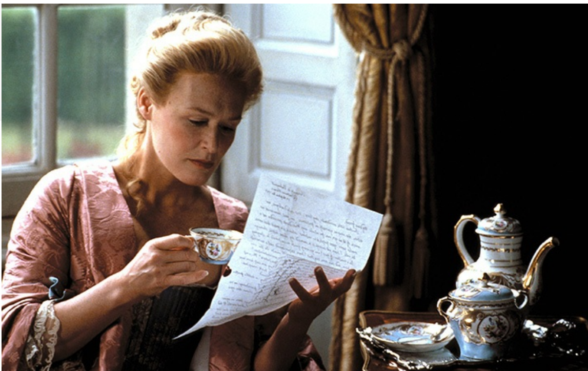
Изабелл де Мертей в фильме «Опасные связи», 1988 год

Разноплановость дарования актрисы вызывает восхищение у зрителей и критиков уже четыре десятилетия. Недаром Клоуз как-то заметила, что её послужной список – раздолье для психиатра.