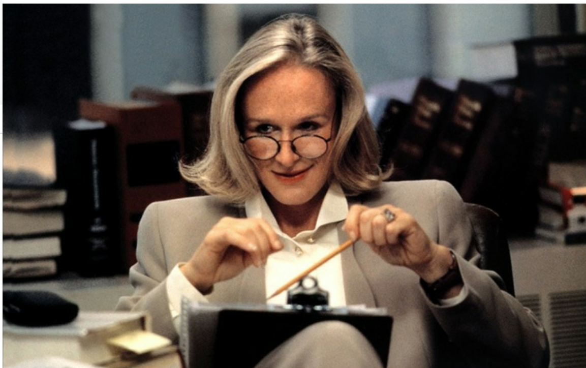
Круэлла Де Виль в фильме «101