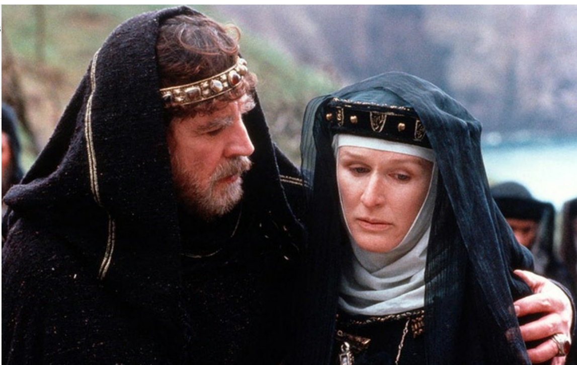
Гертруда в фильме «Гамлет», 1990 год

На сегодняшний день в фильмографии Клоуз более 60 незабываемых образов в фильмах и телесериалах самых различных жанров: от уморительной комедии и мелодрамы до исторической драмы и космической фантастики.