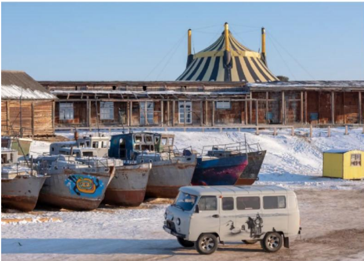
A typical Baikal transport, or "bukhanka," for tourists on Olkhon Island.

Интересна позиция бурятских властей, которые не предпринимали никаких мер против неэтичного развлечения. Они одержимы сферой туризма и стараются избежать решений, которые, по их мнению, затормозят её развитие. Даже если они вредят экологии и вызывают возмущение местных жителей. Народный гнев обрушивается на туроператоров и нерадивых туристов, но развязало им руки молчание республиканского правительства.