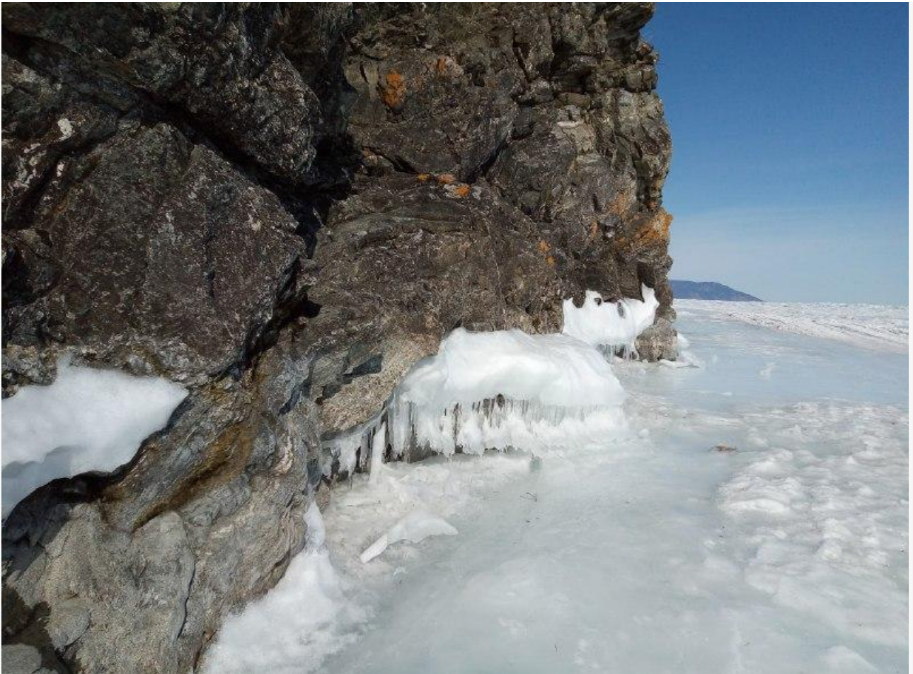
Фото ГУ МЧС России по Иркутской области

Автор: Алина Саратова © Babr24.com ГЕО, ПРОИСШЕСТВИЯ, ИРКУТСК, БАЙКАЛ 👁 9194 06.03.2022, 10:37 👍 816