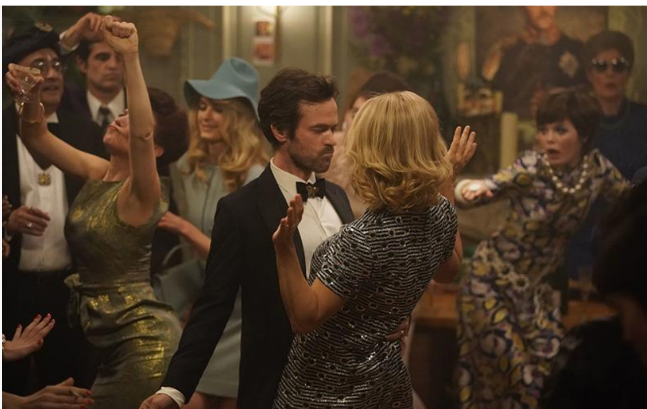
Кадр из фильма «Эта безумная любовь»

Также в прокате с 3 марта российская драма Александра Золотухина « Брат во всём », французская трагикомедия « От кутюр », британский хоррор « Опасная вечеринка », франко-бельгийская драма « Эта безумная любовь », обладатель Гран-при жюри Каннского кинофестиваля « Герой » (Франция, Иран), номинант на «Золотую пальмовую ветвь» в тех же Каннах « История моей жены » (Германия, Венгрия, Франция, Италия), германо-австрийский мультфильм « Лунные приключения » и сразу три перевыпуска фильмов прошлого: « Господин Никто » 2009 года (18+), « Три цвета: Белый » 1993-го (18+) и « Касабланка » 1942-го.