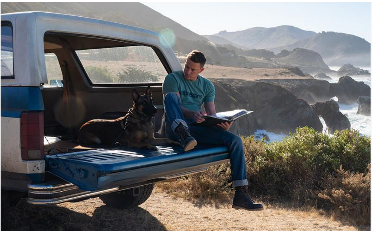
Кадр из фильма «Лулу и Бриггс»

Ещё одна более-менее успешная премьера минувших выходных – франко-бельгийский мультфильм «Кролецып и Хомяк Тьмы» , с суммой 33,3 миллиона занявший пятое место.