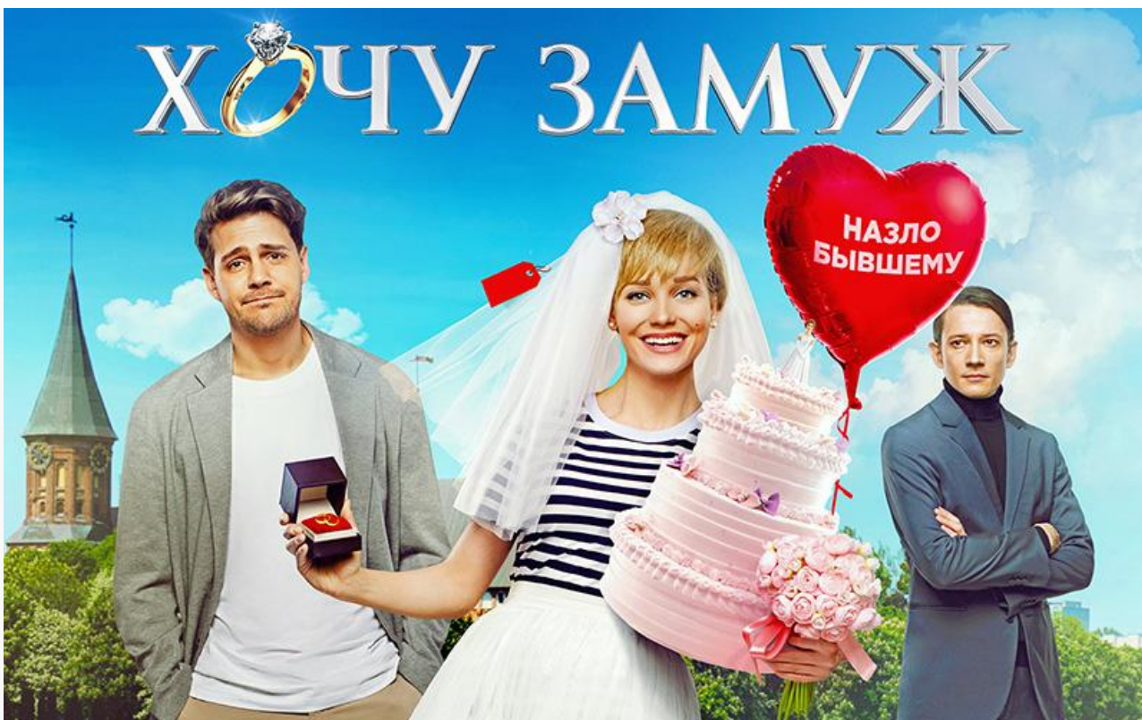
Постер к фильму «Хочу замуж»

Также в прокате с 3 марта российская драма Александра Золотухина « Брат во всём », французская трагикомедия « От кутюр », британский хоррор « Опасная вечеринка », франко-бельгийская драма « Эта безумная любовь », обладатель Гран-при жюри Каннского кинофестиваля « Герой » (Франция, Иран), номинант на «Золотую пальмовую ветвь» в тех же Каннах « История моей жены » (Германия, Венгрия, Франция, Италия), германо-австрийский мультфильм « Лунные приключения » и сразу три перевыпуска фильмов прошлого: « Господин Никто » 2009 года (18+), « Три цвета: Белый » 1993-го (18+) и « Касабланка » 1942-го.