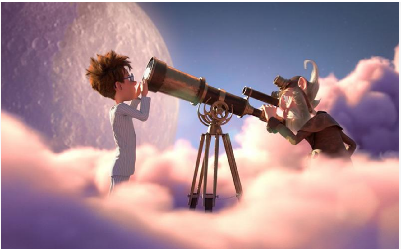
Кадр из фильма «Лунные приключения»