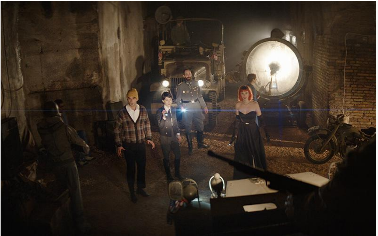
Кадр из фильма «Клаустрофобы. Начало»

Общая касса топ-20 фильмов уикенда, согласно данным «Бюллетеня кинопрокатчика», составила 419 миллионов рублей (с учётом стран СНГ – 453 миллиона). Это на 26,7 % меньше, чем неделей ранее.