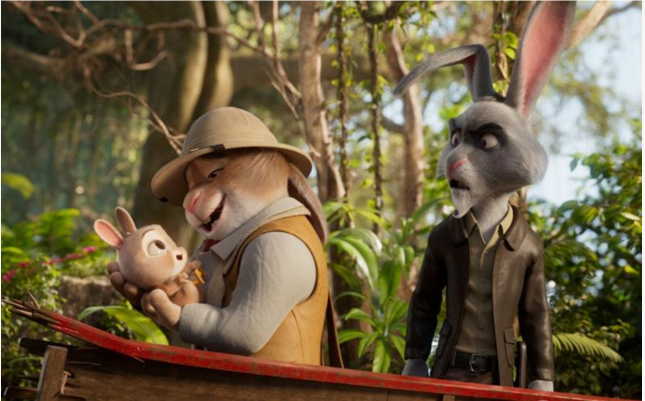
Кадр из фильма «Кролецып и Хомяк Тьмы»

Российские премьеры предыдущего уикенда серьёзно сдали позиции, что свидетельствует об отрицательном «сарафане». «Одиннадцать молчаливых мужчин» потеряли в сборах 57 % и опустились с третьего на шестое место, а военная драма «Однажды в пустыне» с потерями в 65 % с треском вылетела из топ-10 сразу на 15 место. О невысокой оценке этих фильмов зрителями свидетельствуют и рейтинги: всего 6,0 на «КиноПоиске» и 5,9 на IMDb у «Мужчин» и 6,5 на «КиноПоиске» и 4,7 на IMDb у «Пустыни».