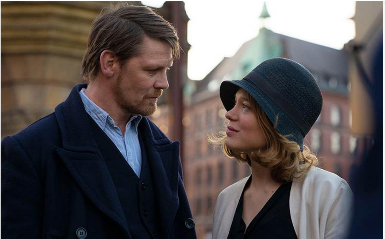
Кадр из фильма «История моей жены»