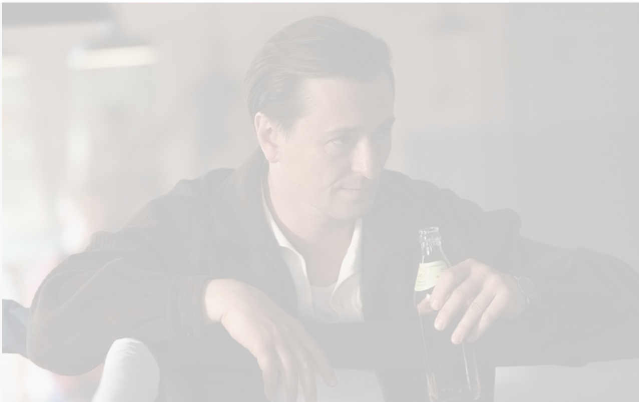
Сергей Безруков в фильме «Мистер Нокаут»

Ещё одна российская премьера – киноальманах «Папы» опять же с Сергеем Безруковым в одной из главных ролей – собрала на 1 233 экранах 11,9 миллиона рублей и заняла по итогам уикенда девятое место.