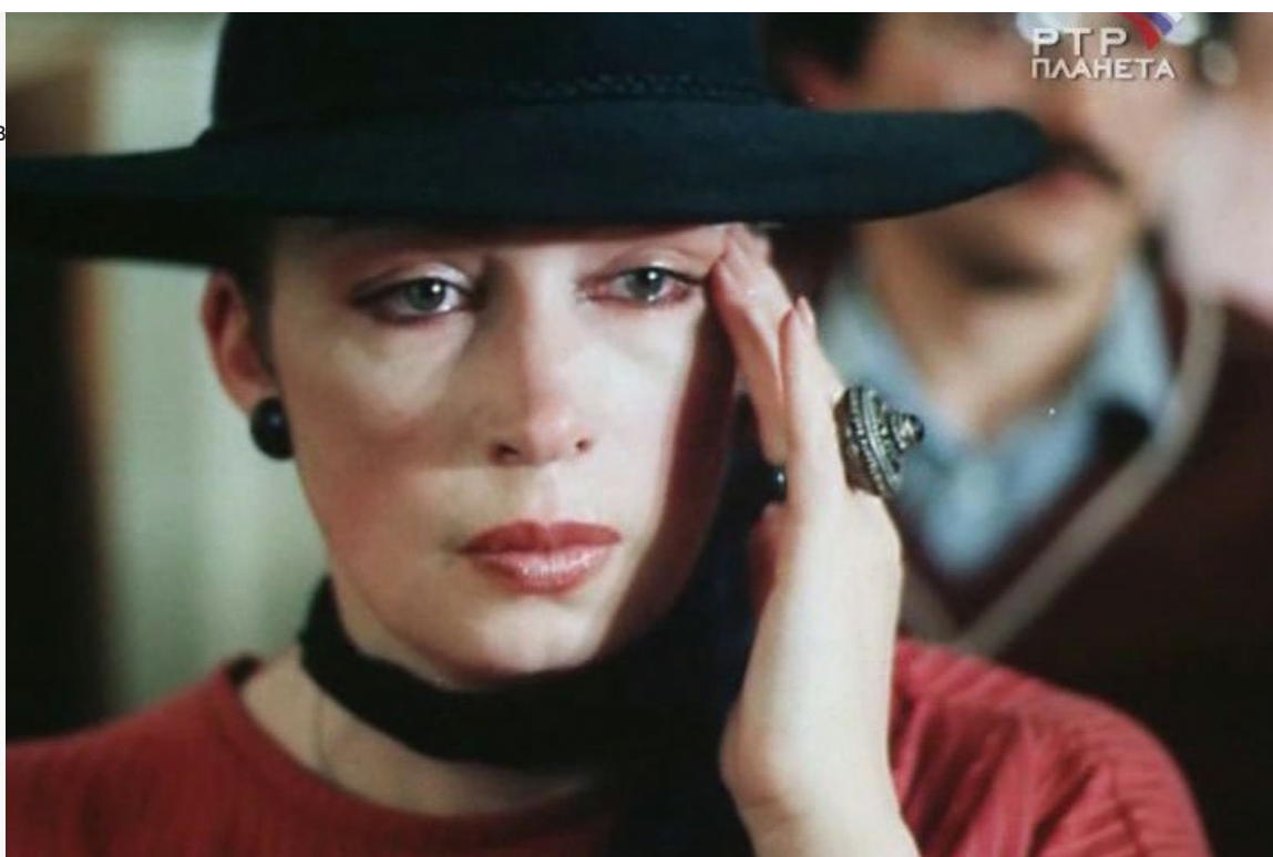
«Переступить черту», 1985 год