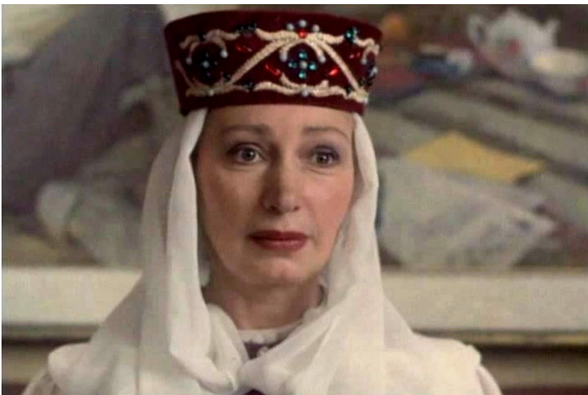
Елена Орехова в фильме «Увидеть Париж и умереть», 1992 год