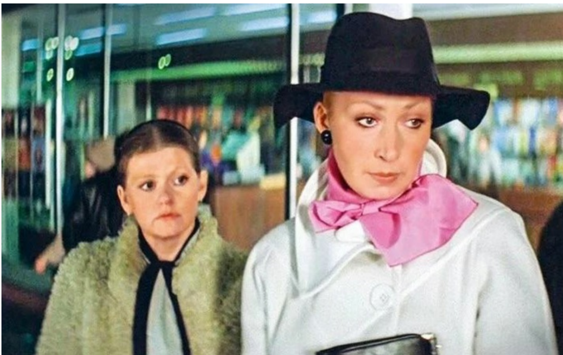
обаятельная и привлекательная», 1985 год

Роль Елены в мелодраме Александра Прошкина «Увидеть Париж и умереть» принесла актрисе Национальную кинопремию «Ника» в категории «Лучшая женская роль» и Приз за лучшую женскую роль кинофестиваля «Кинотавр».