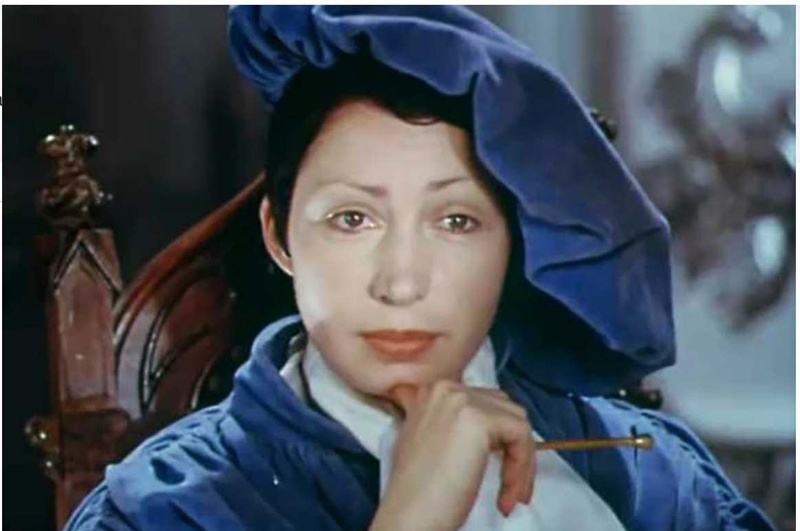
Прокурор в фильме «Адам женится на Еве», 1980 год