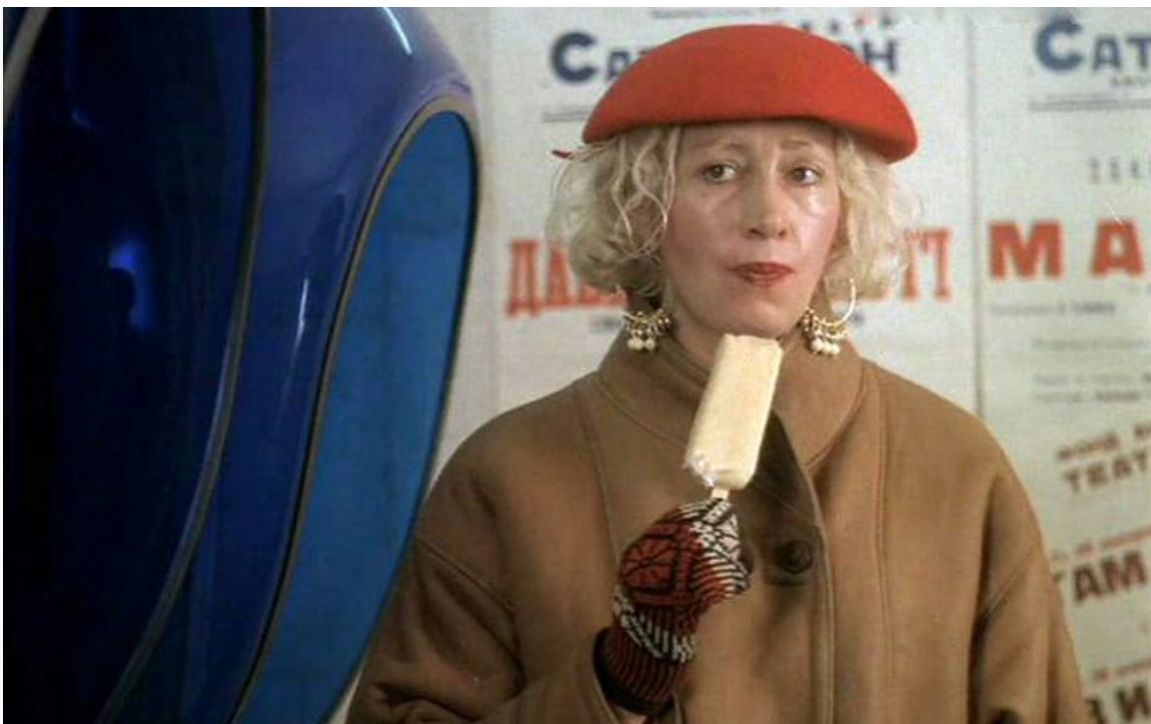
«Бабник 2», 1992 год