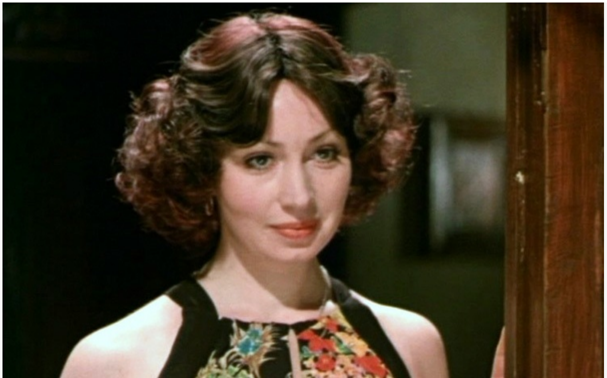
Ираида в фильме «Добряки», 1979 год