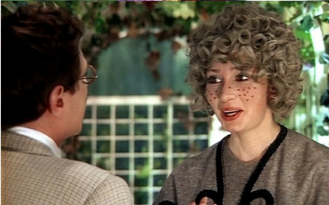
«Здравствуйте, я ваша тётя!», 1975 год