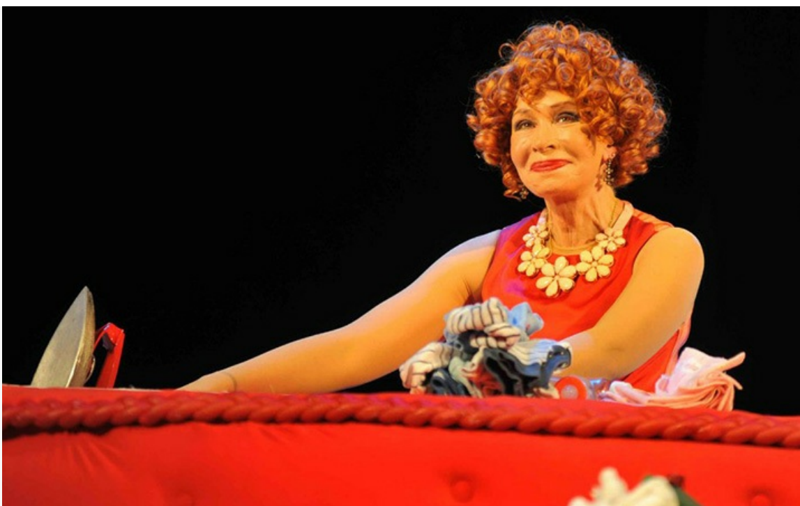
канарейки». Театральная компания «Маскарад», постановка 2013 года