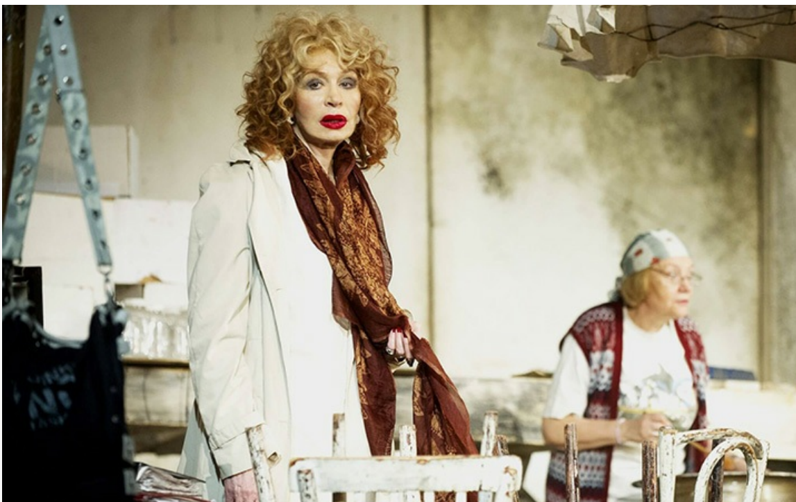
современной пьесы», постановка 2007 года