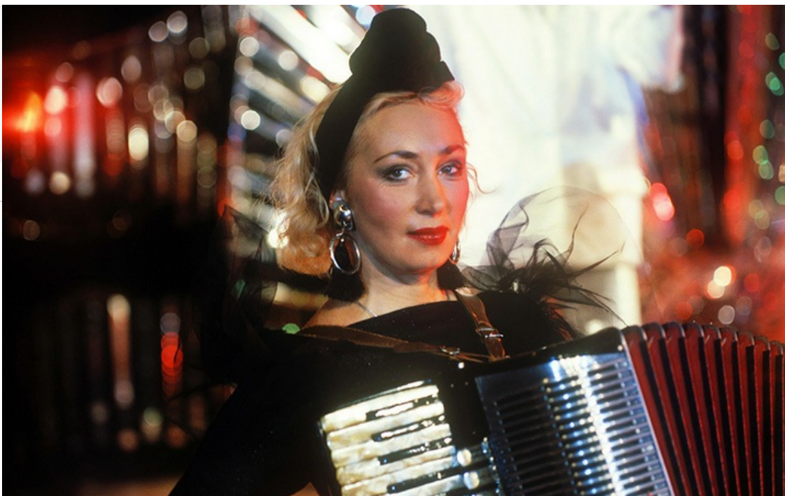
Татьяна Пташук в фильме «Моя морячка», 1990 год

За роль продюсера Ларисы Ивановны в музыкальной драме Елены Николаевой «Попса» Татьяна Васильева была удостоена премии кинокритиков «Золотой овен».