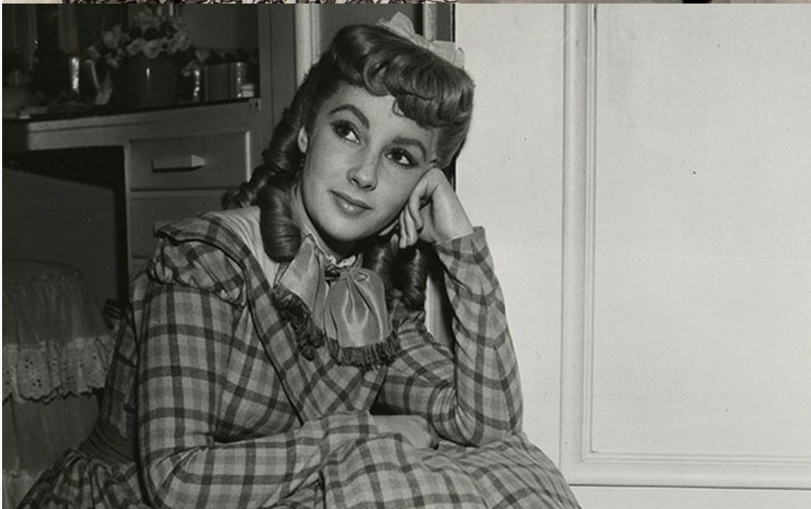
«Маленькие женщины», 1949 год