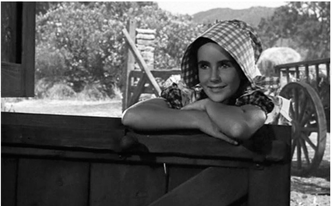
Вельвет Браун в фильме