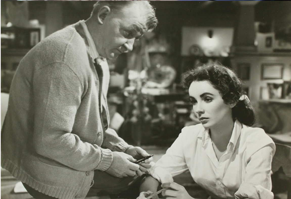
когда-либо», 1952 год