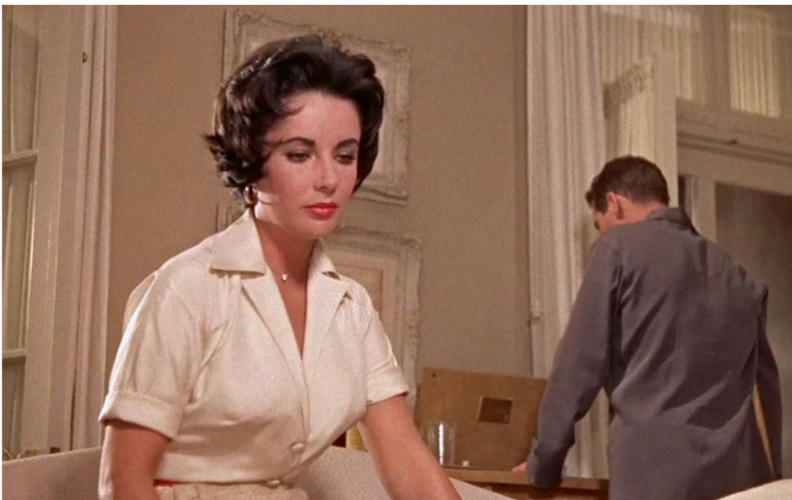
раскалённой крыше». Номинации на премии «Оскар» и BAFTA, 1958 год