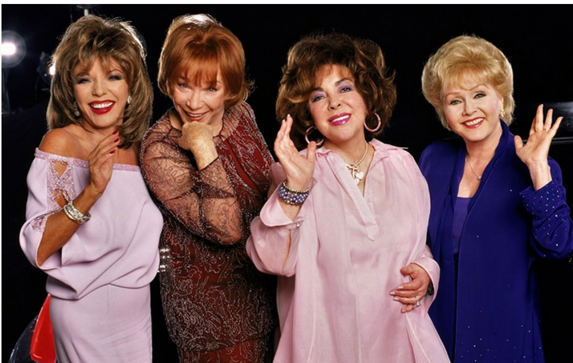
телефильме «Старые клячи по-американски», 2001 год

Элизабет Тейлор скончалась 23 марта 2011 года в возрасте 79 лет. Похоронили одну из ярчайших звёзд в истории мирового кино в мемориальном парке «Форест-Лаун» в Глендейле.