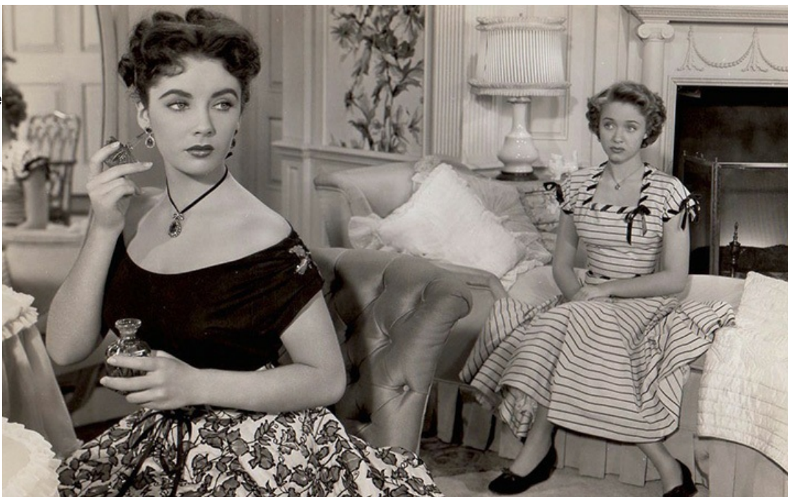
Эми Марч в фильме