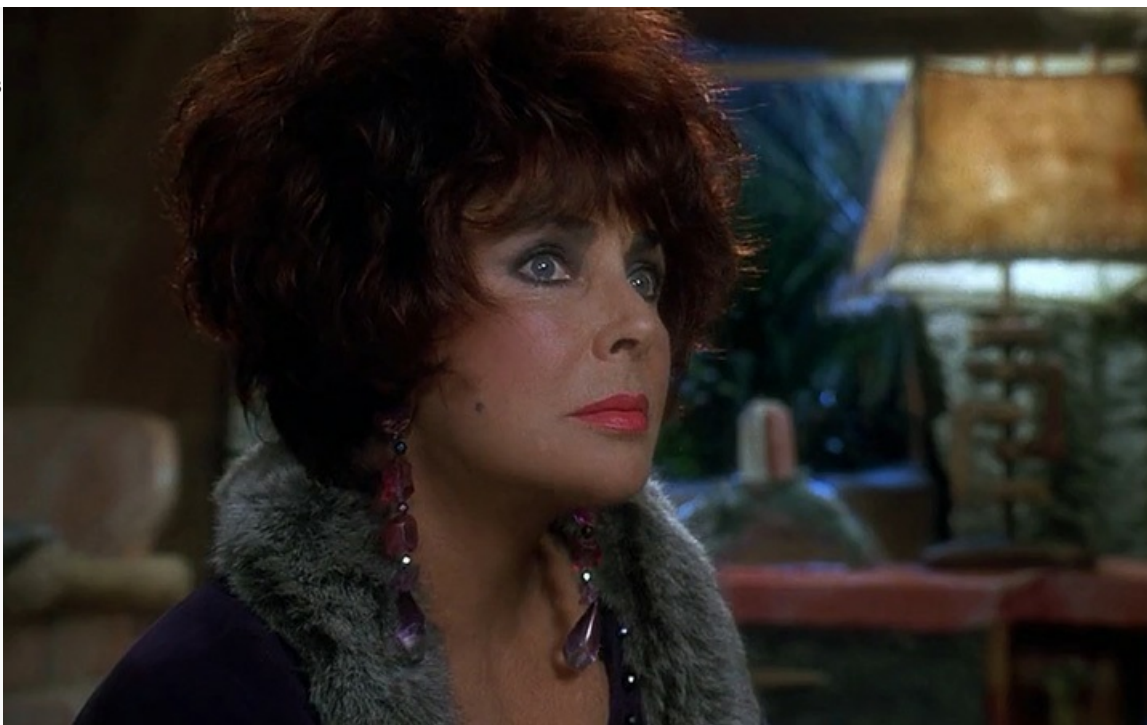
«Флинстоуны». Последняя роль в кино, 1994 год