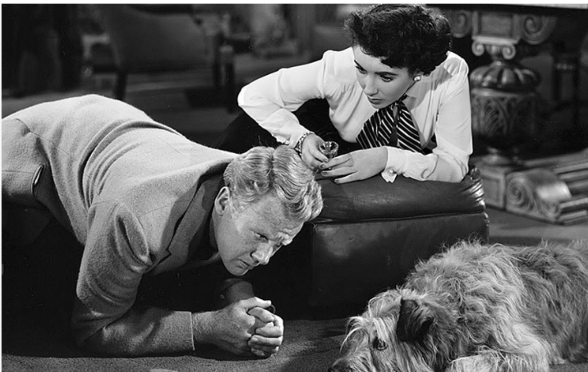
похмелье», 1950 год

Успешно перешагнув порог совершеннолетия, Лиз Тейлор без какой-либо передышки продолжила активно сниматься дальше. Главные роли сыпались одна за другой, а в 1958 году пришло и признание критиков: 26-летняя актриса с 16-летним стажем была впервые номинирована на премию «Оскар» в категории «Лучшая женская роль» за роль Сюзанны в фильме Эдварда Димитрика «Округ Рэйнтри».