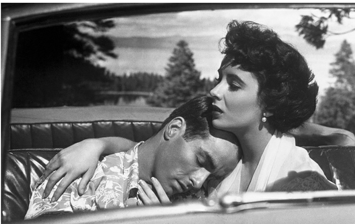
Анджела в фильме «Место под солнцем», 1951 год

Успешно перешагнув порог совершеннолетия, Лиз Тейлор без какой-либо передышки продолжила активно сниматься дальше. Главные роли сыпались одна за другой, а в 1958 году пришло и признание критиков: 26-летняя актриса с 16-летним стажем была впервые номинирована на премию «Оскар» в категории «Лучшая женская роль» за роль Сюзанны в фильме Эдварда Димитрика «Округ Рэйнтри».