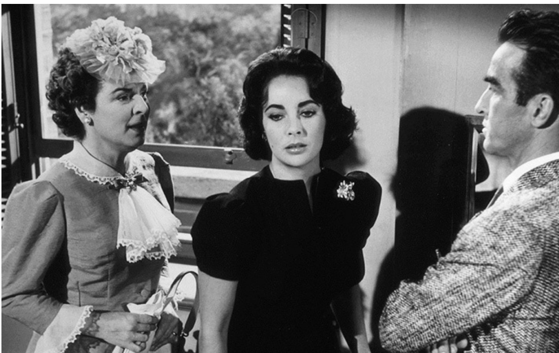
«Внезапно, прошлым летом». Номинация на «Оскар», премия «Золотой глобус», 1959 год