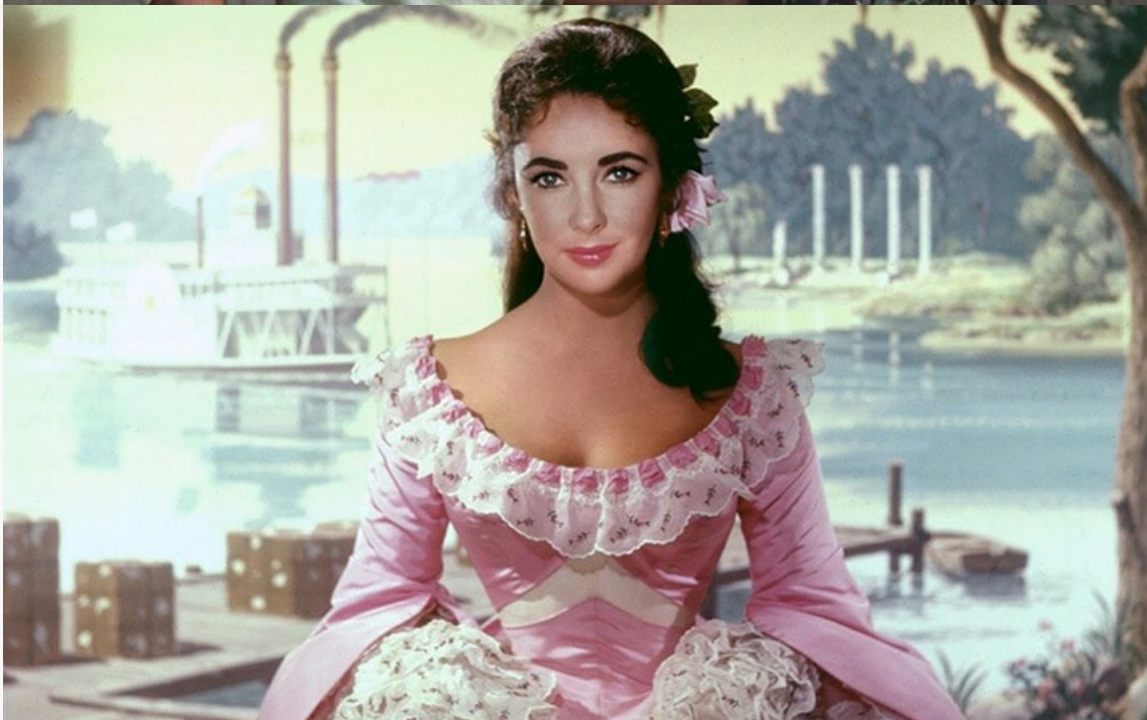
Номинация на премию «Оскар», 1957 год

Всего легендарная «королева Голливуда» снялась в 65 фильмах. Поистине звёздными ролями актрисы стали Мэгги в «Кошке на раскалённой крыше» Ричарда Брукса, Кэтрин в психологической драме Джозефа Манкевича «Внезапно, прошлым летом», Глория в мелодраме Дэниэла Манна «Баттерфильд 8», принеся актрисе долгожданного «Оскара», уже упомянутая Клеопатра, Марта в «Кто боится Вирджинии Вульф» Майка Николса, Катарина в «Укрощении строптивой» Франко Дзеффирелли.