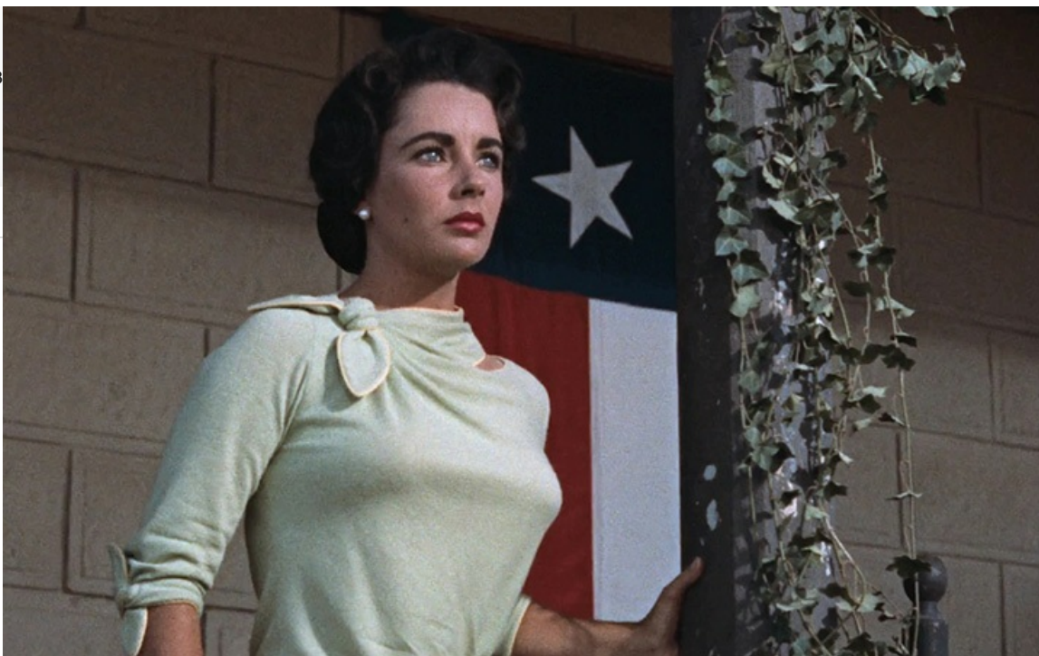
Сюзанна Дрейк в фильме «Округ Рэйнтри».