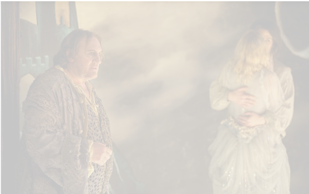
Кадр из фильма «Человек, который смеётся». Франция, Чехия, 2012 год

Смерть – это свобода, даруемая вечностью.