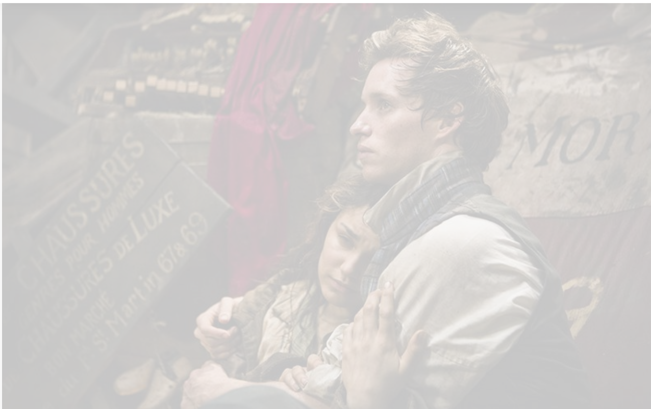
Кадр из фильма «Отверженные». Великобритания, США,