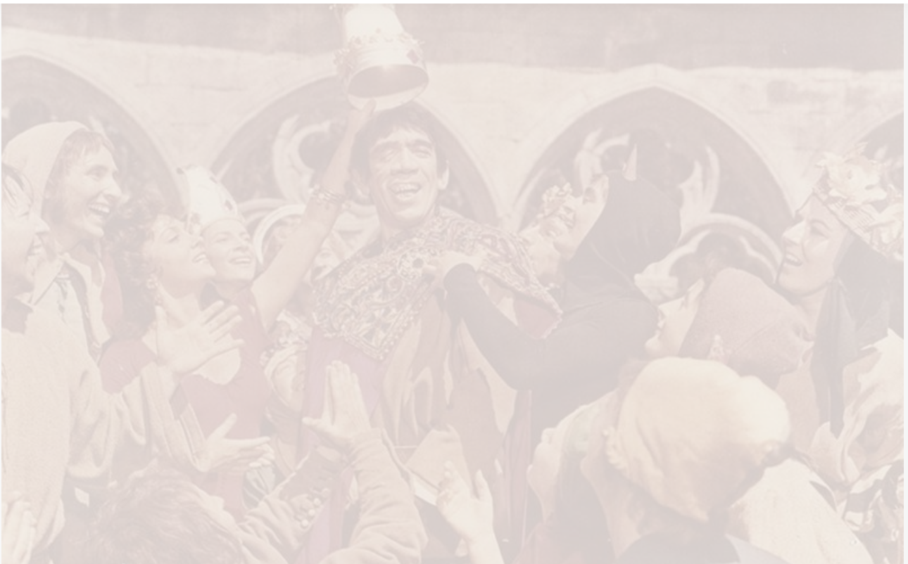
Кадр из фильма «Собор Парижской Богоматери». Франция, Италия, 1956 год

Сильное отчаяние, как и сильная радость, не может продолжаться долго.