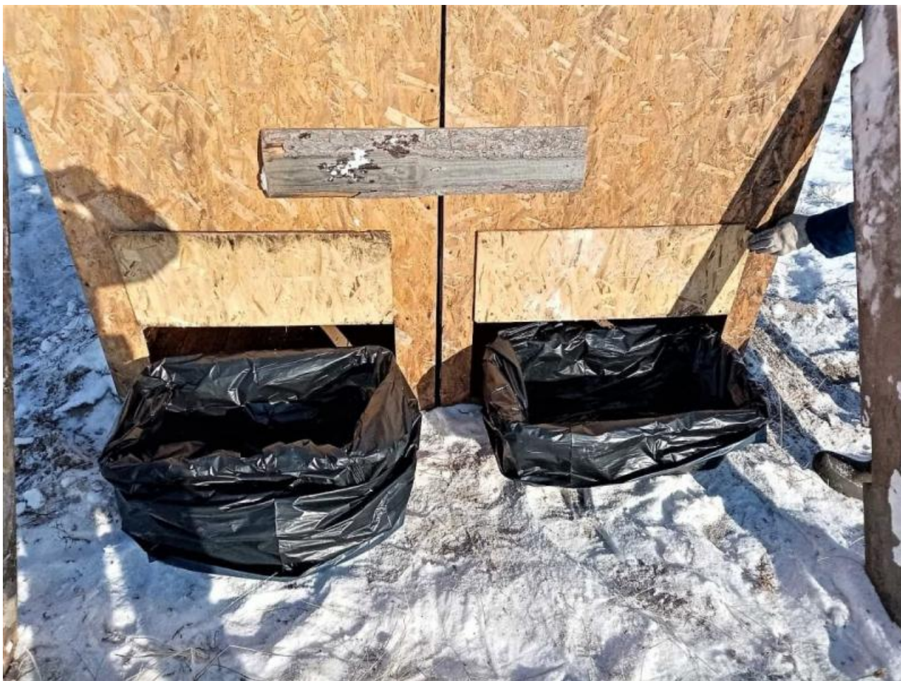
Коробочка и пакетик.

Думаем, что эти фотографии наглядно показывают, как работает «Заповедное Прибайкалье» и на что идут деньги туристов. Уже который год учреждение портит красочный праздник своей «работой».