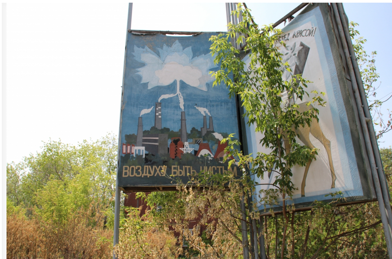
Автор: Даниил Тетерин Фото из альбома "Иркутская область. Усольский Химпром" © Фотобанк "RuBabr"

Поэтому участие «Росатома» в столь престижном фестивале очень сомнительно.