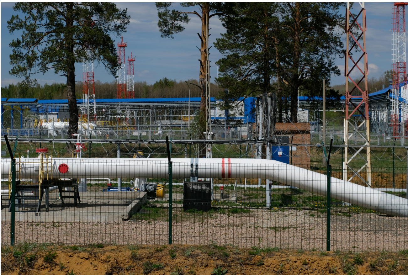
Автор: Алёна Штерн Фото из альбома "Нефтепроводы" © Фотобанк "RuVabr"

Схему попыталась поменять Транснефть в 2019 году, после аварии на Дружке, когда аналогичное малое предприятие нефтедобычи сумело приобрести в свою собственность узел учета и гнать через него на Новокуйбышевский завод десятки тысяч тонн нефти при годовой добыче в 2-3 тысяч тонн.