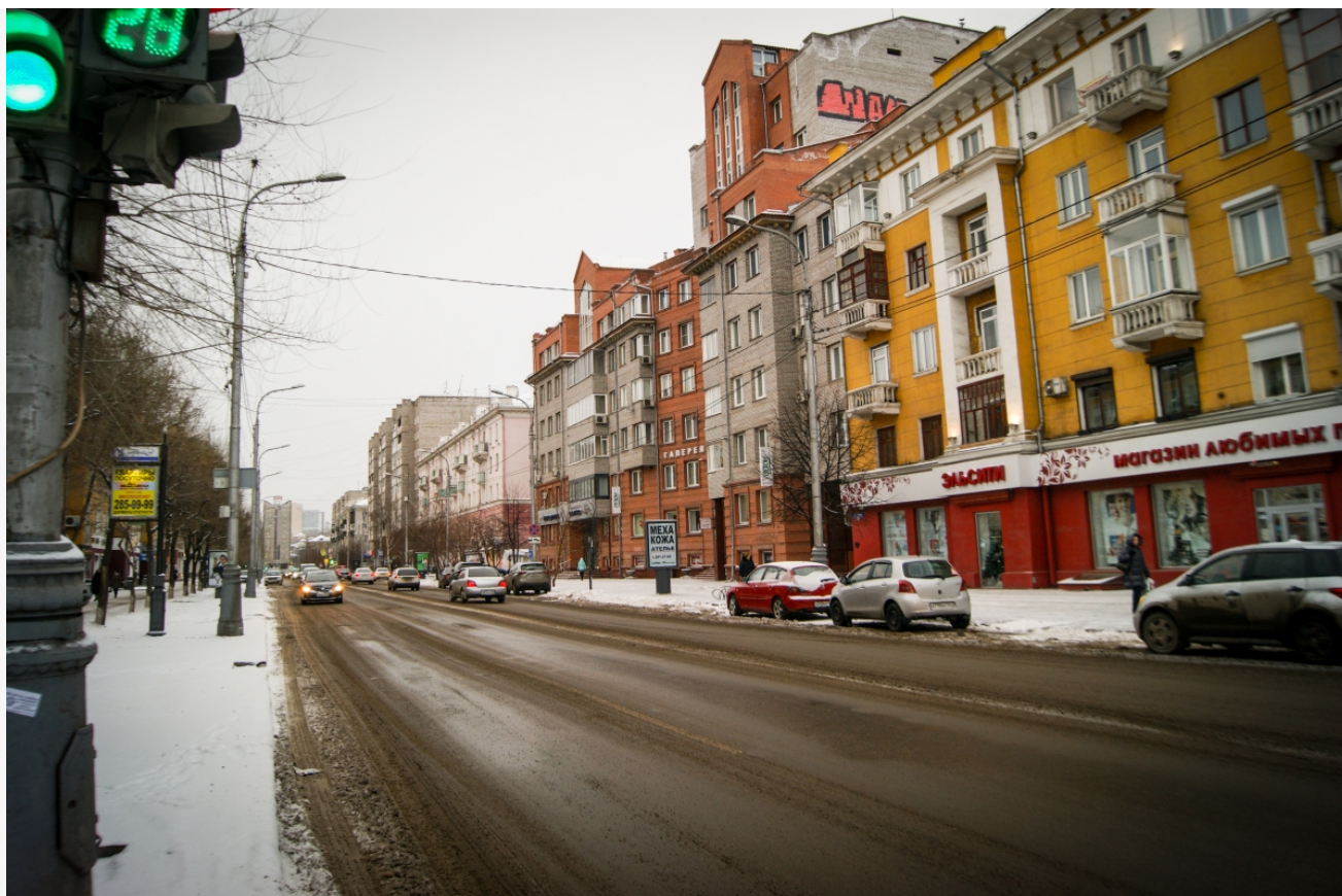
Автор: Анна Тютрюмова Фото из альбома "Красноярск. Зима" © Фотобанк "RuBabr"

Однако, видится, что такая ситуация имела бы место быть, живи мы в другой стране. На деле же получается, что «РостТех», долгое время работающий с многочисленными нарушениями (например, буквально насилует полигон «Шинник» и отравляет тем самым свалочными газами жителей окрестных домов и дач), неожиданно получает звание одного из лучших регоператоров страны. Просто так ведь оно не дается (будем верить). А после без объявления войны лишается статуса и огромной доли рынка. В суде юристы, наверняка, будут показывать грамоты, а жители правого берега совершенно бесплатно придут рассказать, как им хорошо выбрасывалось мусор при компании господина Шепелева.