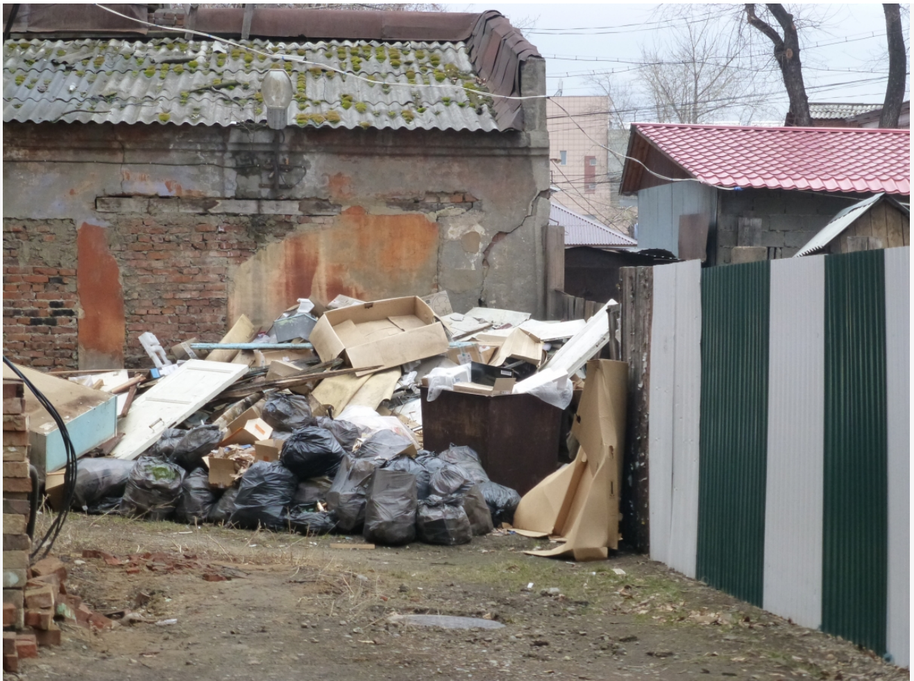
Автор: Даниил Тетерин Фото из альбома "Мусор" © Фотобанк "RuBabr"

Не случайно в правительстве Красноярского края частная концессионная инициатива «КРК» по строительству современного мусоросортировочного комплекса пылится уже третий год. А правительство у нас возглавляет кто? Лапшин. Логично, что, если бы он хотел развивать отрасль с участием «КРК», так бы не «морозился». И вывод здесь простой - левобережный оператор всех устраивает, но сугубо в левобережных границах.