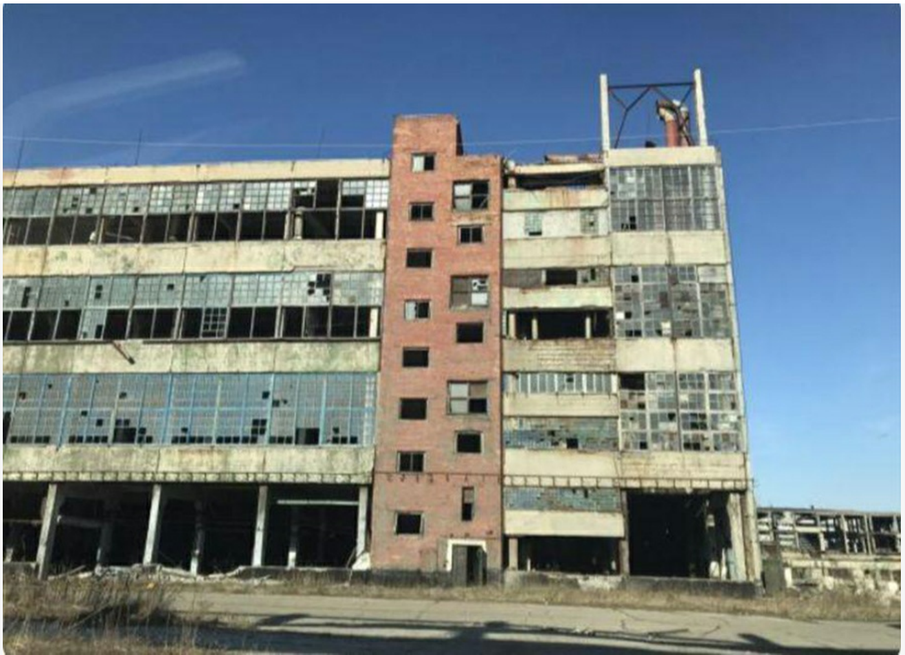
Фото из альбома "Иркутская область. Усольский Химпром" © Фотобанк "RuBabr"

Автор: Миша Ковальски © Babr24.com ЭКОЛОГИЯ, ИРКУТСК 👁 21540 11.02.2022, 14:57 📌 702 URL: https://babr24.com/?IDE=224815 Bytes: 2821 / 2503 Версия для печати Скачать PDF