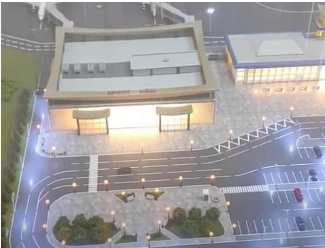
Макет нового терминала

Бабр продолжит внимательно следить за событиями.